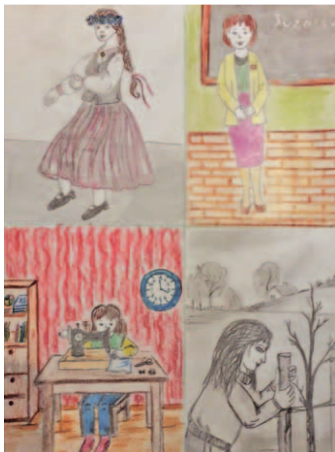
Daži 5. kl. izglītojamo zīmējumi par profesijām novadā.

- Mans atklājums bija tas, ka anketā iegūtie rezultāti norādīja, ka mani saista pedagoģija un izglītība. Turpmāk aizdomāšos par karjeras izvēli arī šajā jomā.