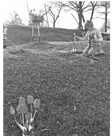
Artūrs veido savu ziedu sveicienu.

Saukas bibliotēkas vadītāja V. Lāce