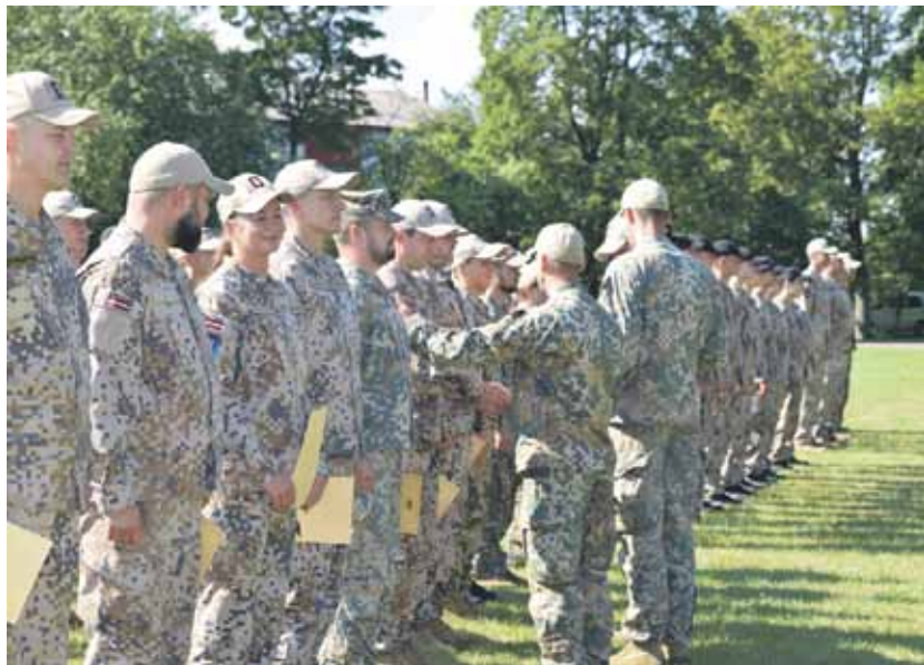
Jaunsardzes instruktori Rudbāržos desmit dienas apguva lauka kaujas iemaņas, lai tālāk tās nodotu jaunsargiem.

Bijušajā Oskara Kalpaka Rudbāržu pamatskolā, kurā drīzumā izveidos jauno kadetu skolu, desmit dienas darbojās instruktori, kuri tālāk zināšanas nodos jaunsargiem. Šoreiz viņi apguva to, kā iemācīt lauka kaujas iemaņas.