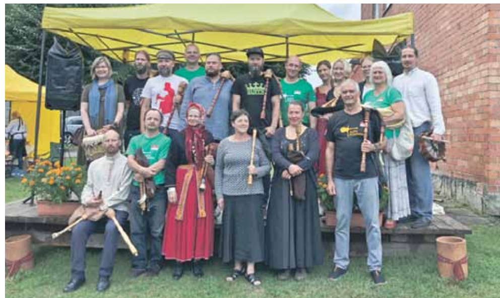
Otrās dūdu darbnīcas un trešā dūdinieku saieta dalībnieki pēc koncerta Suitu tirgū Alsungā.

Ar meistarklasēm, kurās ap 20 cilvēku no Latvijas paplašināja dūdu spēles prasmi, un koncertiem vietējo priekam Alsungā noritēja otrā tradicionālo dūdu darbnīca un trešais Latvijas dūdinieku saiets.