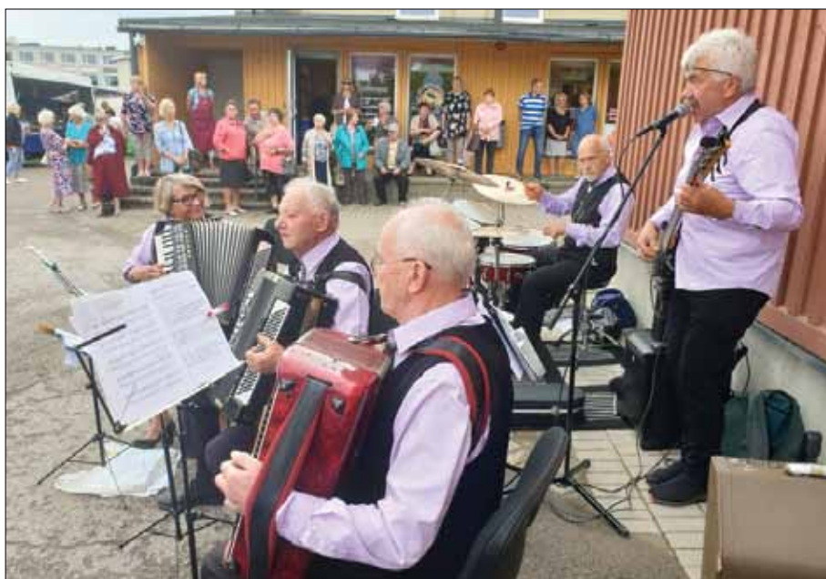
Saldus senioru akordeonistu ansamblis "Akords" muzicē Saldus tirgū. "Saldie vārti" vērsās arī pie autoostas, bankas, kafejnīcām un citviet Saldū.

izglītības, nebija augstās domās par sevi. Taču saietos daudzi pārvarēja bīklumu, ieguva pašapziņu un iesaistījās amatiermākslā.