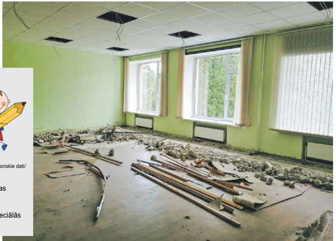
Kuldīgas, Alsungas un Skrundas novada skolas šo mācību gadu sāks klātienē. Kuldīgas 2. vidusskolā remonta dēļ stundas notiks divās ēkās: sākot ar 7. klasi, līdz janvārim audzēkņi mācīsies Ventspils ielā 16, pārējie – ierastajā ēkā.

45 sākumskolas un 49 speciālās izglītības iestādes.