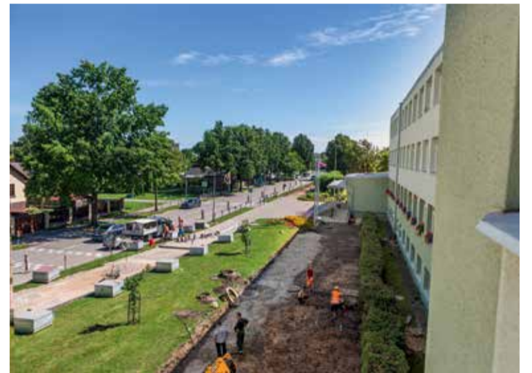
Jelgavas Spīdolas Valsts ģimnāzijā tiek veidoti četri dabaszinātņu kabineti un atjaunots gaitenis. Betonējot grīdas, klasēs tiek izbūvēti elektrotīkli, kas nodrošinās jaunā aprīkojuma – praktiskajiem darbiem paredzētu galdus, interaktīvo ekrānu un laboratorijas darba staciju – darbību. Tāpat būvdarbi notiek skolas pagalmā, kur tiek izbūvēta sakaru kanalizācija un atjaunots ietves segums, vienlaikus izveidojot arī 140 jaunas velonovietnes. Jāpiebilst, ka līdz šim pie skolas bija tikai 40 velonovietnes. Savukārt kosmētiskais remonts veikts atsevišķās klašu telpās.