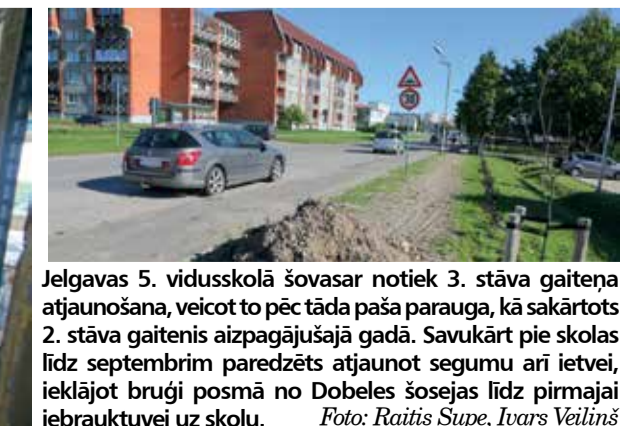
Jelgavas 5. vidusskolā šovasar notiek 3. stāva gaitenī atjaunošana, veicot to pēc tāda paša parauga, kā sakārtots 2. stāva gaitenis aizpagājušajā gadā. Savukārt pie skolas līdz septembrim paredzēts atjaunot segumu arī ietvei, iekļaujot bruģi posmā no Dobeles šosejas līdz pirmajai iebrauktuvei uz skolu.