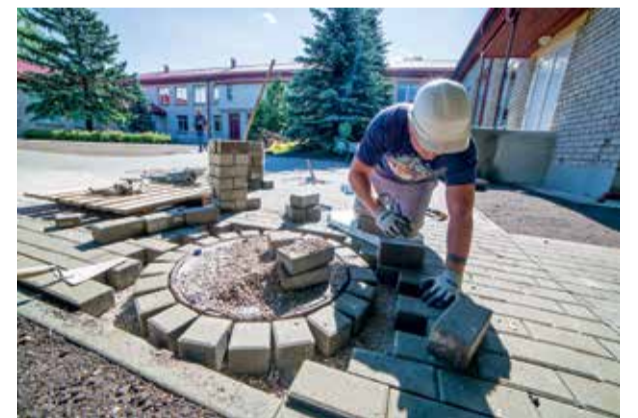
Jelgavas pamatskolā «Valdeka»-attīstības centrā šovasar līdz ar pamatu siltināšanu daļā pagalma ieklāts bruģis, aizstājot savu laiku nokalpojušo asfalta segumu. Tas bērniem atvieglā pārvietošanos pa pagalmu, un skolā cer, ka turpmākajos gados seguma nomainīšanu varēs turpināt, vienlaikus ierīkojot arī lietussūdens kanalizāciju.