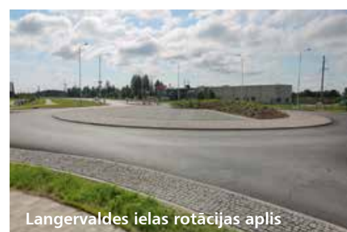
Langervaldes ielas rotācijas aplis