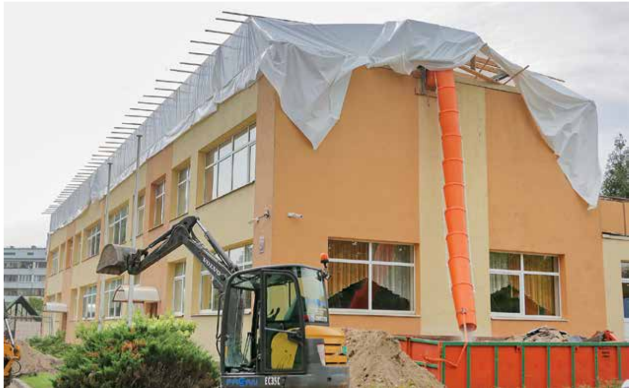
Pirmskolas izglītības iestādē «Kamolītis» sākusies jumta pārbūve. Šis ir viens no pēdējiem pašvaldības bērnu dārzkiem ar pagājušā gadsimta otrajā pusē izbūvēto plakano jumtu. Šāds jumts rada problēmas, jo uzkrāj ūdeni, bet ar jauno četrslīpju jumtu un lietussūdens novadišanas sistēmu nokrišņi vairs neradīs bojājumus.

Savukārt Jelgavas 5. vidusskolā tiek atjaunots trešā stāva gaitenis. Pirms diviem gadiem līdzīgi sakārtots gaitenis otrajā stāvā, un arī šobrīd tiek veikti apdares darbi, mainīts grīdas segums un klašu durvis. Vienlaikus ēkas trešajā stāvā atjaunotas divas tualetu telpas. Šī projekta izmaksas ir 50 000 eiro.