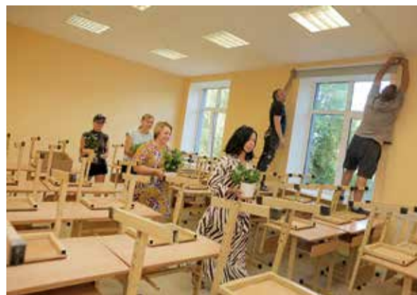
Lai ēkā Mātera ielā 30 rudenī mācības varētu uzsākt Jelgavas Tehnoloģiju vidusskolas 1.–4. klašu skolēni, šobrīd tiek pielāgotas telpas jaunāko klašu vajadzībām, kā arī ierīkots datu pārraides tīkls un veikti elektromontāžas darbi. Telpu iekārtošanā palīdz skolēni un personāls.