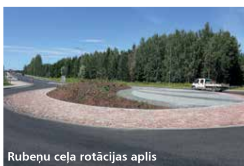
Rubeņu ceļa rotācijas aplis