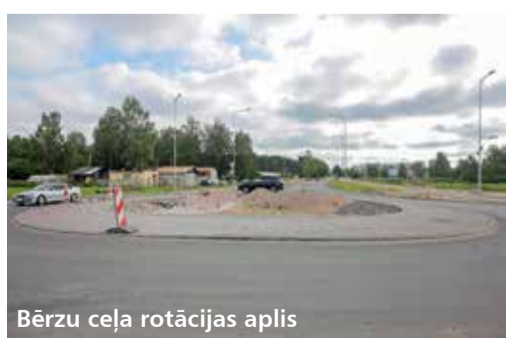
Bērzu ceļa rotācijas aplis