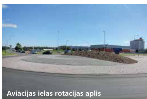
Aviācijas ielas rotācijas aplis