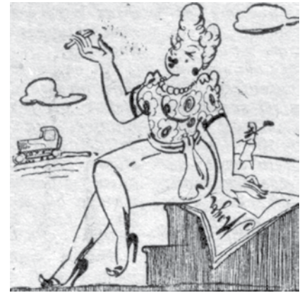
Padomju Kuldīga, 1959. g. 22. marts, no rubrikas Kritikas gaismā

– Ak pavasar, ak pavasar, Kādēļ tu lopiem pāri dar’?