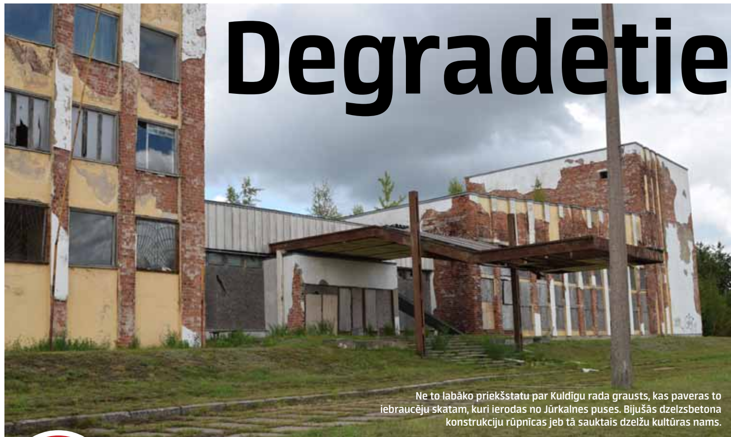
Ne to labāko priekšstatu par Kuldīgu rada grausts, kas paveras to iebraucēju skatam, kuri ierodas no Jūrkalnes puses. Bijušās dzelzsbetona konstrukciju rūpnīcas jeb tā sauktais dzelzu kultūras nams.

Mediju atbalsta fonda ieguldījums no Latvijas valsts budžeta līdzekļiem. Par materiāla saturu atbild laikraksts Kurzemnieks.