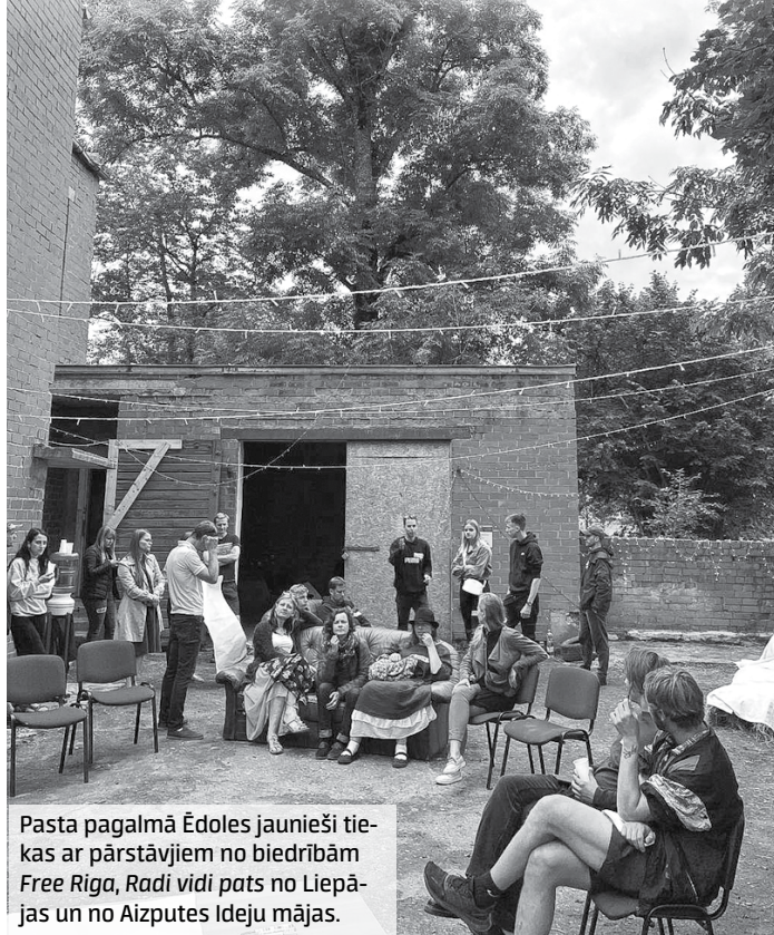
Pasta pagalmā Ēdoles jaunieši tiekas ar pārstāvjiem no biedrībām Free Riga , Radi vidi pats no Liepājas un no Aizputes Ideju mājas.

Pateicoties aktīvu ēdolnieku grupai un pasta ēkas īpašnieku vēlmei sadarboties, pagasta centrā top atpūtas un aktivitāšu vieta jauniešiem.