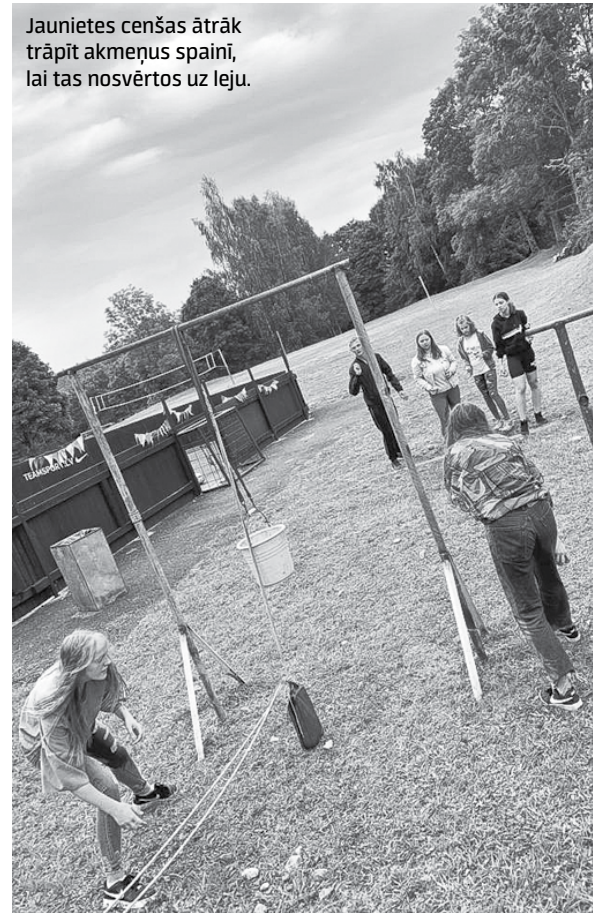
Jaunietes cenšas ātrāk trāpīt akmeņus spainī, lai tas nosvērtos uz leju.

lai viss ir, kā plānots. Pateicoties tam, ka man ir tik laba komanda, viss izdevās labi. Pirms tam jau kādu nedēļu veidojām dekorācijas, meklējām inventāru stafetēm. Šī man ir laba pieredze. Es jau esmu izvērtējusi savas veiksmes un neveiksmes un plānoju nākamgad rīkot kaut ko līdzīgu.”