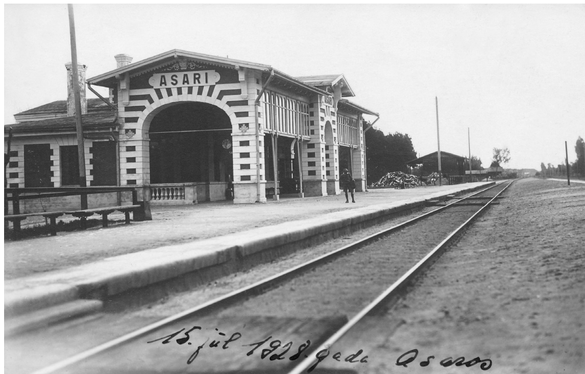
Dzelzceļa stacija "Asari" 1928. gadā

Lasot savas mātes piezīmes, gluži kā caur atvērtu logu es varu ieskatīties viņas bērības un jaunības dienu gaitās. Māte raksta: "...tās bija arī manas mājas, kur pavadīju visu savu agro bērību, augot pieticībā kā pie Dieva, tā cilvēkiem, arvien ņemot dalību attiecīgā vecumā piemērotos darbos, ieskaitot septiņas vasaras ganu gaitās. Tur arī guvu savus pirmos, pat līdz šim neizdzēšamos iespaidus, saaugot ar dabu, vienkāršo sūra darba pilno dzīvi un turienes ļaudīm, kuriem visiem, šķiet, bija godaprāts un skaidra sirds..."