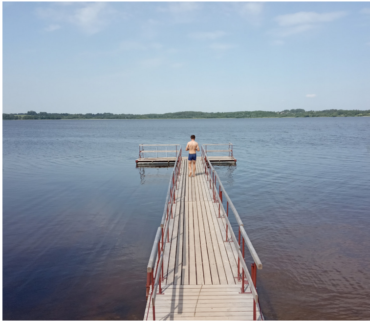
Lielais Ludzas ezers

Bet 20. gadsimta sākumā Daugavpils nebija ne krieviska, ne latviska. Teju puse pilsētas iedzīvotāju runāja jidišā, pilsētā bija 40 sinagogas, šodien – viena. Zināmākais Latvijas cilvēks pasaulē joprojām ir Daugavpilī dzimušais ebreju izcelsmes amerikāņu gleznotājs Marks Rotko – seši miljoni citējumu Google tīmekļa meklētājā. Vienīgais, kas viņam patlaban spējis pietuverties, ir basketbolists Kristaps Porziņģis – 4, 5 miljoni. Katru reizi, kad ierodos Daugavpilī, es apmeklēju seno cietoksni un tajā iekārtoto Marka Rotko Mākslas centru. Te izstādīti arī vairāki Rotko oriģināldarbi – četri abstrakti gleznojumi un mākslinieka pašportrets. Lai iekļūtu “Rotko zālē”, apmeklētājam jāiet cauri pastiprinātai drošības kon-