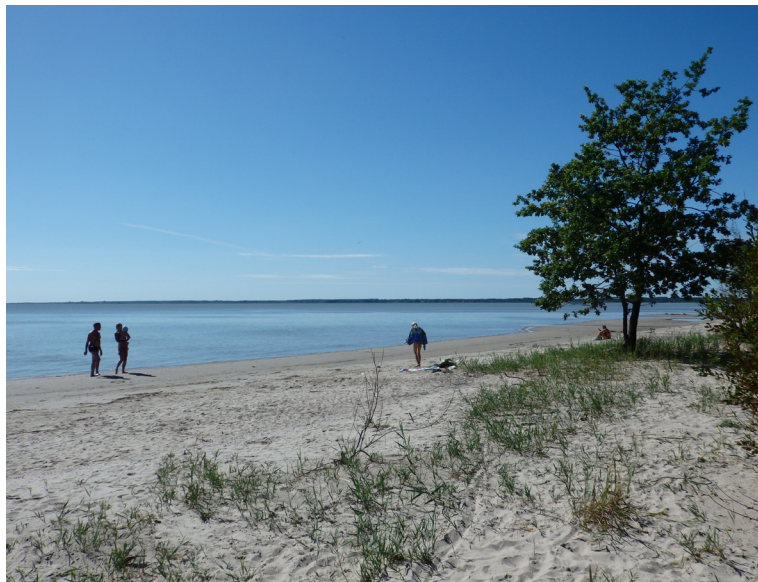
Valgerannas ciema smilšu pludmale, kas atrodas Pērnavas apriņķa Audru pagastā

Gleznainajā pludmalē iebaudījuši nelielu pikniku, sēdāmie atpakaļ automašīnā, lai dotos uz Virtsu ostu, kas atrodas ciematā ar tādu pašu nosaukumu. Bija paredzēts ar prāmi pārcelties uz Kuivastu; tas ir ciems Igaunijas Muhu salas austrumu piekrastē. Jāuzslavē Igaunijas ceļu stāvoklis: gan valsts kontinentālajā daļā, gan uz salām braucamā daļa ir labā līmenī! Prieks, ka gan turpceļā, gan arī atpakaļ nezaudējām ne minūti laika, gaidīdami prāmi. Kasē jāsamaksā 14 EUR par biļeti, lai ar automašīnu tiktu uz tā klāja. Bijām iepriecināti, ka, tikko uzbraukuši uz prāmja, jau sākām ceļu uz Muhu. Kad nokļuvām uz pasažieru klāja, spēcīgi bija jūtama kārdinoša sautētu kāpostu smarža. Kaut arī brauciens ilga vien 25 minūtes, tā laikā, ja mēs izsalkums, var ieturēt labas un ne pārāk dārgas pusdienas, kā arī iepirkties nelielā veikaliņā, kas pēc preču klāsta atgādina kiosku. Diemžēl Sāmsalas pastkaršu piedāvājumā nebija. Savādi, taču pie tām nebija iespējams tikt arī Kuresārē.