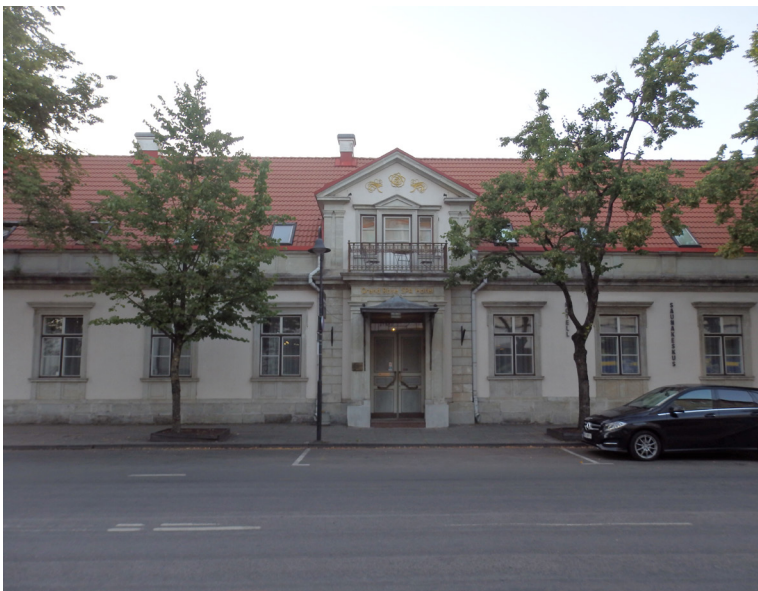
Viesnīca "Grand Rose SPA" Kuresāres galvenajā ielā