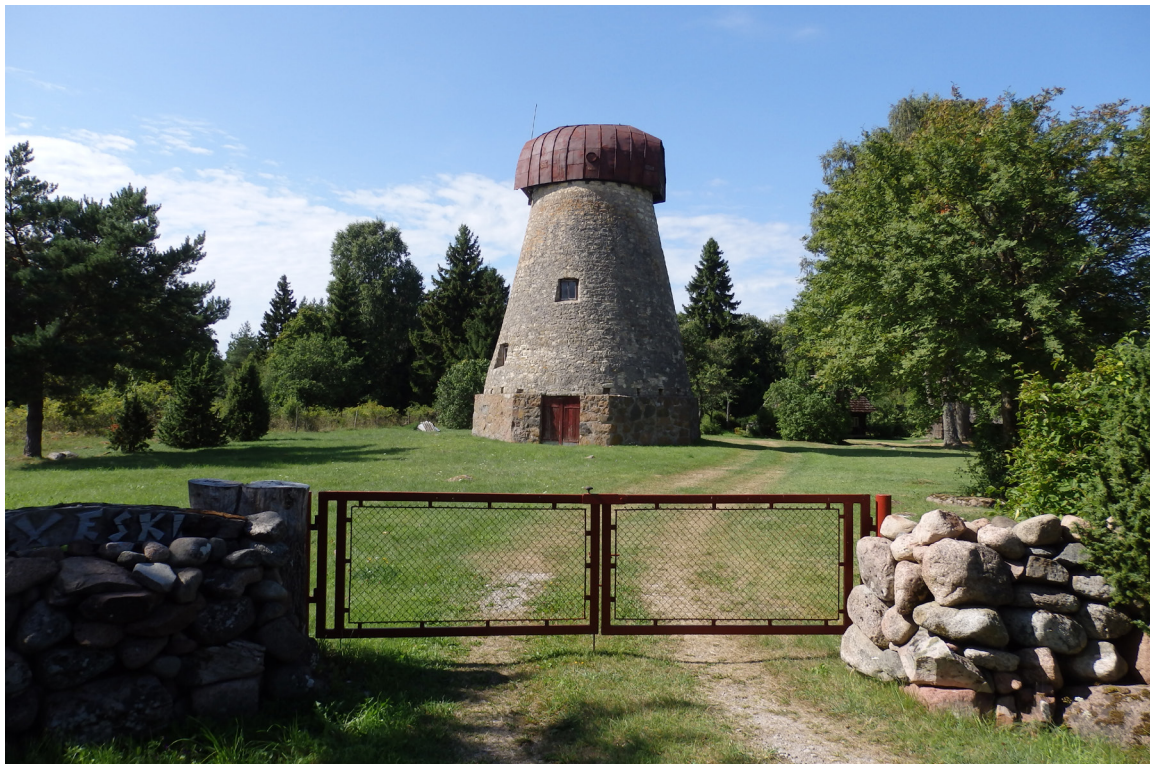
Senas dzirnavas pavisam netālu no Pangas.

Prāmju satiksme starp Virtsu un Kuivastu izveidota salīdzinoši nesen. Pirms tam Sāmsalā bija iespējams nokļūt, lidojot no Tallinas, kā arī braucot ar prāmi no Pērnavas ostas.