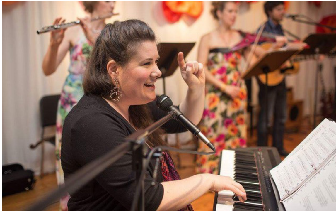
Krisite Skare Bostonas skolā vada mūzikas nodarbību

Katram korīstam ir jāizveido divi ieraksti – audio un video. Tas notiek tā – dziedātājs paņēmu savu telefonu, lieto balss ierakstīšanas programmu un iedzied savu daļu, klausoties manu ierakstu – pareizā tempā, ar pau-