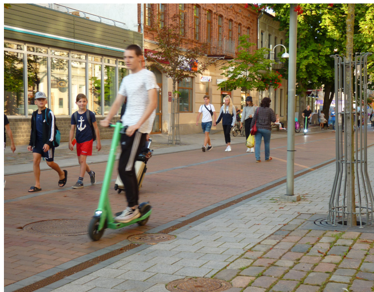
Rīgas iela Daugavpilī

trolei, metalla detektoru ieskaitot. Šo piecu gleznu kopējā izsoles vērtība visdrīzāk pārsniedz Daugavpils šī gada budžetu, kas ir 120 miljoni eiro. 2012. gadā Christie's izsolē Ņujorkā Rotko glezna “Oranžs, sarkans, dzeltens” tika pārdota par 87 miljoniem ASV dolaru. Tieši Rotko centrs šodien kļuvis par magnētu, kas piesaista tuvus un tālus viesus, rosina atklāt Daugavpili. Bet siltos vasaras vakaros es vienkārši ieteiktu pastaigāties pa Rīgas ielu, kas pilnībā atvēlēta gājējiem un velosipēdistiem. Apsēsties kafejnīcā un pavērot garāmgājējus. Daudzi ir saposušies, it īpaši sievietes – izejamās