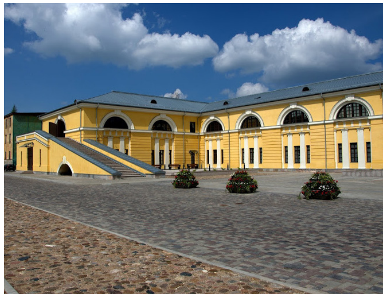
Marka Rotko mākslas centrs