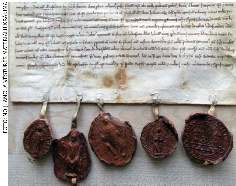
1225. gada decembra dokuments latīņu valodā, ar kuru Romas pāvesta sūtnis Modēnas Vilhelms nosaka Babītes svētās Marijas pils un Babītes ezera novada zemju nošķiršanu no Zemgales bīskapijas un turpmāko piederību pie Rīgas pilsētas lauku novada. Šajā dokumentā pirmo reizi rakstos minēts Babītes ( Babath ) vārds – Babītes ezers un teritorija, kas šobrīd atrodas Babītes novadā. Tas nosaka vietējo iedzīvotāju seno tiesību saglabāšanu, t.sk. tiesības zvejojot Babītes ezerā. Šeit noteiktais novada robežpunkts – Gāte (Babītes ezera ieteka Lielupē) joprojām iezīmē Babītes novada robežu pie Babītes ezera. Dokumenta oriģināls glabājas Latvijas Valsts vēstures arhīvā.

Jaunajā Babītes vidusskolas piebūvē sākotnēji bija plānota vieta skolas muzeja telpām. Tomēr, pieaicinot vēsturniekus un muzeja specifikas zinātnājus skolā glabāto vēstures materiālu izpētei, tika atzīts, ka skolas muzeju tā agrākajā formā atjaunot nav iespējams. Šāda veida vēstures krātuve un materiālu eksponēšanas veids neatbilst mūsdienu izglītības procesa un skolas muzeja akreditācijas prasībām, ir konstatēti arī trūkumi savāktā materiālu muzeoloģiskajā dokumentācijā. Vienlaikus teju pusgadsimta laikā savāktās un glabātās vēstures liecības ir izmantojamas cita veida eksponēšanai. Speciālisti piedāvāja vērtīgākos materiālus, sekojot mūsdienu prasībām un tendencēm, padarīt redzamus visiem, ne tikai „ierāmēt” tos četrās sienās. Viens no veidiem, kā to varētu izdarīt, bija piedāvājums skolā veidot pārvietojamas un interaktīvas ekspozīcijas, domājot par vēstures materiālu integrāciju mācību procesā. Tā kā skolā nav nedz piemērotu telpu, nedz speciālistu muzeja krājuma glabāšanai, materiālus no skolas muzeja ir paredzēts pārvie-