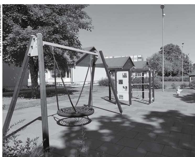
PII „Saimīte” vasarā labiekārtots rotaļlaukums pie grupas „Bitītes”.

Pēc grupu skolotāju izvēles sagādātas skolotāju grāmatas un darba burtnīcas bērniem audzināšanas un mācību programmas apguvei. Pēc skolotāju plānojuma sagādāts viss nepieciešamais grupas vides uzlabošanai un labiekārtošanai – plaukti ar plastmasas kastēm, grāmatu stendi, auto un dzelzceļa trases galdi, lie-