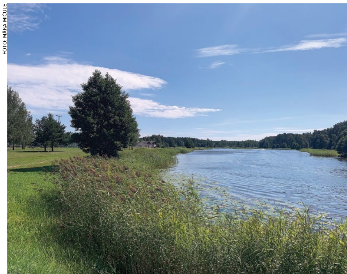
Piņķu ūdenskrātuve šā gada augusta sākumā.

2019. gada sākumā pašvaldība savā tīmekļvietnē izsludināja elektronisku aptauju, kurā vēlreiz lūdz iedzīvotājus paust viedokli par šāda gājēju un veloceliņa izbūves nepieciešamību. Aptaujas rezultāti – 87,3% „par” – nepārprotami lie-