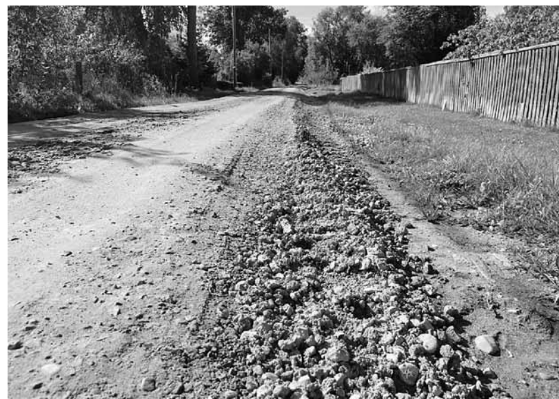
Sakņu ielā remonts vēl turpinās. Tā tiks paplašināta, profilēta un noblietēta.

Kāda lasītāja no Kuldīgas uztraukta, ka Putnūdārzā Sakņu iela pēc remonta atstāta sliktā stāvoklī. Segums mālains, gar malām akmeņi, turklāt grūtības sagādā šaurība, ja tur vienlaikus brauc automašīna un iet gājējs.