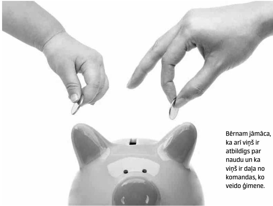
Bērnam jāzina, ka arī viņš ir atbildīgs par naudu un ka viņš ir daļa no komandas, ko veido ģimene.