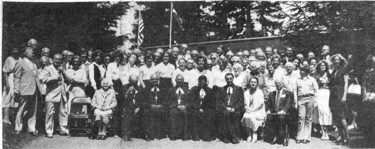
Draudžu dienu dalībnieku kopgrupa pie Portlandes latviešu sabiedriskā centra.

Cik nežēlīgi un plānveidīgi risinājās šī nāves plauja! Cik gan briesmīgi var būt viltības un slepenības režģi, arī taču cilvēku plānoti un izdomāti, ieraujot tajos nevainīgus cilvēkus, lai tos aizvestu, izmestu tundrās un pazudinātu. Bez vainas cietušie vēl šodien apsūdz slepkavīgo varu un, šķiet, mēs nekad nespēsīm īstenot piedošanu vārdos — milējiet savus ienaidniekus. Kā lai pārvēršam draugos tos, kas, būdami cilvēka izskatā, bez vainas iznīcinājuši tūkstošus un atkal tūkstošus mūsu tautas piederīgo, kā lai samierināties ar varu,