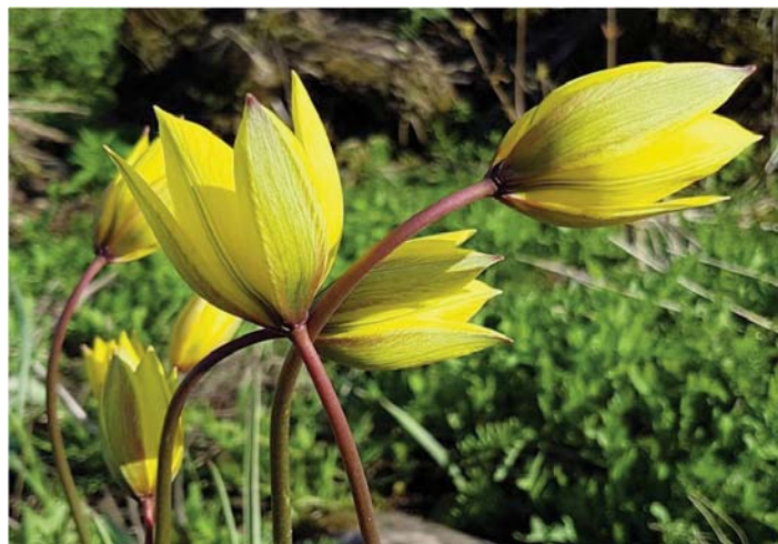
Zied meža jeb savvaļas tulpes

- Mili ar acīm (buklets) // https://www.daba.gov.lv/upload/File/Publikacija/BUK_Mili_ar_acim.pdf u.c.