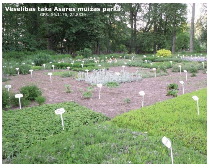
Veselības taka Asares muižas parkā