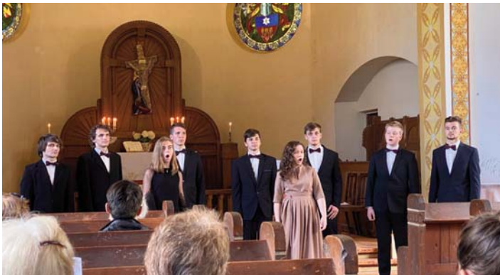
Gārsenes baznīcā dzied „Dižbrāļi” un „Dižmāsa”.