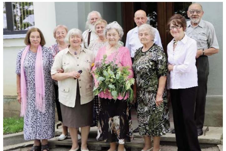
18. jūlijā, ievērojot valstī noteiktos piesardzības pasākumus, bet ar smaidu sejā, satikās Aknīstes vidusskolas