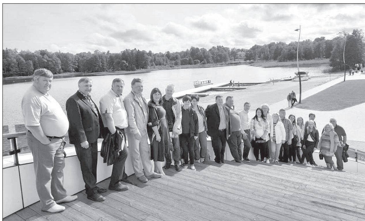
Во время поездки по обмену опытом.

Даугавпилсская краевая дума реализует поддерживаемый Рыбным фондом проект «Информирование различных групп общества о рыбных ресурсах Даугавпилсского края», в рамках которого в конце августа делегация самоуправления отправилась в поездку по обмену опытом в Алуксненский и Буртниецкий края, чтобы почерпнуть опыт в обслуживании озер.