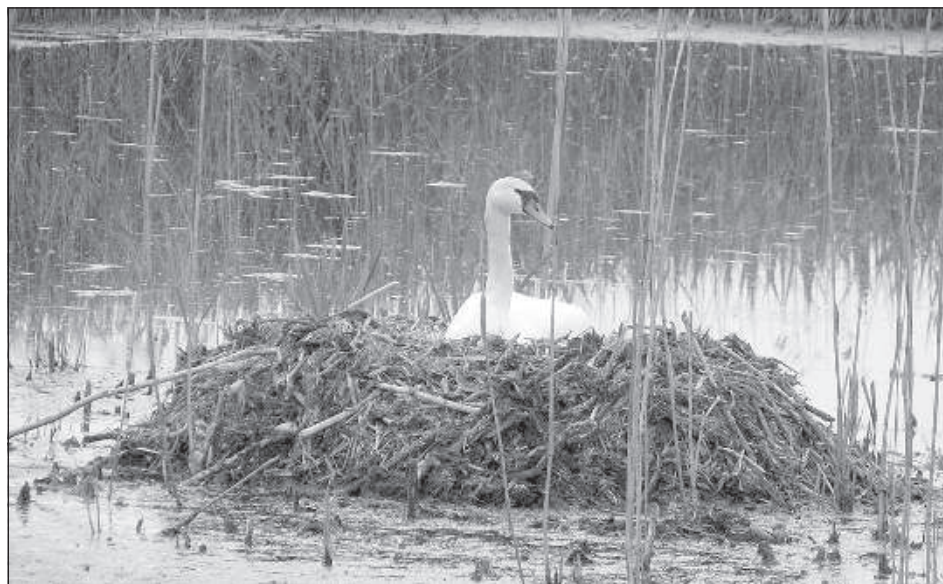
Жизнь лебединого озера и его грациозных обитателей.