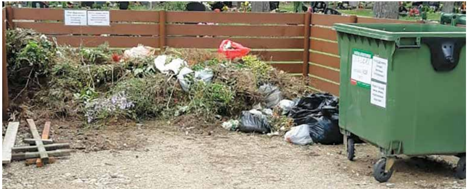
Arī kapos turpmāk būs jāšķiro atkritumi.

Piektkārt, pie nelegālajām atkritumu izgāztuvēm tiks uzstādītas reģistrētas novērošanas kameras. Ar to palīdzību tiks fiksēti likumpārkāpēji, kuri saņems sodu. Par šiem faktiem noteikti informēs