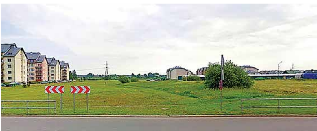
Šajā laukā nākotnē būs jaunais Nometņu ielas posms.

tiek segti no pašvaldības līdzekļiem. Jaunā iela ir tapusi laukā, kur līdz šim ceļa nebija vispār, un ļauj piekļūt lielam uzņēmumu pudurim, neizmantojot blīvi apdzīvoto