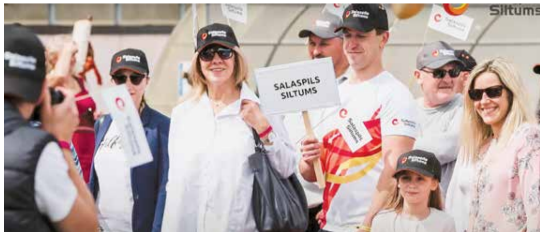
Domājot par vidi, pērn Novada svētkos “Salaspils Siltums” izmantoja papīra karodziņus.

Lielais pārmaiņu ceļš “Salaspils Siltumam” sākās ar šķeldas katlu mājas izbūvi 2012. gadā. Šķelda ir Latvijā iegūstams resurss, kas rodas, tīrot plašos mežus. Tiek savākti nolūzušie zari, koki un mizas, kas tiek sasmalcināti, lai pēc tam nonāktu pie siltuma ražotājiem. Tādejādi tiek pārstrādāti meža atkritumi, kas daudzu pilsētu iedzīvotājiem nodrošina silto ūdeni un apkuri.