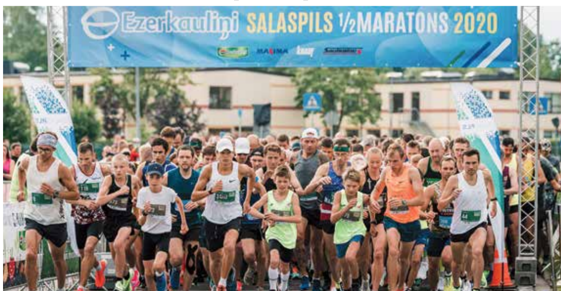
Teju 700 dalībnieki devās pilsētas trasē, lai veiktu izvēlēto distanci.