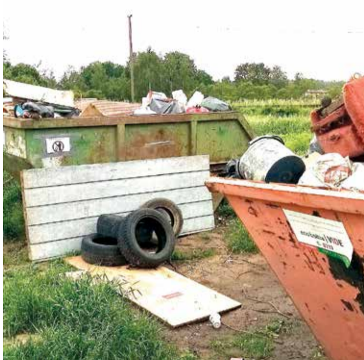
Redzam, ka mazdārziņu teritorijā tiek izmesti ar dārzkopību nesaistīti atkritumi.

Īpaši samilzusi atkritumu apsaimniekošanas problēma ir mazdārziņu teritorijās, kur līdz 1. jūlijam bija novietoti konteineri. Pie tiem regulāri tika izmesti ar dārzkopību nesaistīti atkritumi – autoriepas, vecas mēbeles, būvgruži, un par to nogādi poligonā atkal maksā visi