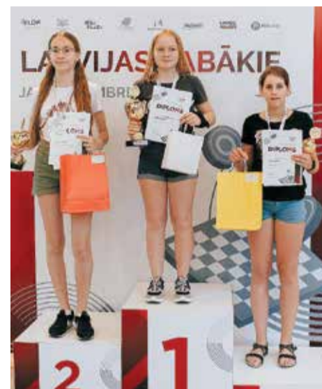
Arī šogad viss goda piedestāls piederēja salaspilietēm.

Meiteņu U-10 grupā jaunajām salaspilietēm liktenīga bija 5. vieta. Sākotnēji klasiskajā turnīrā