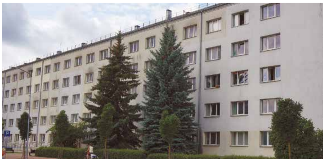
Ēkā Skolas ielā 7 taps telpas grupu dzīvoklim, atelpas brīžiem, sociālajai rehabilitācijai.

Darbu līgumsummas ir minētas bez pievienotās vērtības nodokļa.