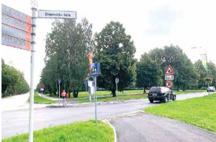
Miera un Dienvidu ielas krustojumā ir izveidota gājēju pāreja.