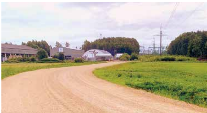
Zvanu iela ir tapusi laukā, kur līdz šim ceļa nebija vispār.

savienojumu ar Līvzemes ielu, un šī projekta realizācijas summa ir 178110,62 eiro. Gandrīz 25% no summas tiks saņemti kā aizdevums no Valsts kases, bet 75%