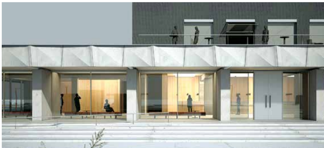
Nama priekšlaukums veidos jaunu satikšanās vietu iedzīvotājiem, bet, ieejot ēkā, apmeklētājus sagaidīs plašs vestibils ar garderobi.

Konkursā iesniegtajos projektos autori piedāvāja ne tikai pašas ēkas pārbūves risinājumus, bet arī ārtelpas labiekārtošanu, ietverot stāvvietas, apstādījumus. Kultūras nama jaunais veidols ļaus kultūrai iziet ārpus ierastajām ēkas sienām un aicinās cilvēkus ienākt. Nama priekšlaukums veidos jaunu satik-