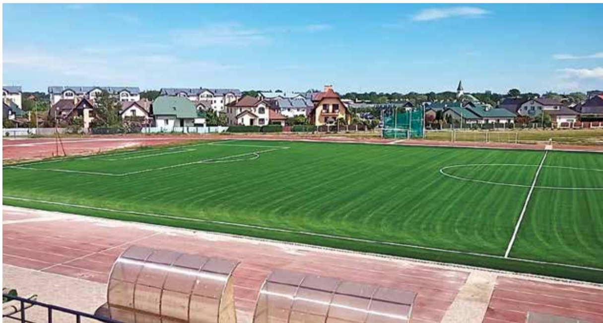
Par Futbola federācijas līdzekļiem šobrīd stadionā ir ieklāts jauns un moderns mākslīgais segums.

Katru gadu pašvaldība būtiskus finanšu līdzekļus paredz uzņēmējdarbības nodrošināšanas infrastruktūrai, veicot ceļu pārbūvi vai jaunu posmu izbūvi aktīvi darbojošos uzņēmumu teritorijās. 2020. gadā šie uzlabojumi tiek veikti, veidojot Zvanu ielas