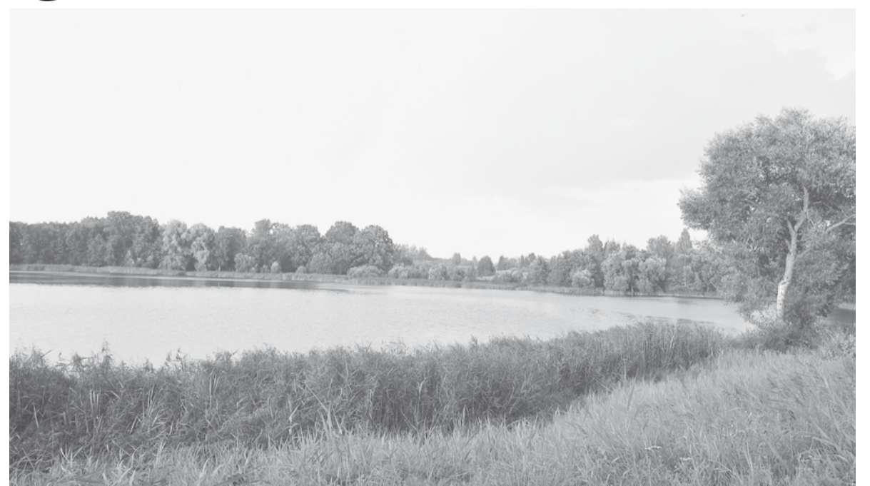
Medņu ezerā sveši makšķernieki parādās reti, vairāk – ziemā.