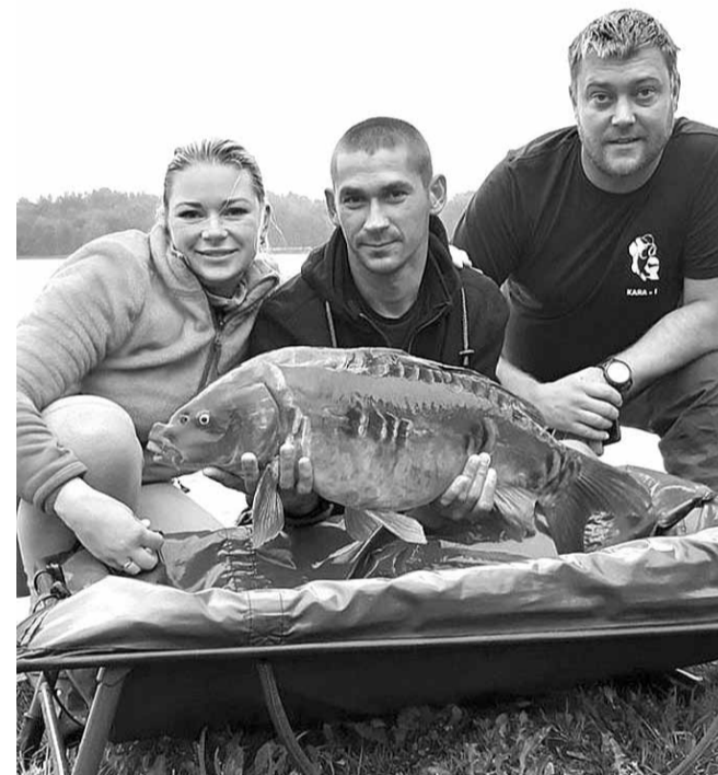
Sacensību lielāko zivi – 8,8 kg smagu spoguļkarpu – pievārēja komandas «Kara +1» dalībnieki.