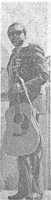
anīna Ankipāne, msona uzņēmums

piecos gados uz res meistara par dalībnieku, pie laikos vēl var ību, strādīgumu, bu un pazišanos.