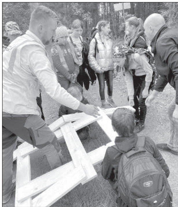
Мост строил весь класс.

матривать и примерять экипировку работников леса. «В школе мы не выполняем такие задания, поэтому было увлекательно. Я знала, как можно определить возраст дерева, но не делала этого. Нам показали, как можно измерить возраст ели по ответвлениям и то, как определить возраст срубленного дерева по кругам на срезе