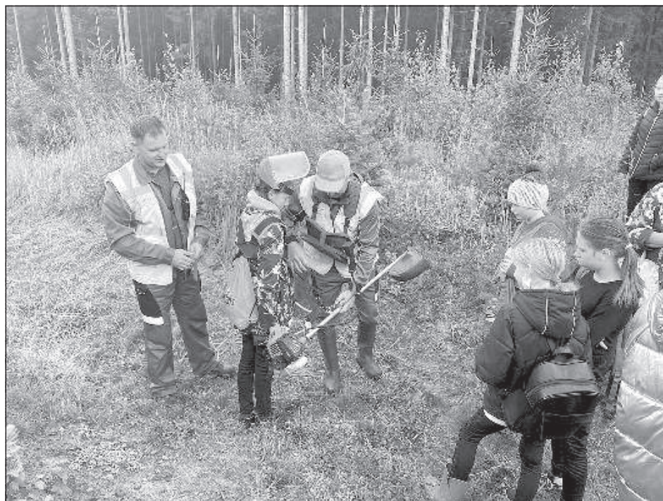
У учащихся была возможность попробовать, как «просто» работать в лесу.

На вопрос, что больше всего понравилось, ребята ответили по-разному. Мальчики были в восторге от строительства моста, девочкам понравилось ос-