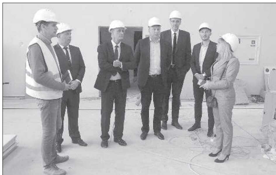
Руководство ЛБС знакомится с ремонтными работами в спорткомплексе ДК.