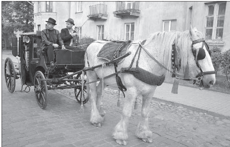
На празднике каждый мог найти интересное для себя.

В 20:00 начался праздник улицы Ригас, который в этом году был посвящен 160-летней годовщине железной дороги в Даугавпилсе. История строительства железной дороги в Латвии начинается 8 ноября 1860 года, когда в рамках строительства железнодорожной магистрали «Санкт-Петербург – Варшава» открылось сообщение на отрезке «Остров – Динабург (Даугавпилс)».