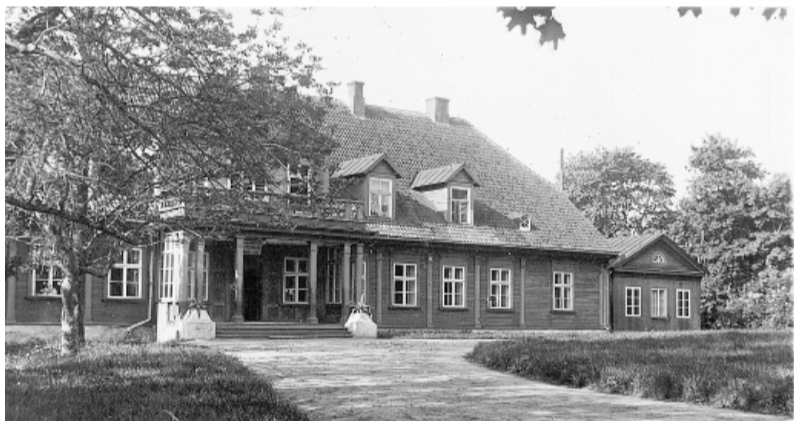
1922. gada 1. novembrī muižas ēkā Zemkopības ministrija atver Piensaimniecības un lopkopības skolu. Smiltenes tehnikuma sākums.