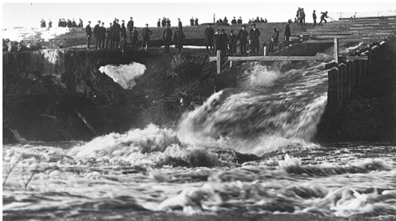
1922. gada aprīļa lielie plūdi.