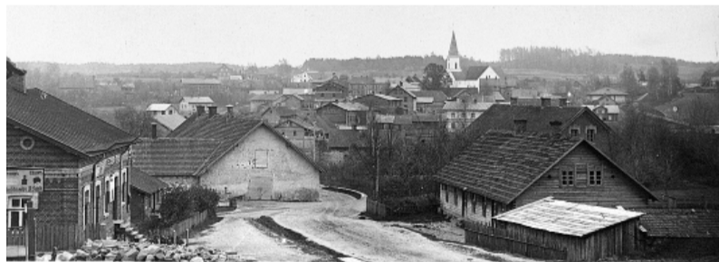
Zirgu pasta ēka Daugavas ielas vidū. Foto no J. Zušmaņa kolekcijas.

nonāk Smiltenes pilsētas valdes pārziņā 17 . 1931. gadā Smiltenes pilsētas bibliotēka atradās G. Ādolfā laukumā, bijušajā Naužēnu dzīvojamā mājā Nr. 6. Uz 1932. gadu bibliotēkas grāmatu fonds bija 3000 sējumi, bibliotēku lietoja 150 lasītāji 18 . G. Ādolfā laukumā 1 atradās otra bibliotēka – Smiltenes – Palsmanes – Aumeisteru – Gaujenes Lauksaimniecības Biedrības bibliotēka ar 2300 sējumu fondu 19 .