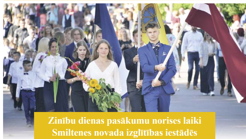
Zinību dienas pasākumu norises laiki Smiltene novada izglītības iestādēs

Novēl Smiltene novada domes Izglītības pārvaldes vadītāja Gunta Grigore