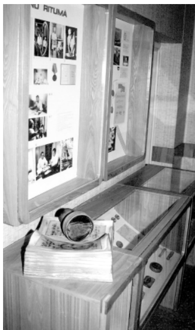
1987. gadā poliklīnikas telpās atklāj medicīnas muzeju.