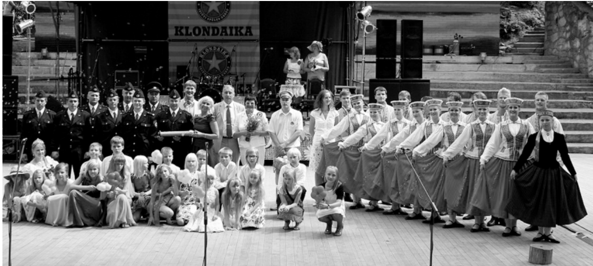
Jāņukalna 100. jubilejas svinības 2011. gada 16., 17. jūlijā.

ziedi Jāņukalnā” Jāņukalns svinēja 100. jubileju. 1910. gadā Smiltēnes muižas īpašnieks firsts Pauls Līvens Jāņukalnu nodeva Smiltēnes pilsētas brīvprātīgo ugunsdzēsēju biedrībai un sabiedrībai beztermiņa lietošanā. 35