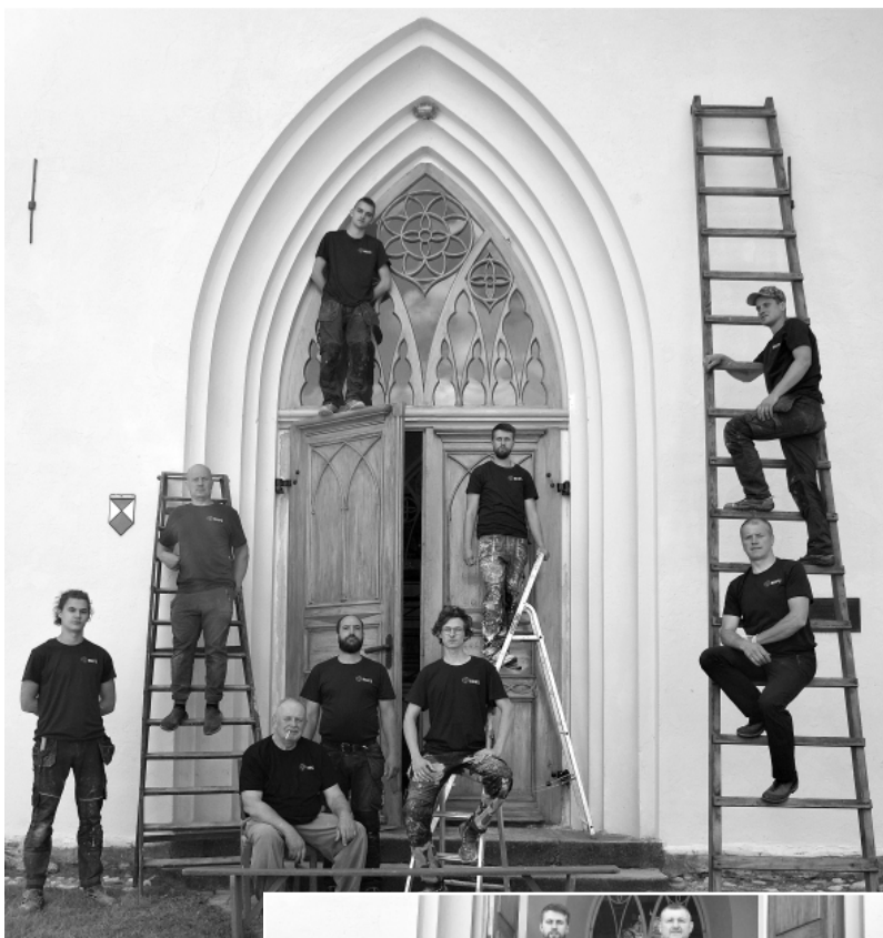
SIA „Rufs” būvnieki 2020. gada 17. jūlijā.