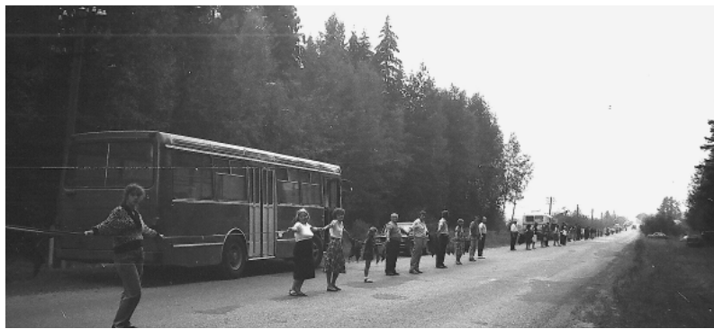
Smiltēnieši akcijā Baltijas ceļš 1989. gada 23. augustā.