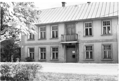
Kopš 1998. gada 1. septembra Smiltēnes Mākslas skola atrodas gleznotāja Jāņa Medņa brāļa Alberta Medņa mājā Vaļņu ielā 2.