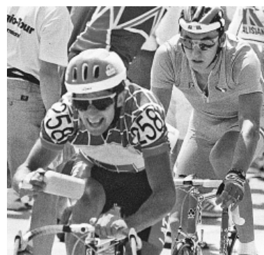
1992. gada vasarā XXV vasaras olimpiskajās spēlēs Barselonā latviešu šosejas riteņbraucējs, smiltēnietis Dainis Ozols, iegūst bronzas medaļu riteņbraukšanā, foto publicēts https://www.sporto.lv/sporta-veidi/individualie-sporta-veidi/kalna-kapejs-ozols/ .