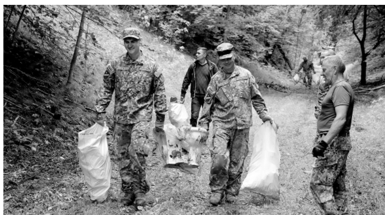
Talkas laikā teritorija lopumā 1 km garumā attīrīta no atkritumiem un izzāģēti krūmāji.

tējie iedzīvotāji. Ja Smiltenes pilsēta svin šogad savu simtgadi, tad arī mēs tai gribam dot kaut ko no sevis, vienlaikus šādas aktivitātes stiprina esošo zemessargu pārliecību un veicina sadarbību ar pašvaldību.”