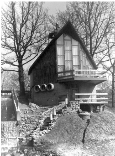
Pēc arhitekta Melngaiļa projekta 8. CBR 1973. gada augustā Tepera ezera krastā uzcēla somu pirti. 1994. gada 12. janvārī pirts nodega.

16. 1999. gada 9. februāris – nodeg vēsturiskā Jāņukalna ēka. Ēka būvēta 1914. gadā kā vasaras izrīkojumu zāle, to atklāja 1914. gada 26. maijā. 34 Gadu gaitā tā pieredzējusi daudz skaistu un nozīmīgu notikumu – izstādes, izlaidumus, teātra izrādes, sporta sacensības, plaši apmeklētās sanāksmes un balles. 2011. gada 16. un 17. jūlijā ar devīzi „Uz-