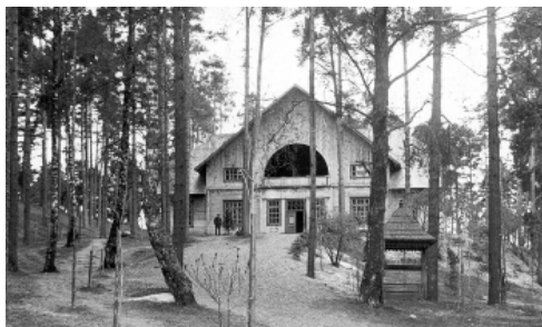
Vasaras izrīkojumu zāle Jāņukalnā.