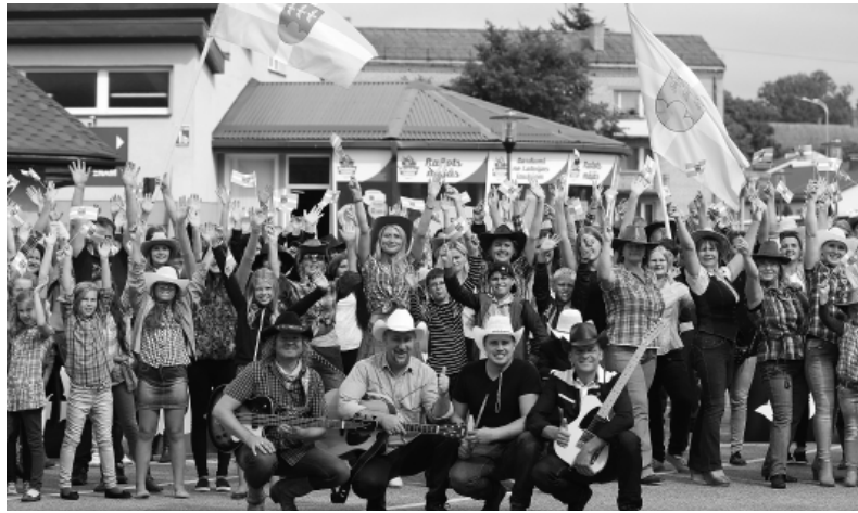
2016. gada 1. septembrī Smiltēnē notika vēl nebijusi zibakcija – „Arpvedceļš” jaunā videoklipa „Kantri radies Smiltēnē” filmēšana ar smiltēniešu piedalīšanos.