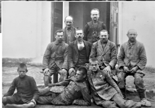
Smiltenes evaņģēliski luteriskās draudzes ārsienu krāsotāji – brāļi Pijoles 20.gs. 30. gadu sākumā.