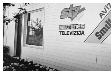
Smiltēnes televīzija.