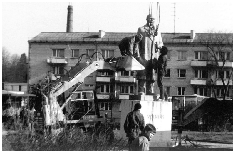
Tiek demontēts 1957. gadā atklātais Ļeņina piemineklis.