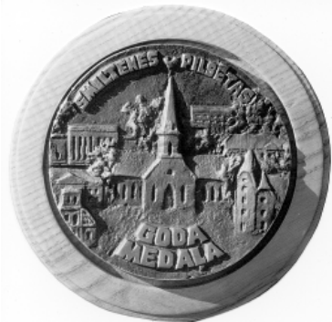
Smiltēnes pilsētas Goda medaļa ir augstākais pilsētas apbalvojums, kuru pasniedz katru gadu Latvijas Republikas proklamēšanas dienas – 18. novembra – svinību priekšvakarā. Medaļas autors – H. Balodis. (Zušmanis, J. „Smiltēne: laiki un likteņi”, 7. lpp.).