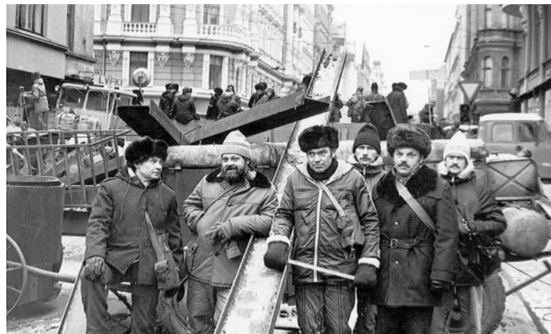
1991. gada 15. janvāris – smiltēnieši barikādēs sargā starptautisko telefonu centrāli. (Zušmanis J. “Smiltene: laiki un likteņi” , 156. lpp.).

ta stends pie pieminekļa Brīvības kara varoņiem. Uz granīta stenda iegravēti 34 LKO kavalieru vārdi, kas dzimuši un dzīvojuši tagadējā