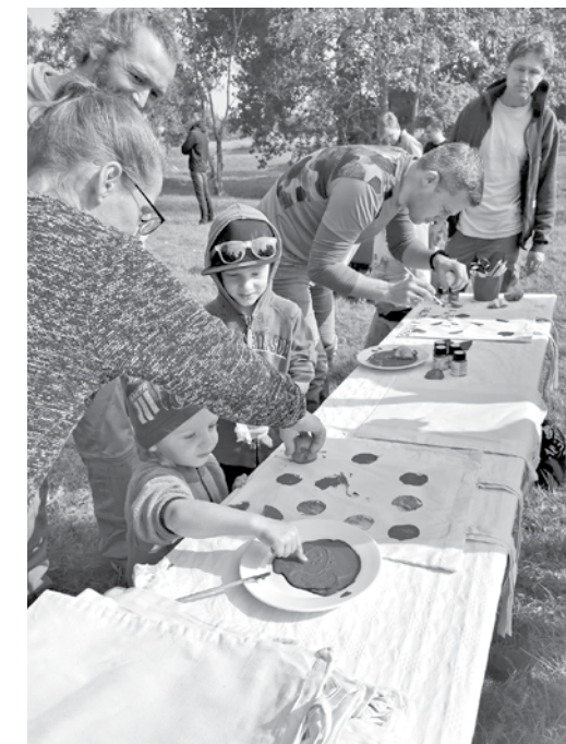
Daudz prieka sagādāja auduma maisiņu izgreznošana ar krāsā mērcētu kartupeļu spiedogiem.