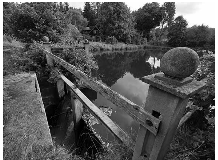
Vormsātes dzirnavu dīķa dambis uz Šķerveļa ierīkots vēl muižas laikos. Tas te atrodas vēsturiski, nelikumīga būvniecība nav notikusi.