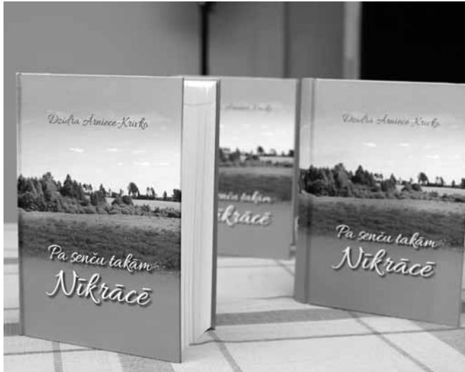
Grāmatā aprakstītas vairāk nekā 300 gan esošās, gan nu jau zudušās mājvietas Nīkrāces pagastā.

Rakstniece atzīst, ka vairākas reizes ir grībējis atmetēt ar roku, jo ir bijis grūti būt iekšā visos stāstos. Cēlusies trijos naktī, lai klusumā rakstītu atmiņu stāstus, kurus pa dienu uzklājusī. Viņa piekrīt, ka grāmata ir ar dvēseli, jo