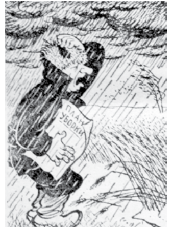
Tikmēr gulēja un snauda, Kamēr vārpās nav ne grauda.

Padomju Dzimtene, 1959. g. 5. septembris