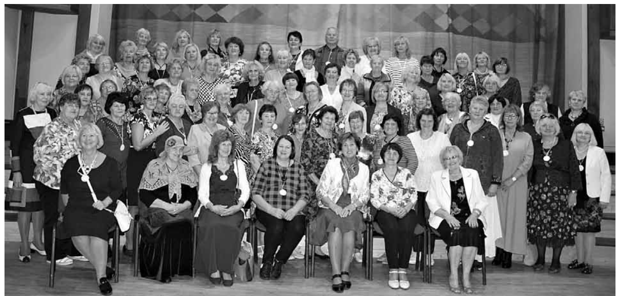
12. septembrī Kandavā vienkopus satikušās 78 Dzintras un arī viens Dzintars. Salidojums notiek ceturto gadu, bet pirmo reizi ieradies tik kupls skaits.

Vārdamāsa atbraukušas no tuvākiem un tālākiem novadiem: Talsiem, Saldus, Pastendes, Dobeles, Jūrmalas, Rīgas, Olaines, Liepājas, Auces, Triekātas, Rucavas, Jēkabpils, Engures, Ādaži, Ķekavas, Aizputes, Cēsīm, Valmieras un, protams, 12 vārdamāsas no Kuldīgas, Laidiem un Rudbārziem.