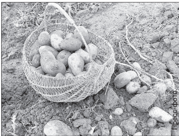
Картофель сорта «Лаура».