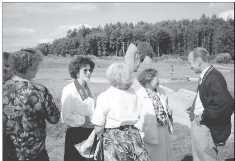
На всемирном слете жителей Эглайне в 1994 году.

Не смотря на то, что у Латвии, в отличие от больших стран, не было имперских амбиций, надеюсь, и она сможет существовать. Надеюсь на молодое поколение, не то, что теперь у власти, которое, как личности, формировалось в 90-х годах, потому что это не самое лучшее поколение, а на последующие, потому что среди них есть немало разумных людей. ■