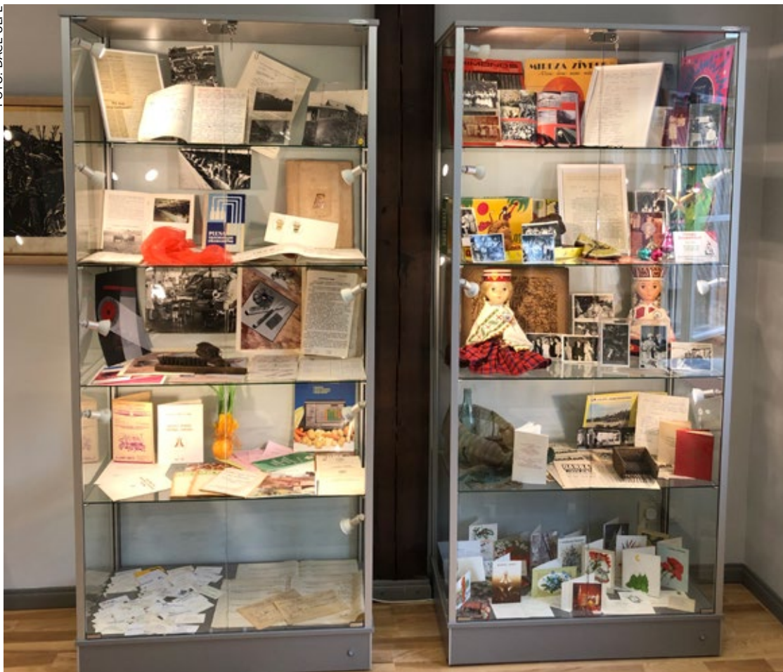
Izstādē „Padomju Latvijas” gadi” ir iespēja apskatīt kolhoza laika dzīves „lietiskos pierādījumus” – gan saimnieciskās darbības dokumentus, gan bērnu rotaļlietas, gan kādreiz tik pazīstamās „Padomju Latvijas” metāla birstes.