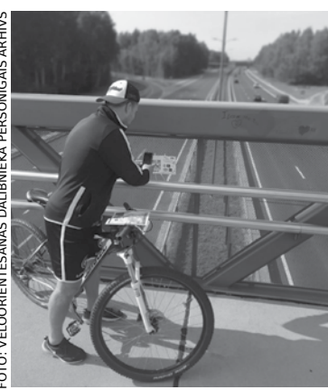
Meklējot veloorientēšanās kontrolpunktus Babītes novadā.

Ar balvu ieguvējiem sazināsimies personīgi, lai vienotos par dāvanas saņemšanu.