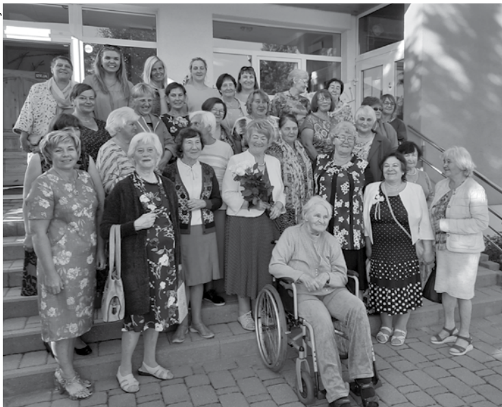
Iestādes 50 gadu jubilejā satiekas bērnodārza bijušie un pašreizējie darbinieki.

Laicāne, kura 40 gadus vadīja Babītes pirmsskolas izglītības iestādi, turpina aktīvi interesēties par iestādes ikdienā. Tikšanās bija satraukuma pilna, jo sākumā viesi bija kūtri, nedroši, bet vēlāk raisījās jautras, atmiņām bagātas sarunas un izrādījās, ka visiem ir liela interese par iestādes moduļu ēku. Pēc nelielas ekskursijas pa iestādes teritoriju un iekštelpām tika gūta atziņa, ka