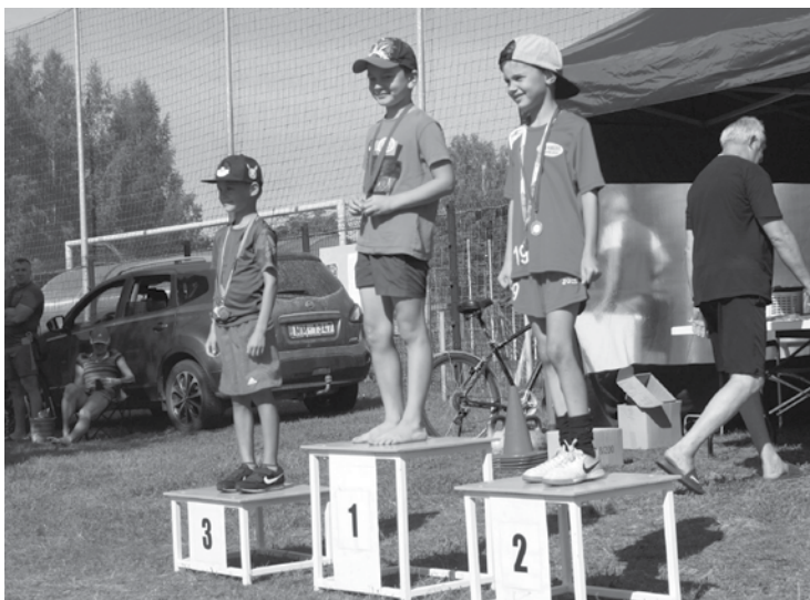
Sporta spēļu godalgoto vietu ieguvēju sveikšana.

Babītes novada sporta spēles tiek organizētas kopš 1994. gada. Sporta spēļu mērķis ir popularizēt veselīgu un aktīvu dzīvesveidu, kā arī