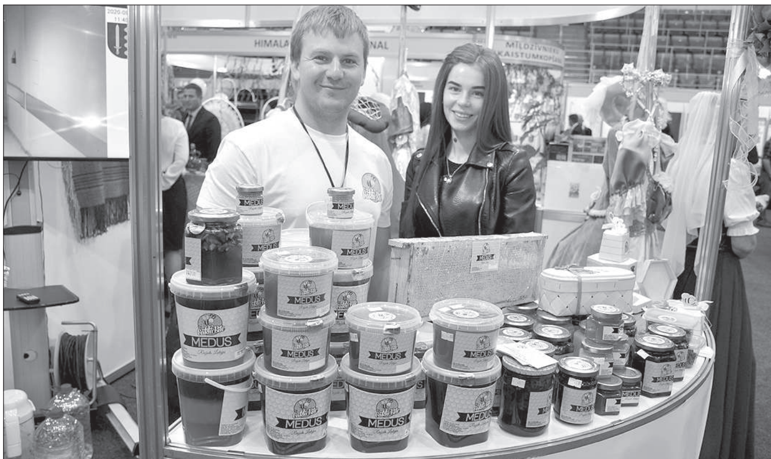
Фирма «AN Holding».