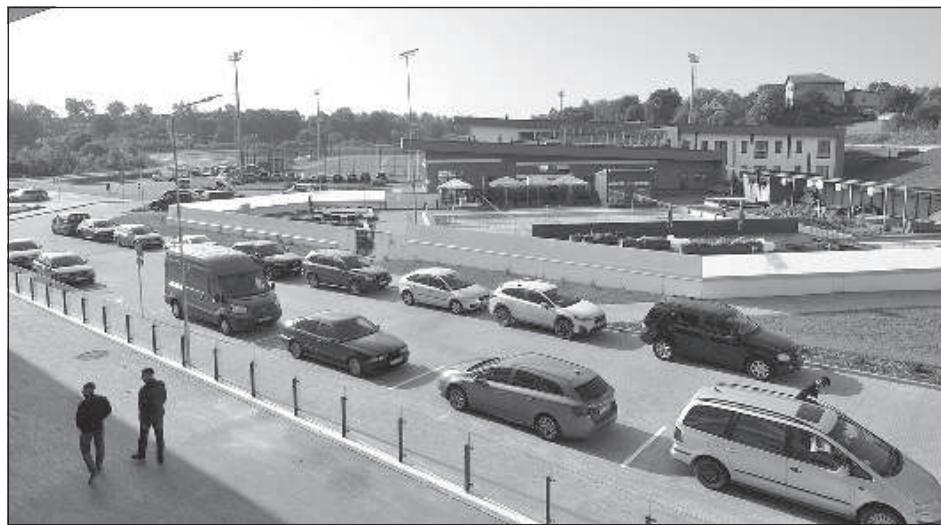
Вид на открытый бассейн.