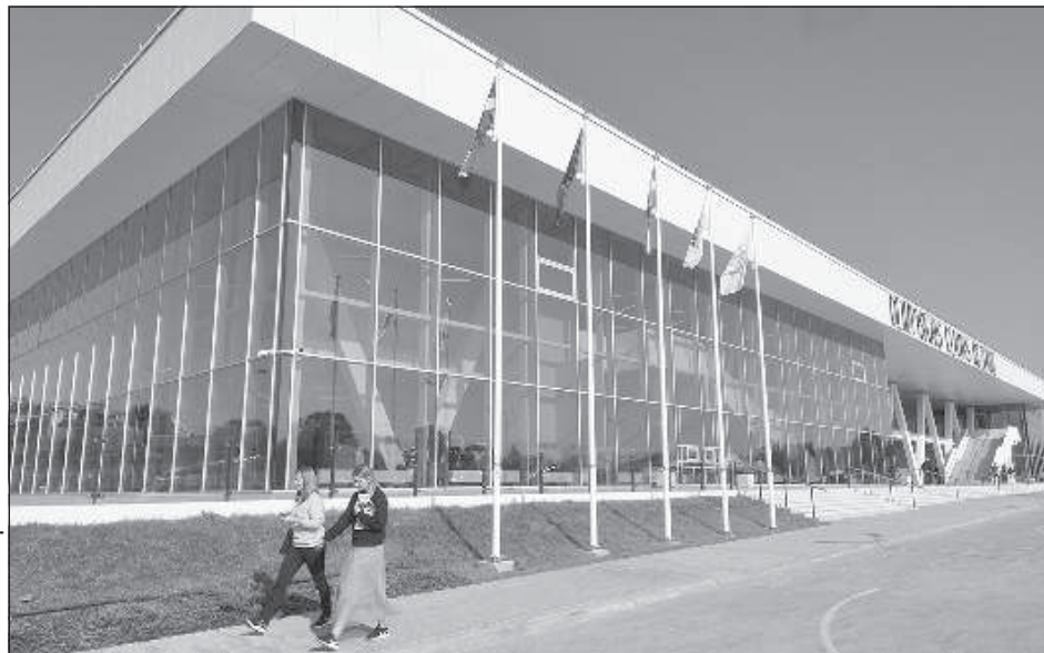
Олимпийский центр Резекне.

Строительство Олимпийского центра Резекне началось 3 года назад, работы проводила фирма «Arčers», технический проект разработало архитектурное бюро «Rem Pro». ■