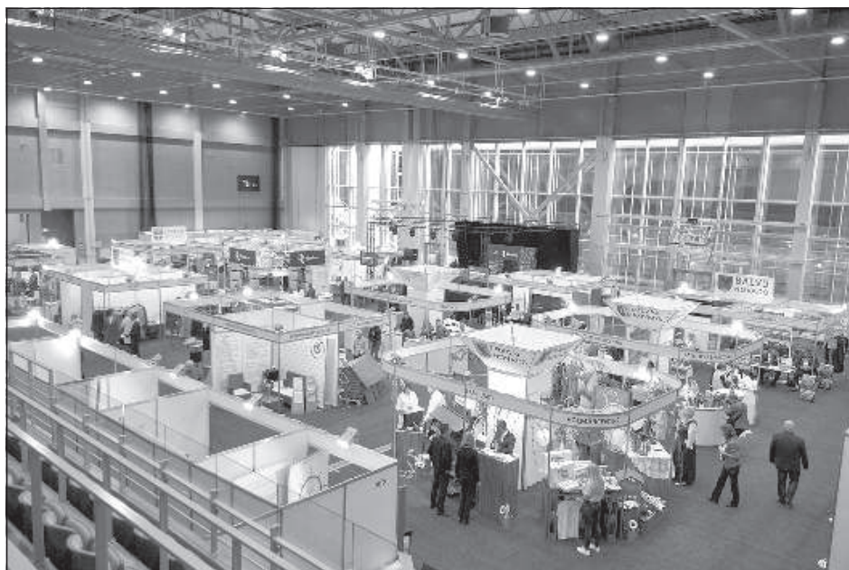
Фестиваль возможностей «Дни предпринимателей в Латвии 2020» прошел в новом многофункциональном зале.

стран в рамках Дней Северных стран, президент и руководители латгальских самоуправлений. Такое совпадение не случайно, потому что самоуправление годами целенаправленно стремилось к такому результату, чтобы Резекне стал не теоретическим, а фактическим центром развития – местом, где могут про-