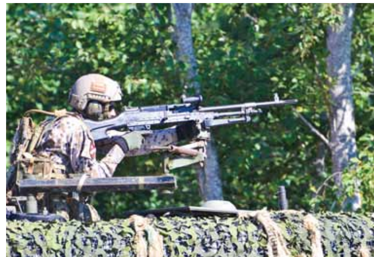
Šībrīža materiāli tehniskais nodrošinājums un bruņojums nav salīdzināms ar to, kāds Latvijai Zemessardzei bija pirms krīzes Ukrainā.

„Tie ir mani novērojumi 20 gados, kopš esmu zemessargs. Esmu bijis komandieris ne reizi vien. Skaidrs, ka Nacionālie bruņotie spēki iepirkumus izplānojuši jau gadiem uz priekšu un man ieteikumi diez vai tiks uzklausti, bet tā es redzu Zemessardzes attīstību. Jāsaprot mūsu ģeopolitiskā vieta: augšā Igaunija, apakšā Lietuva, malā agresors. Mēs nebūsim uzbrucēji, bet mums jābūt 100% gataviem aizstāvēties, jo pat atkāpties nav, kur, aiz muguras ir jūra. Jādoma par aizsardzības dziļumu un kvalitāti, un te ļoti liela nozīme ir gan infrastruktūrai, gan katra zemessarga apgādei, gan komandējošā sastāva spējai savus padotos pasargāt. Es vēlos sevi, savu ģimēni, savu valsti un valodu aizstāvēt, un mēs, zemessargi, to darīsim, neskatoties ne uz ko.”