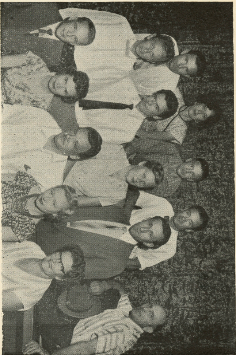
Brisbanes latviešu teātra izrādes dalībnieki