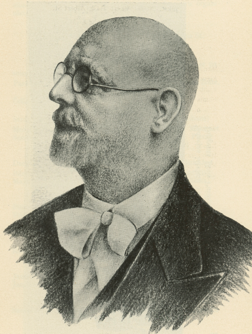
Profesors Jāzeps Vītols.