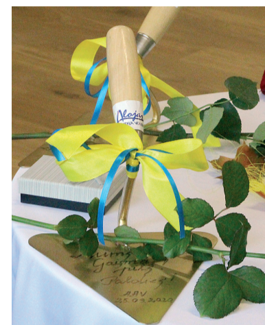
Alojas Ausekļa vidusskolas sagatavotā pateicības dāvana – ziedi un celtniecības ķelle ar uzrakstu: „Mums ir Gaismas pils! Paldies!”

nodrošinātu vides pieejamību, izbūvēts arī lifts. Izglītības iestādes telpās mācības atsākuši skolēni, savukārt bērnu vecāki un skolotāji