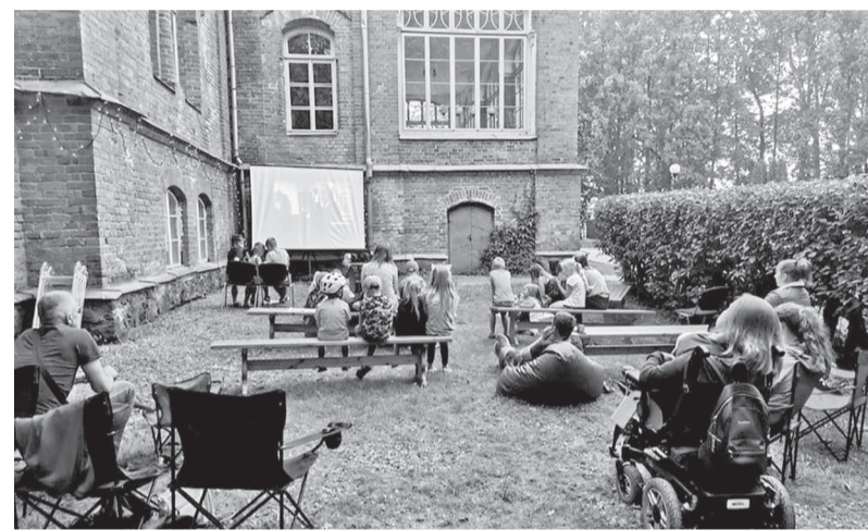
Viens no projekta „Laižam dabā kopā ar kino” seansiem, kas norisinājās Puikulē.