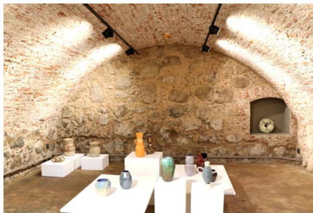
Izveidotā Velvju zāle - piemērota telpa izstādēm un dažnedažādiem kultūras pasākumiem

Jaunizveidotās Velvju zāles pamatfunkcija – profesionālās un amatiermākslas nozīmīga kultūras pasākumu un izstāžu vieta, tradicionālās kultūras meistardarbnīcu piedāvājums tūristiem, nodrošinot mūsdienu kultūrtelpai atbilstošu infrastruktūru un attīstību.