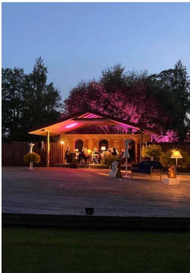
Opermūzikas nakts koncerts "Seviļas kaislības" Sēļu muižas estrādē

Augusta otrajā sestdienā jau tradicionāli norisinājās Mazie Opermūzikas un mākslas svētki Sēļu muižā. Siltajā vasaras vakarā ikviens varēja aplūkot izstādes muižā, klēti un stalli un, pateicoties Latvijas valsts mežu un Valsts kultūrkapitāla fonda Vidzemes kultūras programmai, arī ieklausīties opermūzikas nakts koncertā "Seviļas kaislības". Svētku burvību papildināja izgaismotā Sēļu muižas apkārtnē.