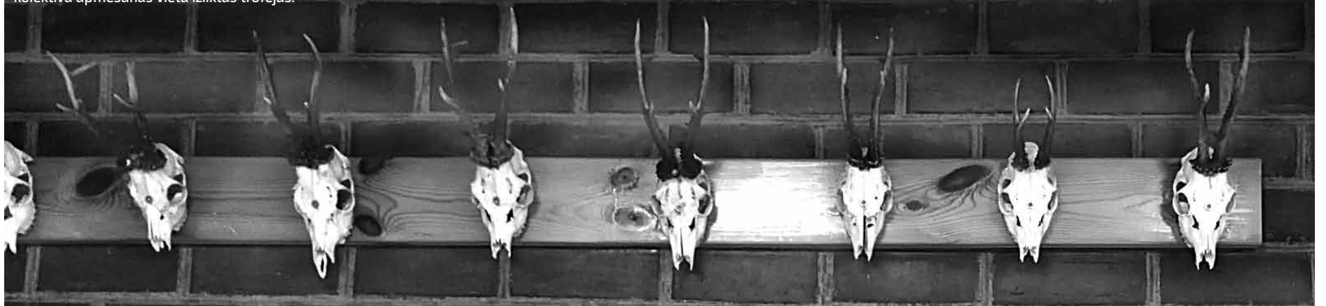
Kolektīva apmešanās vietā izliktas trofejas.