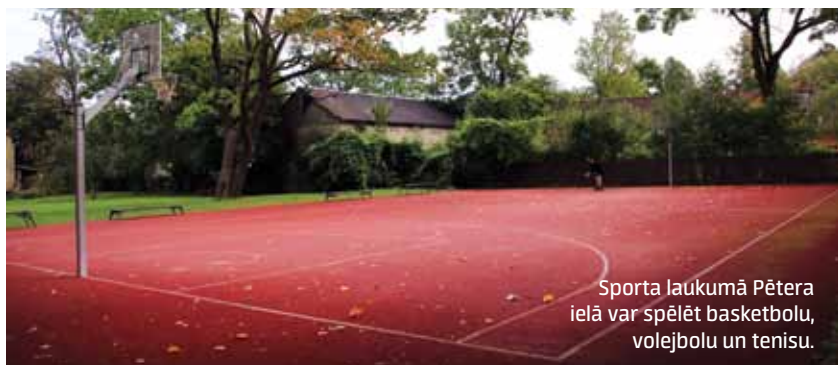
Sporta laukumā Pēteris ielā var spēlēt basketbolu, volejbolu un tenisu.