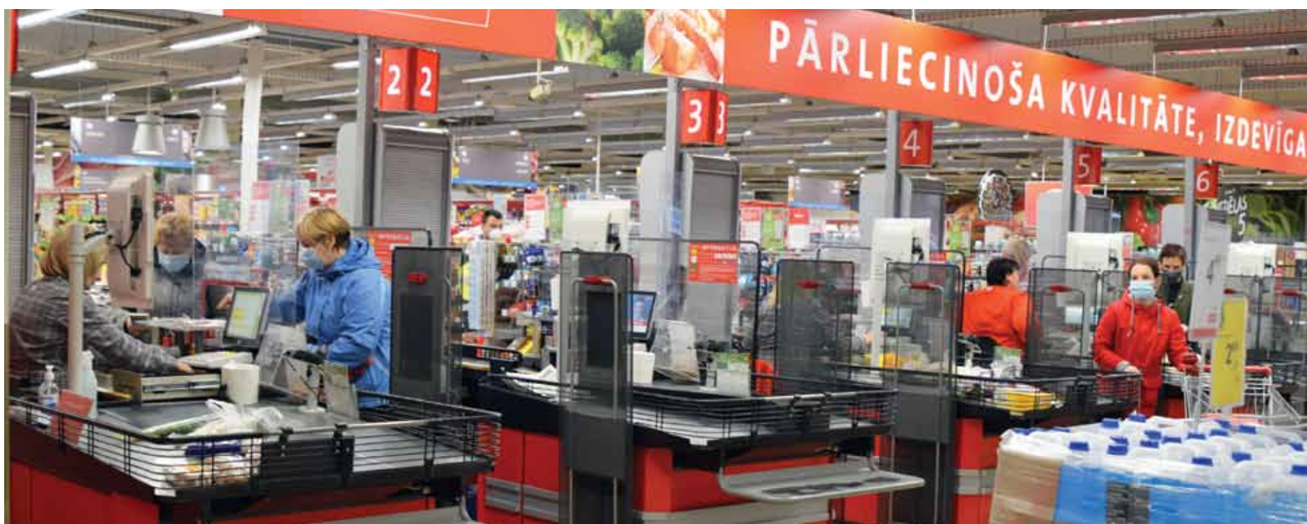
Kopš 14. oktobra spēkā ir noteikumi, ka veikalos drīkst apmeklēt tikai ar sejas aizsargmasku. Ceturtdien Kurzemnieks novēroja, ka Rimi daudziem tās ir, taču visi cilvēki veikalos to tomēr neievēro.

Aptaujājām skolas, sociālo dienestu un uzņēmumu Kuldīgas tekstils , kurā slimības uzliesmojums sākās.