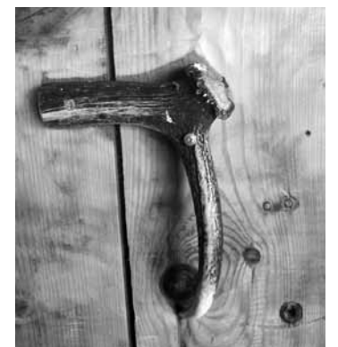
Durvju rokturis atbilst kluba darbībai – darināts no brieža raga.