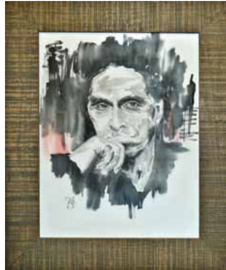
„Man ļoti patik izzīmēt acis. Mājās pie sienas bija kāds portrets, ko mazmeita lūdza noņemt, jo uzgleznotā cilvēka acis visu laiku sekojot,” stāsta autore.