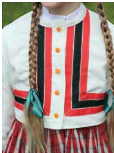
Kuldīgas Mākslas un humanitāro zinību vidusskolas dejotāji tikuši pie krāšņiem Planīcas pagasta tautastērpiem.

Tautisko deju kolektīvu darbība bijusi aktuāla kopš Kuldīgas Mākslas un humanitāro zinību vidusskolas dibināšanas. Viens projekts, ko īstenojusi biedrība MESS, ir Etnogrāfisku Planīcas tautastērpu darināšana deju kolektīviem „Austra” un „Austriņa”, kurā tapuši 48 meiteņu un 48 puīšu tautastērpi visām vecuma grupām.