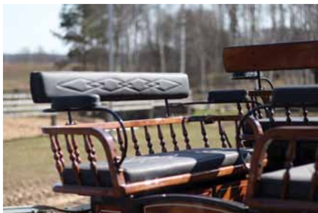
Projektā Zirga pajūgu pakalpojumu nodrošināšana vietējās rīcības grupas teritorijā iegādāti rati un širu aizjūgs.