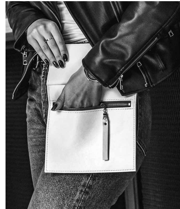
Zīmola Shonne Lux ražojums – pie jostas pieliekama ādas kabata.

Pieteicos pirmsinkubatorā. Iesaistījos arī Rīgas jauno uzņēmēju apmācībā, kur beigās prezentācija notika angļu valodā, jo bija atbraukuši profesori no Kembridžas universitātes. Biju viena no tiem, kuri saņēma apmaksātu vietu Kembridžā projektā Riga - Cambridge Venture Camp , lai