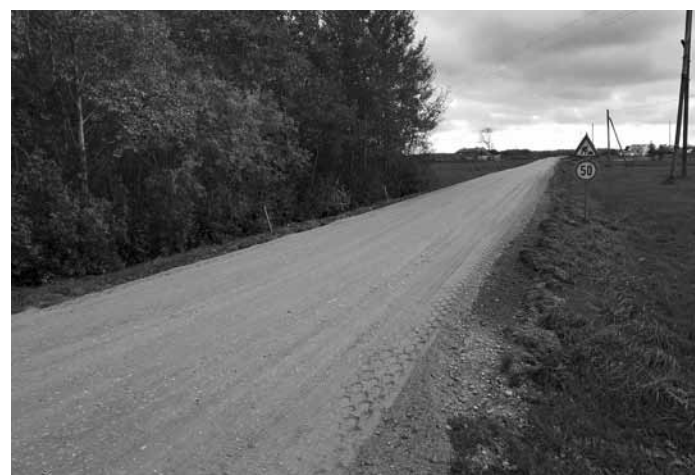
Grūti izbraucamais ceļš Jaunpēdznieki-Dzeguzes nu ieguvīs jaunu virsmu.

Kabilē tiek atjaunots ceļš Jaunpēdznieki-Dzeguzes, kas bijis sliktā stāvoklī. To pārsvarā izmanto lauksaimnieki, braucot ar smago tehniku. Daudzas vietas bijušas gandrīz neizbraucamas.