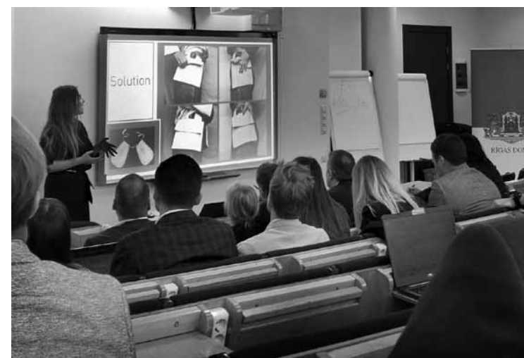
Nika savu biznesa ideju prezentē projektā Riga - Cambridge Venture Camp .