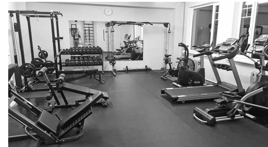
Alsungā darbu sākusī trenāžieru zāle.

Kopš oktobra Alsungā, Skolas ielā 11, darbojas SIA Fitsport Harmonija trenāžieru zāle.