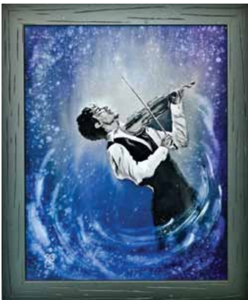
2009. gada Eirovīzijas uzvarētāja Aleksandra Ribaka portrets.