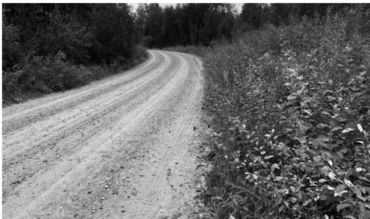
Vecā suitu jeb Kuldīgas–Upīšu–Alsungas ceļa malas vēl ir aizaugušas, bet šomēnes tiksot nopļautas.