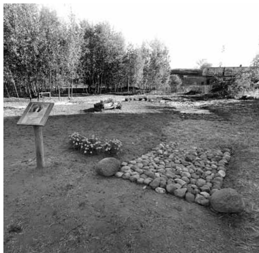
Parkā izveidota baskāju taka, un to izmēģināt aicināts ikviens.