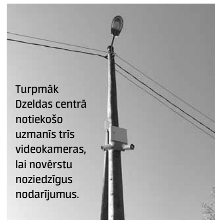
Turpmāk Dzeldas centrā notiekošo uzmanīs trīs videokameras, lai novērstu noziedzīgus nodarījumus.

Kameras uzliktas tāpēc, lai novērstu noziedzīgus nodarījumus un administratīvos pārkāpumus. Iniciatīva nākusi no pašvaldības policijas, un pagasta vadība tai piekritusi. Par iegādi un ierīkošanu 2699 eiro samaksājusi Skrundas novada dome. Kameras jau ir pieslēgtas pašvaldības policijas ekrāniem, un nu arī Dzeldā novērotā ieraksti noteiktu laiku glabāsies serverī. Kamerās redz garāžas, laukumu, autobusa pieturu un pagastmāju. Kopīgajam tīklam tās pieslēgtas 12. oktobrī.