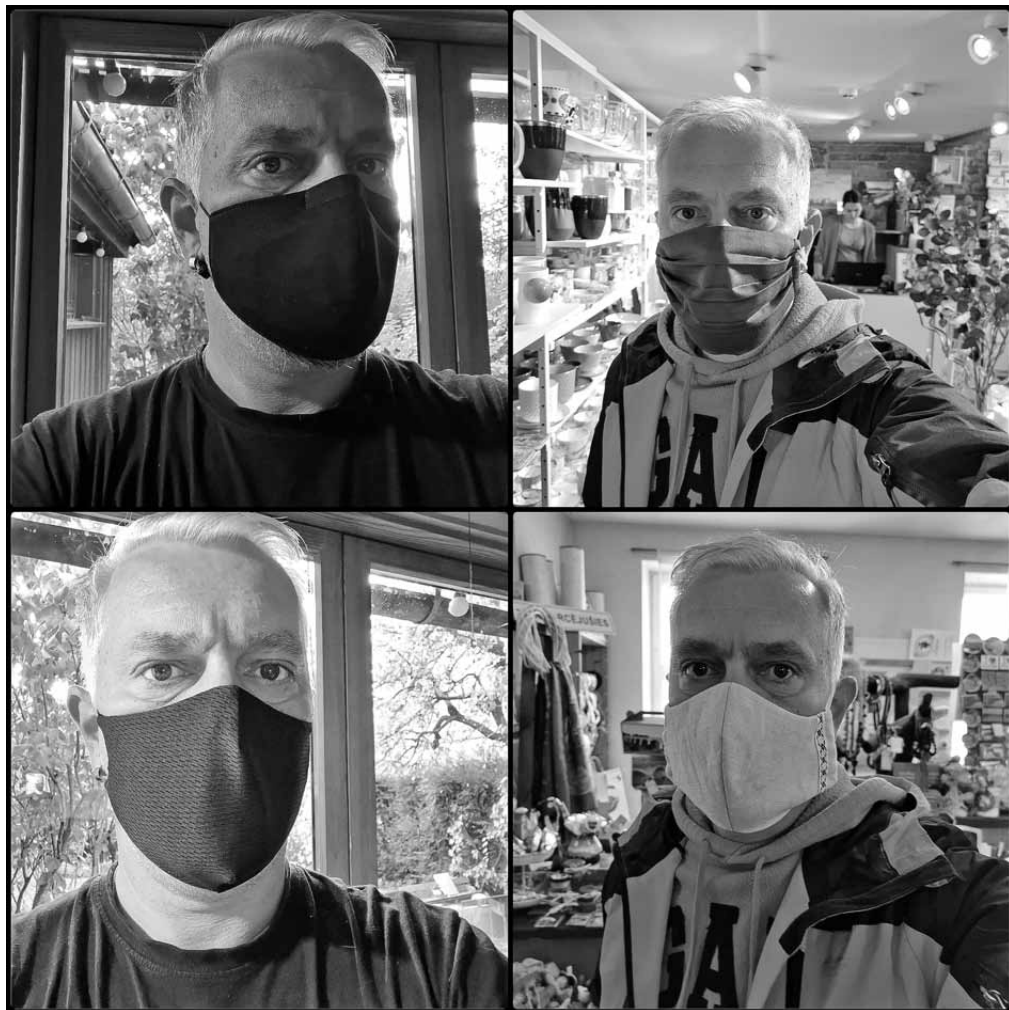
No četrām Kuldīgas veikalos apskatītajām maskām tikai divas pēc izmēra bija tādas, kas kārtīgi nosedz bārdaina vīrieša seju.

Kopš 14. oktobra ikvienam, kurš apmeklē virkni sabiedrisko vietu, jābūt sejas aizsargmaskai, lai mazinātu risku inficēties ar Covid-19. Tā nav jālieto tikai bērniem, kuri jaunāki par 13 gadiem. Tāpat kā pandēmijas sākumā pavasarī, arī šobrīd tirgū ir trīs veidu sejas maskas: higiēniskās, medicīniskās un respiratori. Jau pavasarī ar divu pēdējo iegādi bija problēmas, tāpēc nu valdība noteikusi: lai prasības izpildītu, iedzīvotāji var iztikt ar higiēnisko masku.