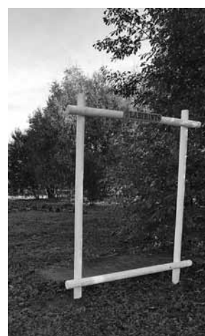
Par atmiņu ikkatrs var līdzī aizvest fotogrāfiju, ko uzņemt koka fotorāmī.

Ideja Nīkrāces pakalpojumu pārvaldē radusies pavasarī, un iniciatīvas grupa sagatavojusi projektu pašvaldības konkursam Mēs Skrundas novadam . Iegūstot 500 eiro, sāka parka izveidi. Aizaugušās vietas iekopšana sākusies jūlijā, tad iestājies pauze līdz septembrim, kad pārvaldes vadītāja Ilona Rītiņa palīgos saai-