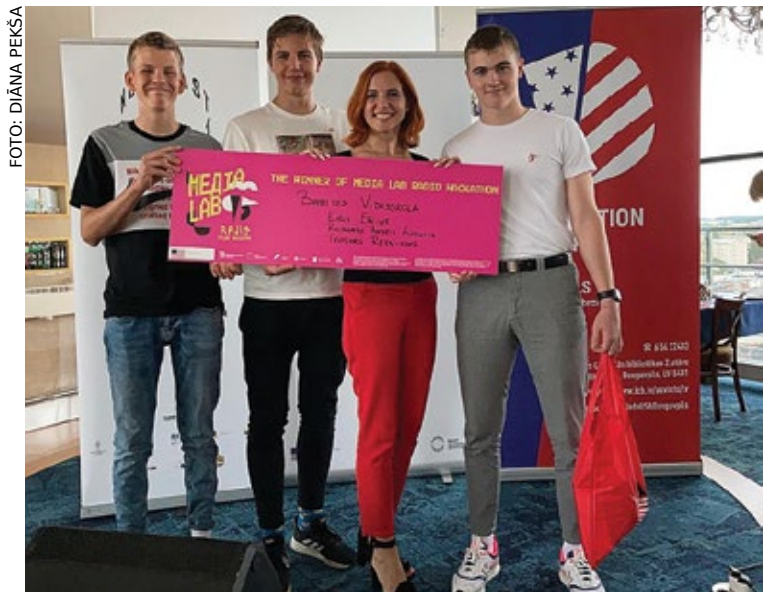
Jaunieši no Babītes vidusskolas gūst uzvaru Daugavpilī.

Viena no prioritātēm 2020./2021. mācību gadā Babītes vidusskolā ir medijpratība. Ir svarīgi, lai izglītojamie apgūst zināšanas un prasmes, kas nepieciešamas darbam ar informācijas avotiem. Tās ietver ne tikai informācijas atrašanu, bet arī šīs informācijas kritisku izvērtēšanu, dažādu avotu salīdzināšanu un prasmi veidot savu pamatoto viedokli.