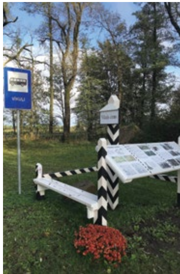
Verstu stabs Vīkuļu ciemā.

Joprojām nav vienota viedokļa par to, kas cilvēkus uzrunā vairāk – brošūras, grāmatas vai informācijas stendi. Daži apgalvo, ka vides zīmes – uzzīņas stendi – ir labākas nekā brošūras vai grāmatas. Jāatzīst, ka velopārgājiena maršrutiem piemīt lielāks potenciāls nekā grāmatai vai nelielam novada muzejam, jo tādējādi vēsturiskā informācija tiek pasniegta konkrētā notikuma vietā un novada ļaudis iepazīst ne tikai vēsturi, bet arī savu novadu. Bet, tā kā Babītes novadā jau ir Kultūrizglītības centrs „Vietvalži”, kas lieliski pilda novada muzejisko funkciju, jaunajai iecerei par novada identitāti meklēju citu risinājumu – izzināt vēsturi brīvā dabā. Projektā realizētie astoņi ekspozīcijas objekti apzināti izvietoti tajā Babītes novada teritorijā, kas piegulst Piņķu ciemam