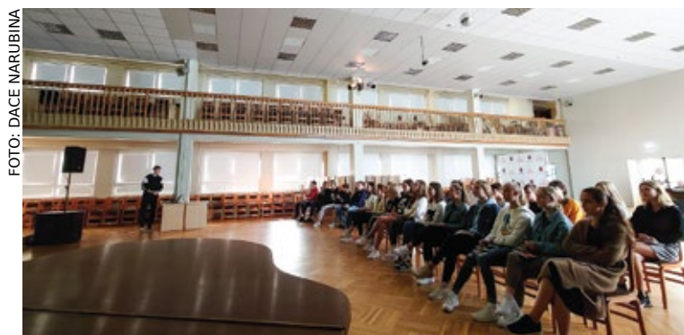
Jaunajā medijpratības treneri ieklausās 10. klašu izglītojamie.

Diāna Pekša, Babītes vidusskolas angļu valodas pedagoģe