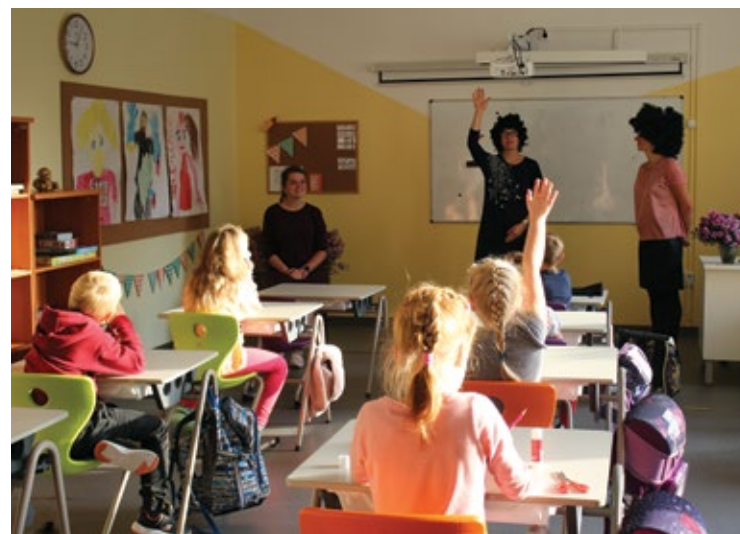
Audzēkņu mammas vada Skolotāju dienu 1. klasē.

Mācību priekšmetu jaunie skolotāji savām stundām bija sagatavojušies ļoti atbildīgi: eksperimenti, grupu darbi, radošie darbi un aktivitātes svaigā gaisā – viss tika ļoti apzinīgi organizēts, kā arī jaunieši pierādīja, ka prot noturēt klases uzmanību un disciplīnu. Bet skolotāji, kas nu bija pārtapuši par skolēniem, gan rādīja dažādas sejas – cits bija priekšzīmīgs skolēns ar teicamām sekmēm un pozitīvu attieksmi, cits traucēja klasesbiedrus, cēla kājas uz galda un protestēja ikkatram skolotāja teikumam. Jaunie skolotāji ar izaicinājumiem tika galā itin labi, tikai vienā gadījumā situācijai pieaicinot skolas direktori! Smieklīgi un atjautīgi bija gan skolēni, gan skolotāji. Radoši un