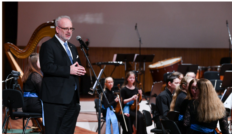
Valsts prezidents saka apsveikuma vārdus

atpazīt izcilības Latvijā. Tās nav vienkārši, ir jābūt ne tikai īpašam talantam, lai ieraudzītu šīs jaunās izcilības, bet skolotājiem arī jāspēj ievest jaunos cilvēkus mūzikas pasaulē un pārliecināt, ka bieži vien garlaicīgie vingrinājumi vai katru dienu ir svarīgāki nekā daudzas citas, citkārt