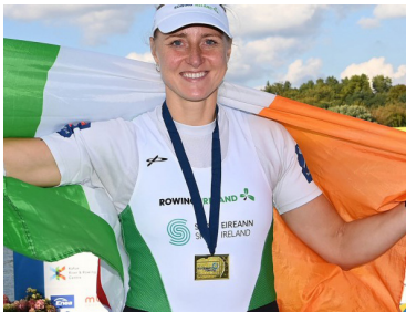
Sanita Pušpure

Polijas pilsētas Poznaņas apkaime noslēdzies Eiropas čempionāts akadēmiskajā airēšanā. Pērnā gada čempione, Īrijas latviete Sanita Pušpure (38) atkal izcīnīja pirmo vietu.