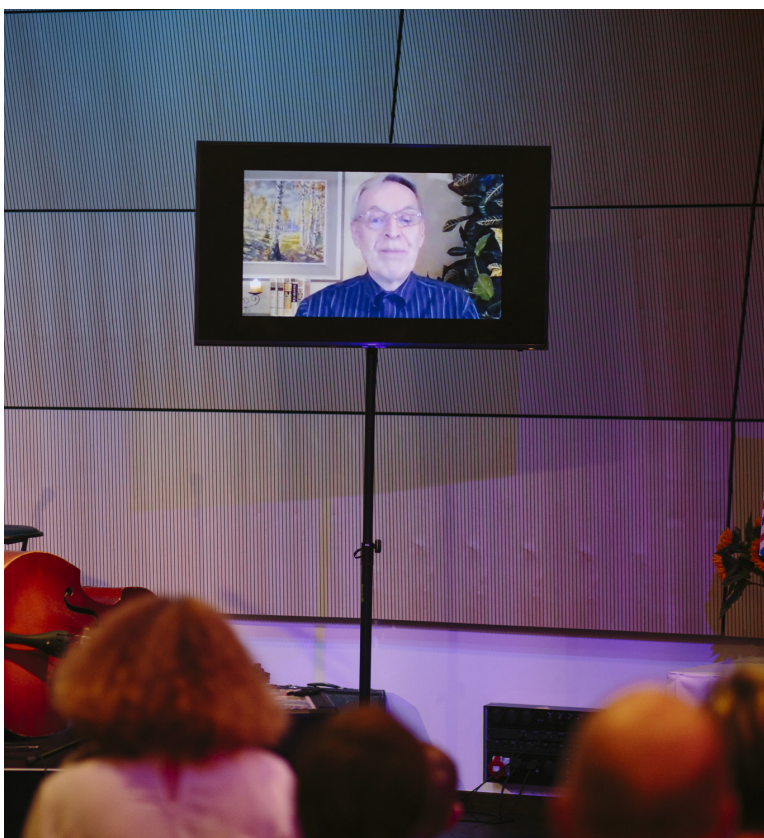
Latvijas publiku Ulbrokas pērlē virtuāli uzrunā Vilnis Baumanis

rakstnieces Noras Ikstenas vārds. Tekstā gan nav jūtami nodalīts, kuŗas rindas pieder Baumanim un kuŗu autore ir tālu aiz Latvijas robežām daudzdzīvotā literāte – Ikstenas romāns Mātes piens guvis starptautisku ievēribu un iedvesmojis pašmāju filmas tapšanu.