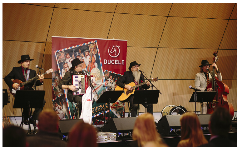
Mūzicē "Ducele" – ar "Trīs no Pārdaugavas" šarmu