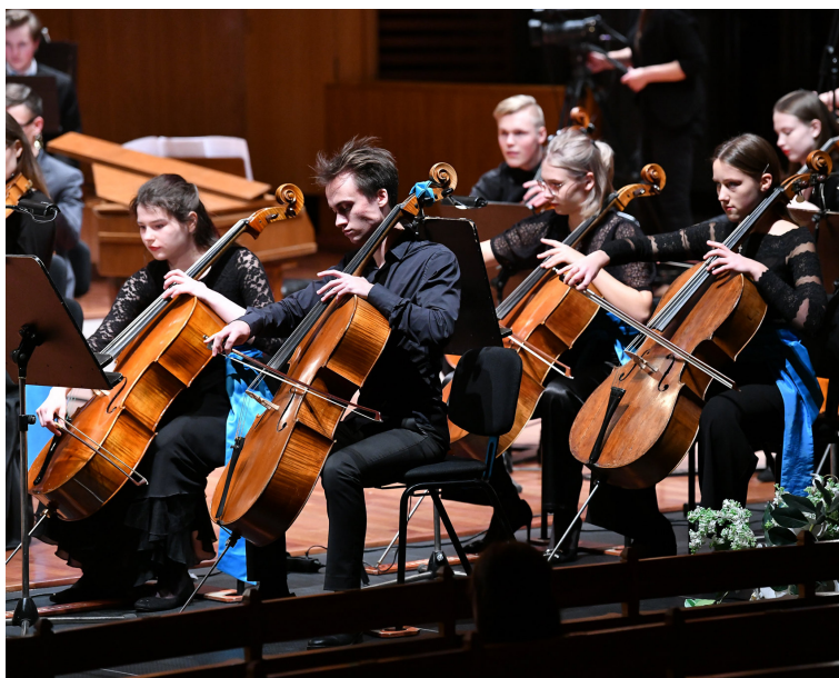
Mūzicē jauno talantu orķestris