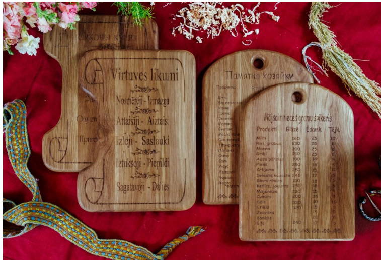
mājsaimnieces gramu "špikeris"

derēsies ikviena rokdarbnieka interjerā un praktiski kalpos kā palīgs, kas neļauj aizripot un sapaņķerēties dzijas kamoliem. Lai adīšanas vai tamborēšanas process būtu vēl ērtāks, bļodiņas sārā ir divi caurumiņi adatām. Kamolu trauks būs vērtīga dāvana sev vai tiem, kuŗiem patīk gaŗos ziemas vakarus pavadīt, darbojoties ar adatām. Keramikas studija "Jogita Art Studio" piedāvā arī citus keramikas izstrādājumus, piemēram, bļodiņas četrkājainajiem draugiem un puķupodus.