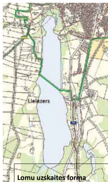
Lomu uzskaites forma