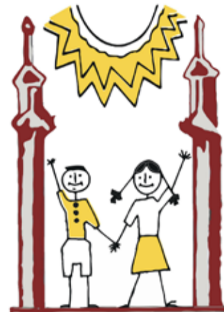
LIMBAŽU BĒRNU UN JAUNIEŠU CENTRS

Limbažu Bērnu un jauniešu centra organizētā vasaras nometne 1.-3. klašu skolēniem "Vasara 2020" šogad notiks no 20. jūlija līdz 7. augustam. Nometnē piedalīties varēs tikai Limbažu novadā deklarētie skolēni.