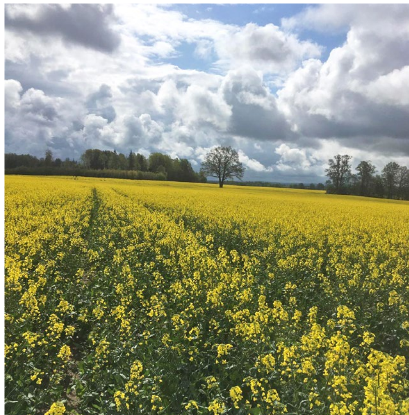
Ziemas rapsis ziedos.

M.K.: Esam veduši arī pārdot rapsi un graudus uz Lietuvu, kartupeļi ir vesti gan uz Uzbekiju, gan uz Krieviju, Ungāriju. Tagad pārsvarā produkciju realizējam Latvijā, ir labi noteikumi. Daugavpilī ir vairākas vietas, kur varam realizēt savu produkciju. Rindas lielas nav kā tas bija kādreiz, kad bija jānodod produkcija, toreiz bija jāpatērē tam daudz laika. Šajā ziņā viss daudz maz ir noregulējies, pašam tikai ir jāizvēlas izdevīgākais sadarbības partneris.