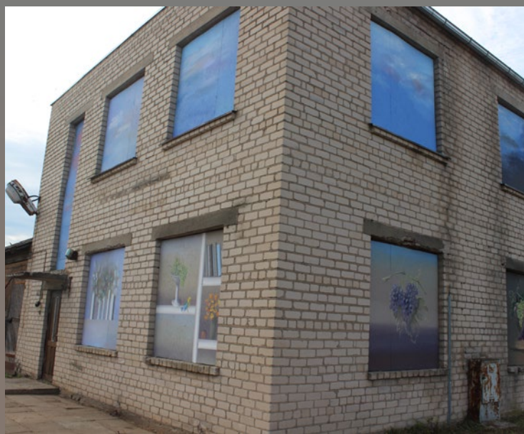
Ēka Dvietē, 2020. gada 22. augusts