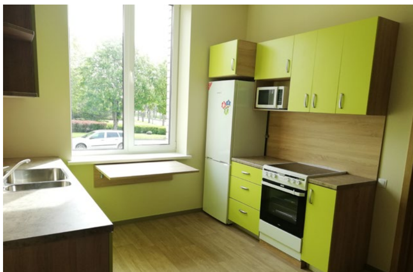
Virtuve jaunajā "FĒNIKSS" mītnē

ERAF finansējums - EUR 379 910,10 (85%); Valsts budžeta dotācija –