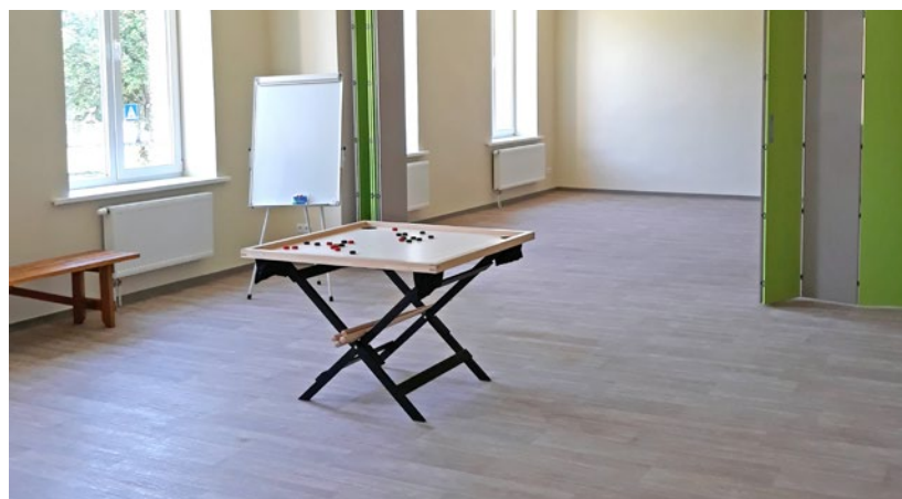
Atpūtas un pasākumu telpa jaunajā "FĒNIKSS" mītnē

EUR 20 112,88 (4,5%); Pašvaldības finansējums- EUR 46 930,08 (10,5%)