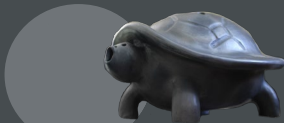
Bruņurupucis, kurš bija "jādabū pie dziedāšanas". Autors, podnieks Mareks Zavodnojs