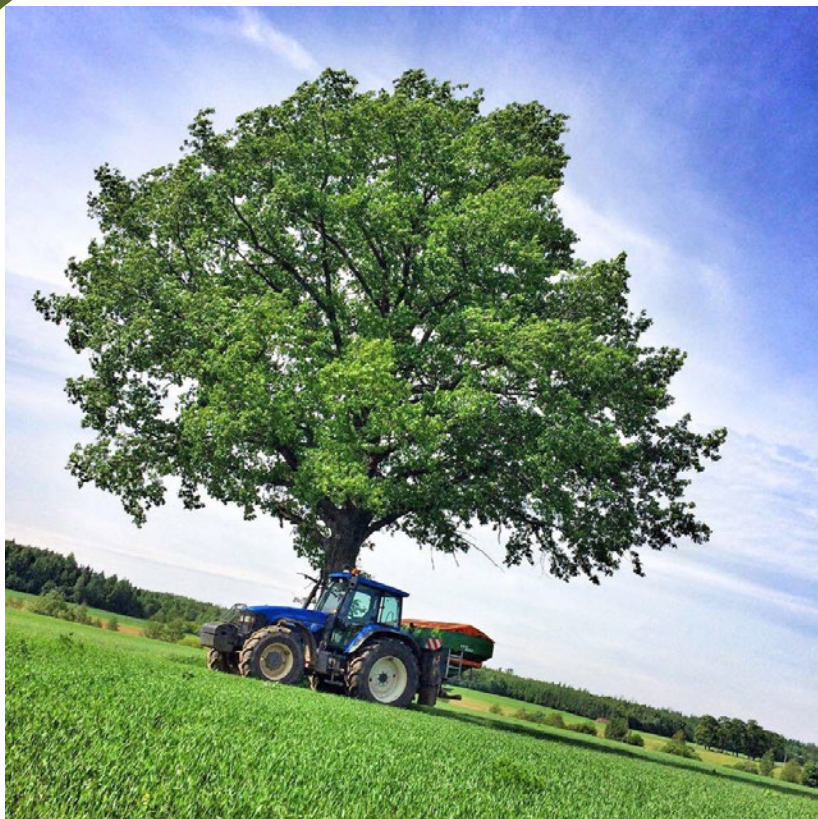
Virsmēslojam kviešus.