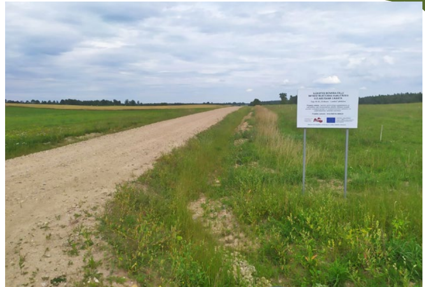
Atjaunotais ceļu posms “Gulbene–Lazdas”

Īstenojot projektu ir nodrošināta ceļa nestspēja, veikta ceļa seguma izbūve ar divkārtu virsmas pārklājumu un jaunu grants šķembu maisījumu, caurteku, grāvju izbūve, caurteku galu stiprināšana ar laukakmeņiem, izbūvētas nobrauktuves uz īpašumiem, uzstādītas ceļazīmes. Projekta ieviešanas rezultātā ir nodrošināta droša satiksme, veicināta apdzīvotības