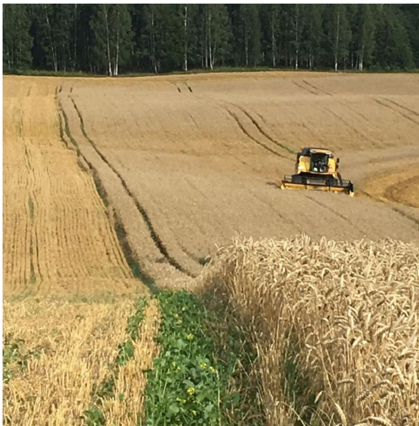
Kviešu pļauja.

A.P.: Cik Jums cilvēku saimniecībā strādā. Kā ir ar profesionāļiem, kuri sēžas uz kombainiem, traktoriem, vai ir darba spēks, vai ir attiecī-