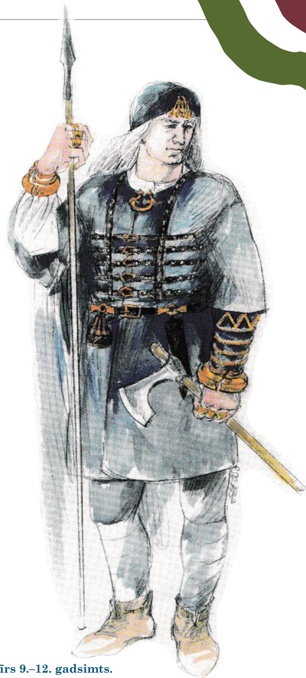
Sēļu karavīrs 9.–12. gadsimts.

Par sēļiem kā atsevišķu baltu tautību netieši liecina arī fakts, ka 1218. gadā tika izveidota Sēlijas bīskapija. Saglabājusies pāvesta Honorija III 1219. gada 25. oktobra bulla, kurā pāvests apstiprināja Sēlijas bīskapam viņa diecēzes robežas, kādas tai bija noteicis Livonijas bīskaps [117 I: 89. dok.]. Tā paša gada 28. oktobrī apstiprinātas Livonijas bīskapa tie-