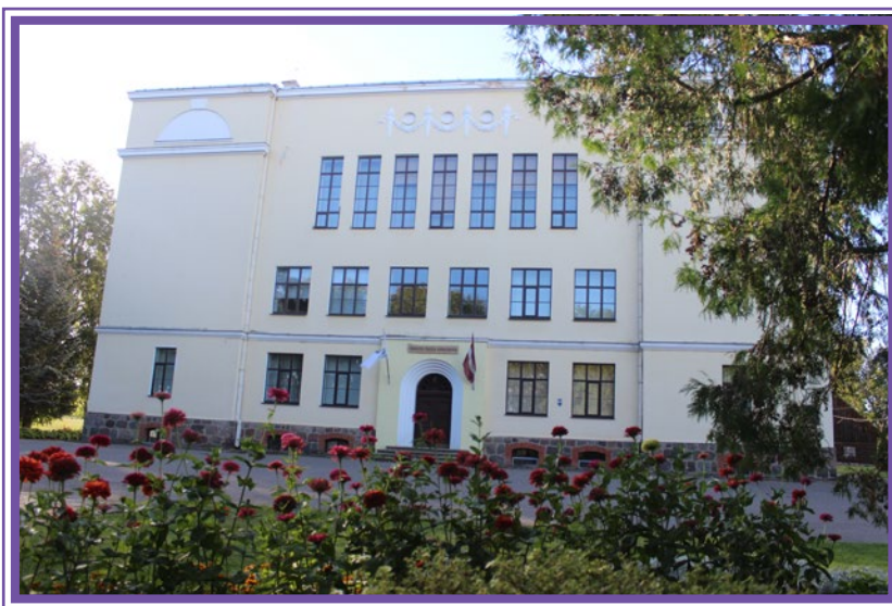
Ilūkstes Raiņa vidusskola (bij. 1. vidusskola) 2020. gada 20. augustā.