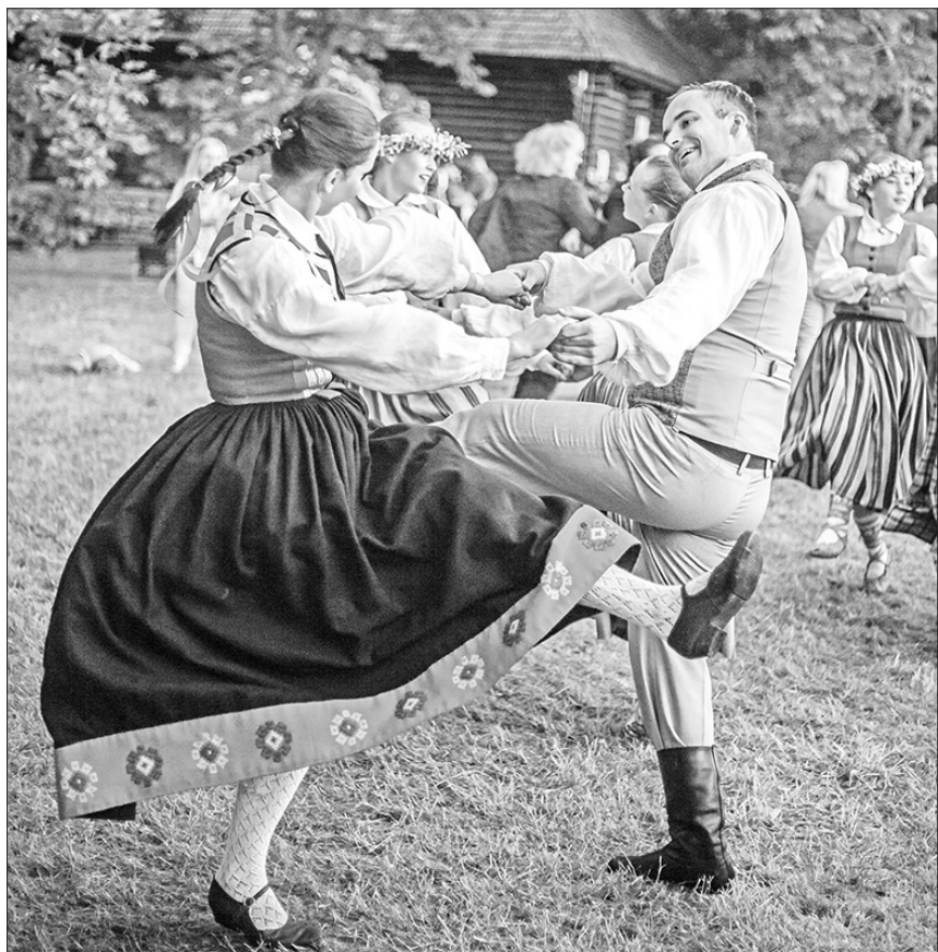
Līdz ar piedalīšanos Kalēju dienā 2020. gada 25. jūlijā “Kalna Ziedos” Aizkraukles novada kultūras nama deju kolektīvi (DK) “Aizkrauklēni”, “Zelji”, “Radi” un “Pēda” ir noslēguši 2019./2020. gada sezonu un sāk gatavoties nākamajai.

Augustā sāksim iekārtot mēģinājumu telpas Rūpniecības ielā 10, lai varētu sākt jauno sezonu. “Covid-19” ietekmētās darbības izmaiņas būs jūtamas vēl kādu laiku, bet darbs nav apstājies. Tiek meklēti un izstrādāti drošākie ar sanitāro protokolu saistītie risinājumi.