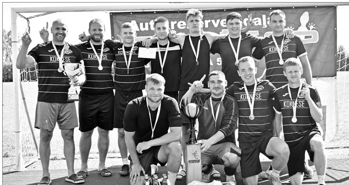
Bez uzvaras Aizkraukles minifutbolā Kokneses futbolisti arī ieguvuši ceļu zīmi startam LFF Vidzemes čempionāta finālā, kas uzvaras gadījumā paver iespējas cīnīties arī par valsts labākās komandas titulu.