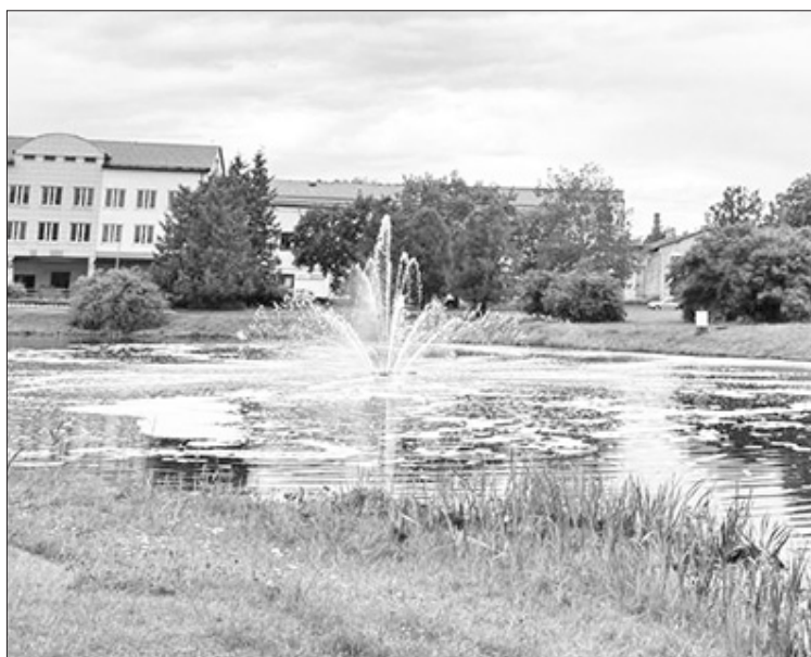
Pēc niedru izpļaušanas dīķis Aizkraukles pilsētas centrā ieguvīšis pavisam citu izskatu. Nākamie darbi ietvers dīķa gultnes tīrīšanu.