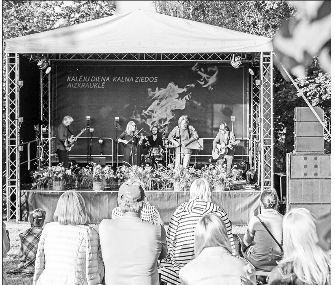
Postfolkloras grupas "Ilģi" uzstāšanās saulrietā, kurai sekoja kopīgi danči, Kalēju dienas noslēgumam piešķīra īpašu atmosfēru.

Muzeja dārzā līdz ar kalšanas skaņām izskanēja arī Skrī-