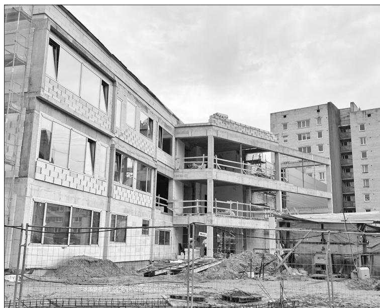
Tiklīdz skolas piebūve Draudzības krastmalā būs pabeigta, jaunās telpas pakāpeniski sāks izmantot.

Tagad, kad "grozu" izvēles process ir noslēdzies, redzam, ka eksaktās zinātnes ir pieprasītākas, jo humanitāro virzienu salīdzinoši izvēlējušies nedaudz skolēnu. Šī ir pavisam jauna pieeja, nākotnē redzēsīm, kā tā strādā. Pieļauju, ka laika gaitā humanitāro programmu piekārīgēsīm tā, lai jaunieši pilnībā nenogriež sev ceļu arī uz eksaktajās zinātnēs balstītajām profesijām. Pieredze liecina, ka liela daļa devītklasnieku vēl nezina, kādā jomā vēlas veidot savu