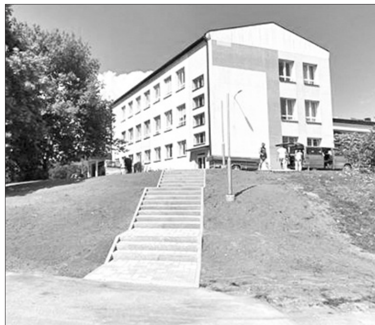
Kāpnes aiz kultūras nama atjaunotas mūsdienīgā izskatā; tām plānots piebūvēt arī margas.

Aizkrauklieši jau var priecāties par atjaunotajām kāpnēm aiz pilsētas kultūras nama, kā arī ierīkoto apgaismojumu Stadiona ielā, kas ved gar Daugavas krastmalu no kultūras nama līdz sporta stadionam. "Esam saņēmuši pirmās atsauksmes no iedzīvotājiem, kas tur