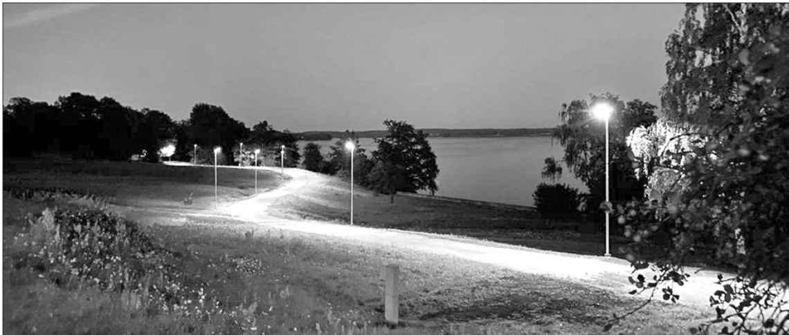
Vakariem kļūstot tumšākiem, pastaigas gar Daugavas piekrasti pa izgaismoto celiņu kļūvušas drošākas un patīkamākas.