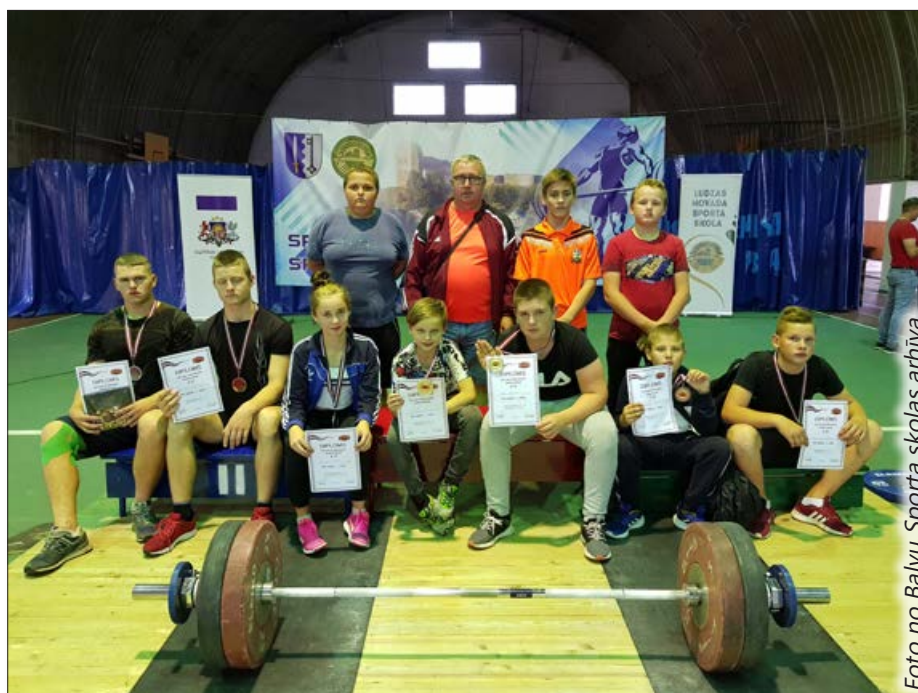
Komandas foto no Latvijas čempionāta Ludzā.

Prieks par jauniešu sasniegumiem! Apsveicam!