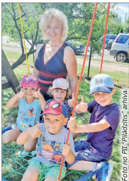
Bērni bauda atpūtu šūpolēs – stārķa ligzdā.