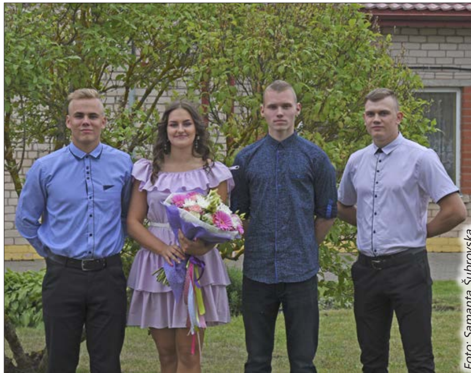
Pilngadības svētku gaviļņieki.

Protams, nevarējām iztikt bez vietējiem māksliniekiem. Svētkus papildināja vietējo aktieru brīvdabas izrāde ar muzikālām pauzēm, kurās muzicēja mūsu dāmu grupa AMMA. Dramatiskā kolektīva izrāde atspoguļo notikumus, kādi varētu būt risinājušies vietējā pagastā apmēram pagājušā gadsimta 30. gados. Kolorīti tēli,