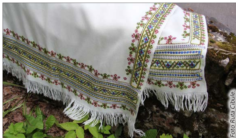
Skaidrītes Šneperes izšūtā villaine.