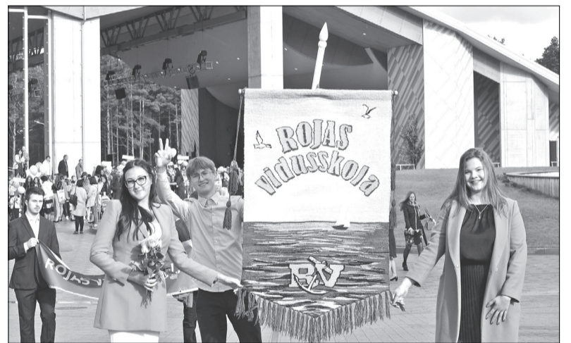
Par jauku tradīciju varētu veidoties vidusskolas gājiens no Rojas brīvdabas estrādes uz skolu. Šogad tas viesa pozitīvas emocijas ikvienā garāmgājējā, kuri apstājās, lai sveiktu garām ejošo jauno paaudzi – mūsu nākotnes cerību.

Šajā svētku dienā tika sveikti arī tie skolēni, kuri pagājušajā mācību gadā guvuši izcilas sekmes mācībās un sportā. Šī gada titula „Gada skolēns” ieguvējs