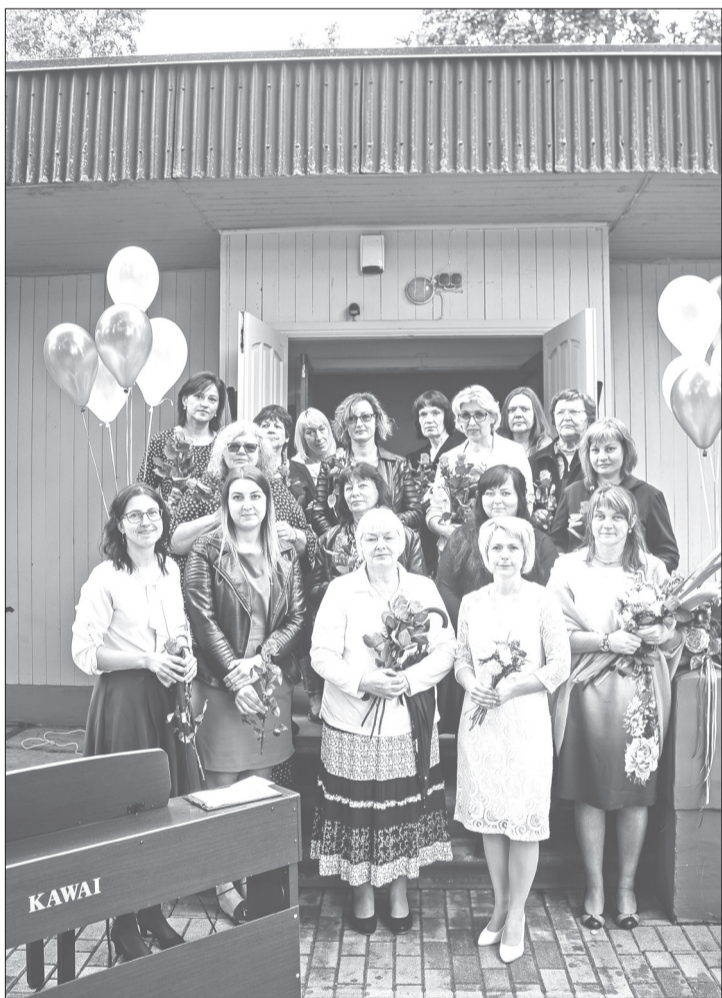
Rojas Mūzikas un mākslas skolas kolektīvs, jauno mācību gadu sākot.

Jaunais mācību gads ir iesācies, un esam priecīgi, ka skolā atkal skan bērnu soļi un čalas, dzirdama mūzika un redzama jauno mākslinieku darbošanās.