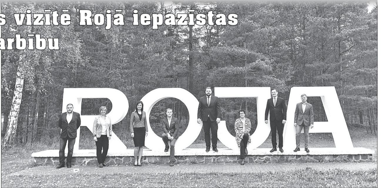
Atmiņai par tikšanos Rojā – kopīgs foto.

Pēc vizītes Ekonomikas ministrs atzina, ka Latvijas mazās ostas ieņem stabilu vietu Latvijas ekonomikā un ir izveidojušas par reģionālās ekonomiskās aktivitātes centriem. Galvenie ostu darbības virzieni ir gan kokmateriālu eksports, gan zvejniecība, gan jahtu uzņemšana. Priecē, ka mazo ostu darbībā un uzņēmumos, kas saistīti ar ostu pakalpojumiem,