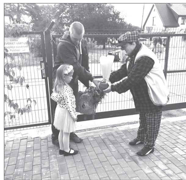
Klauniņš Čaps katru mazuli ar vecākiem sagaidīja jau pie dārziņa vārtiem.