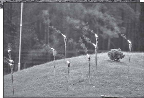
Estrādes apkārtni un ceļu uz jūru izgaismoja lāpas.

uztīcīgo sadarbību jau 19 gadu garumā radot ugunīgas brīnumus Rojas pludmalē, un skatītājiem, kas nenobijās no lietainā vakara, atnāca un ļāva sajūst savu prieku. Savukārt manis pašas īpašais paldies „Raida Roja”, kas arī man, atrodoties pašizolācijā, ļāva mājās pie datora izdzīvot šo vienu no skaistākajiem pasākumiem, kas pulcināja jūras, mūzikas, vēja, ūdens un uguns draugus. ■