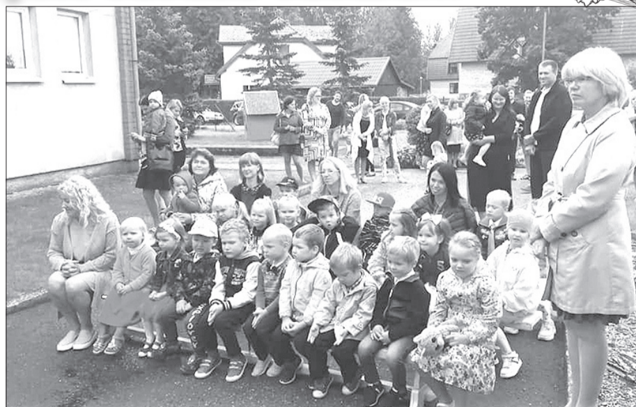
1. septembrī mazliet satraukti ir gan audzēkņi, gan vecāki un audzinātājas.

Saku lielu paldies sadarbības partneriem par vides lab-