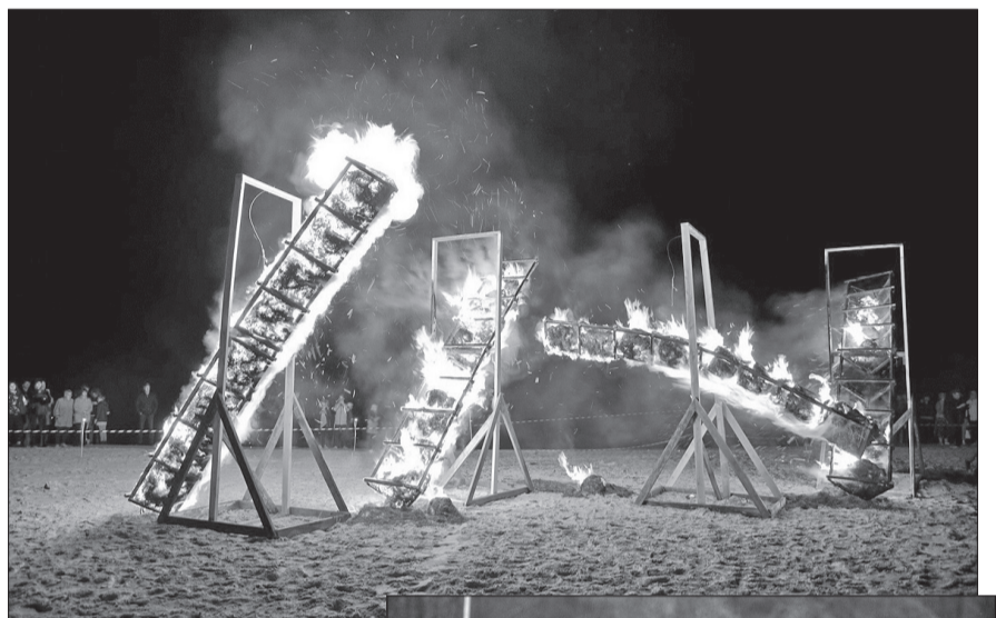
↑ Jūra un uguns veidoja īpašu maģiju.

uztīcīgo sadarbību jau 19 gadu garumā radot ugunīgas brīnumus Rojas pludmalē, un skatītājiem, kas nenobijās no lietainā vakara, atnāca un ļāva sajūst savu prieku. Savukārt manis pašas īpašais paldies „Raida Roja”, kas arī man, atrodoties pašizolācijā, ļāva mājās pie datora izdzīvot šo vienu no skaistākajiem pasākumiem, kas pulcināja jūras, mūzikas, vēja, ūdens un uguns draugus. ■