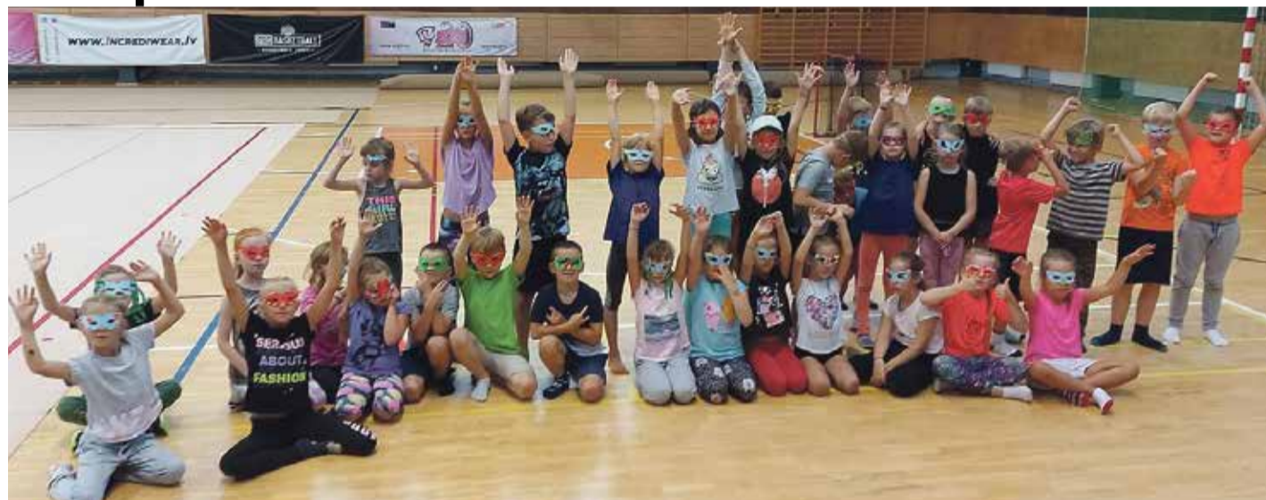
Sporta nometnē „Nāc un sportot sāt!” bērniem bija iespēja ne vien iepazīt visus Saulkrastu sporta centra piedāvātos sporta veidus, bet arī piedalīties radošajās darbnīcās.

Sporta centrs Zvejniekiemā apsaimeko modernu sporta stadio-