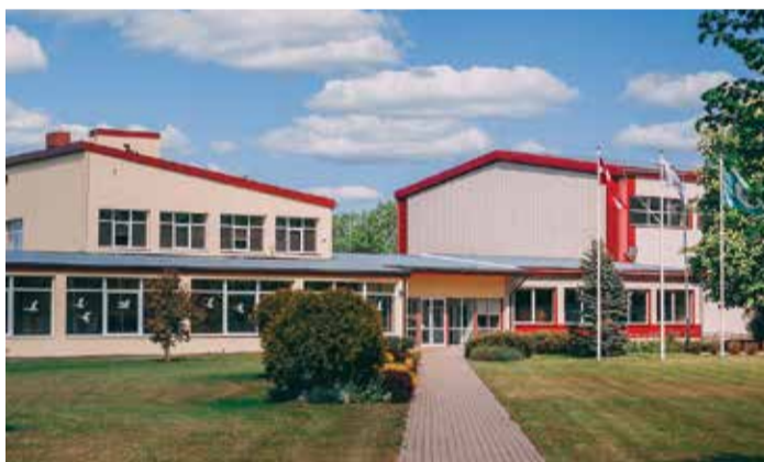
Zvejniekiema vidusskola.

— Kā notiek Saulkrastu novada vispārīglokojošo mācību iestāžu tīkla vērtēšana?