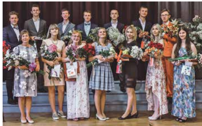
24. jūlijā, dienā, kad visiem valsts 12. klašu absolventiem bija iespēja uzzināt eksāmenu rezultātus, Saulkrastu vidusskolā notika izlaidums.

No visas sirds vēlam absolventiem saglabāt jaunības entuziasmu un enerģiju, kas tik ļoti būs nepieciešama turpmākajā izglītības ceļā.