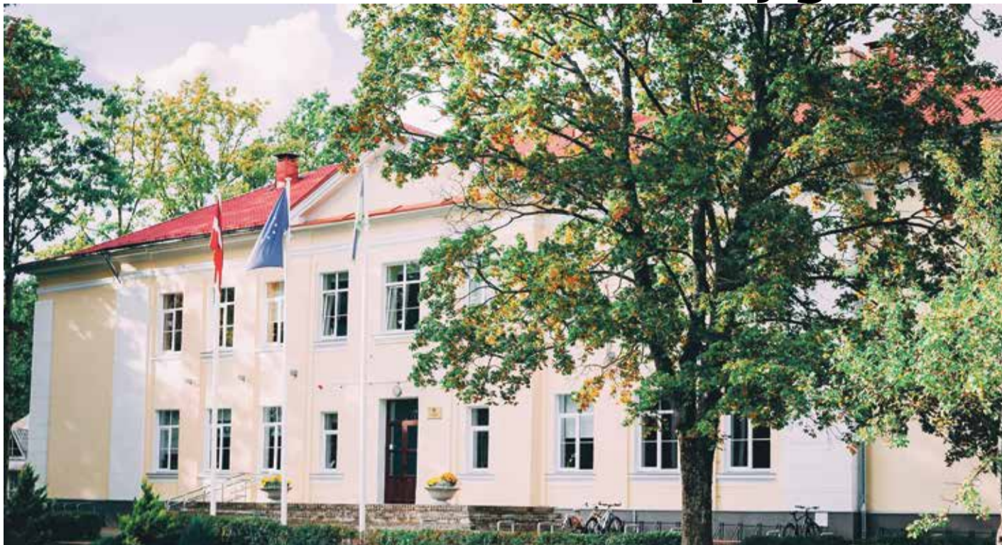
Saulkrastu vidusskola atrodas pašvaldības centrā, un turpmāk, apvienojoties ar Zvejniekiema vidusskolu, tā varētu kļūt par Saulkrastu novada vidusskolu. Šoruden notiks arī sabiedriskā apspriešana, kurā aktīvi iesaistīties aicināti pedagogi, skolēni, viņu vecāki un citi iedzīvotāji.

— Pirmsskolas izglītības iestādi „Rūķītis” apmeklē 248 bērni (pēc 31.08.2020. šis skaits mainīsies), bet ir zināms, ka vēl aptuveni 25 bērni vēlētos to darīt, bet PII nav vietas. Zināms, ka Saulkrastu pašvaldība piešķir kompensācijas, lai atbilstoši Ministru kabineta (MK) noteikumiem vecāki varētu atvasēm no 1,5 līdz 5 gadiem rast iespēju privāto bērnudārzu vai sertificētu aukļu pakalpojumu izmantošanai. Mani pozitīvi pārsteidza, ka pašvaldība vecākiem ļauj bērnu uzraudzības pakalpojumus izmantot arī citās pašvaldībās. Piemēram, vecāki ir deklarēti Saulkrastu pašvaldībā, bērna vecvecāki dzīvo Siguldā, un ģimene drikst pretendēt uz pašvaldības atbalstu. Protams, arī vecvecākam ir jābūt aukles sertifikātam. Līdz šim bija kārtība, ka katru šādu vecāku pieteikumu izskatīja ikmēneša Saulkrastu novada domes sēdē. Šogad vienā no tām domes deputāti pieņēma saistošo noteikumu grozījumus, kas turpmāk atļauj šo lēmumu pieņemt izglītības darba speciālistam. Pirmos iesniegumus apstiprināšu augustā, un šis process būs daudz ātrāks nekā agrāk.