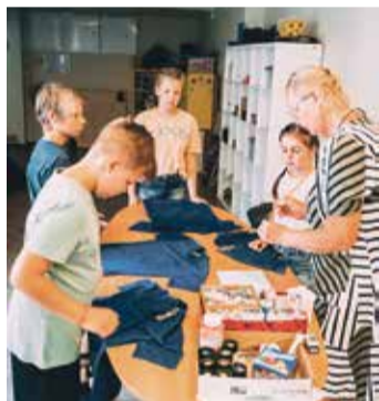
Atbilstoši nometnes tematikai par upēm bērni paši radoši apzīmēja T kreklus.

Bērnu vasaras dienas nometnes Saulkrastos ar pašvaldības atbalstu tiek organizētas jau 16 gadus. To mērķis ir sniegt mūsu pašvaldības bērniem lietderīgas un interesantas brīvā laika pavadīšanas iespējas, draudzēties un rūpēties vienam par otru, atklājot sevi jaunus talantus un prasmes, apgūstot patstāvību, sociālās prasmes un stiprināt atbildības sajūtu. Nometnes pasākumi katru gadu tiek rūpīgi plānoti, sekojot aktualitātēm sabiedrībā un bērnu vecuma īpatnībām, vēlmēm un interesēm. Šogad, kā zināms, būtiskas izmaiņas mūsu ikdienas ritmā un virkni ierobežojumu ieviesa vīrusa COVID-19 pandēmija, tomēr, ievērojot visus valstī noteiktos drošības noteikumus, nometnes rīkot bija atļauts, par ko