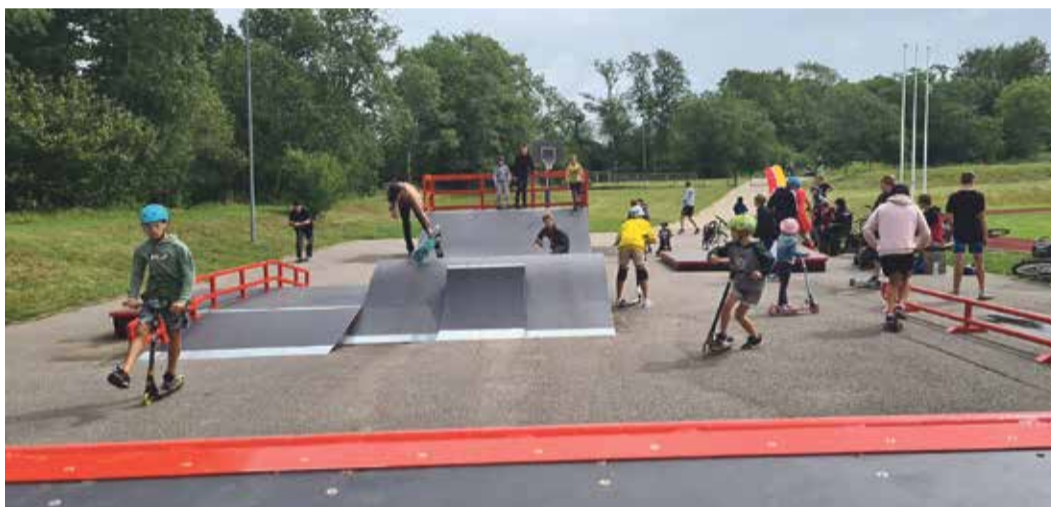
Lai pirmie varētu izmēģināt atjaunotās rampas, skeitlaukuma atklāšanas dienā Zvejniekciema stadionā ar skrituļdēļiem, skrejriteņiem un riteņiem bija ieradusies vairāki desmiti bērnu un jauniešu. Zvejniekciema skeitlaukums ir populāra bērnu un jauniešu brīvā laika pavadīšanas vieta.