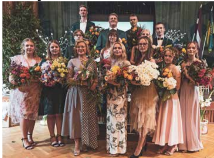
Šogad Zvejniekciema vidusskolā notika 53. izlaidums, kurā atestātu par vidējās izglītības iegūšanu saņēma 15 mērķtiecīgi, neatlaidīgi, radoši un dzīvespriecīgi jaunieši.