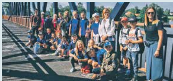
„Jauniešu mājas” dienas nometne bērniem „Visas upes tek uz jūru” 3. lpp.