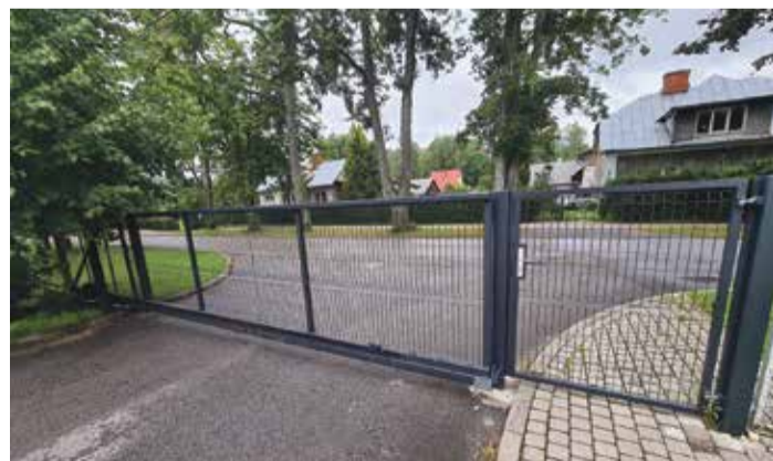
Saulkrastu sporta centrā uzstādīti jaunie elektroniskie vārti.

Šobrīd lielākais izaicinājums mums ir Saulkrastu sporta centra apvienošana ar „Jauniešu māju”, jo