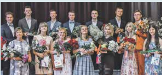
Izlaidumi Saulkrastu novada izglītības iestādēs 5. lpp.