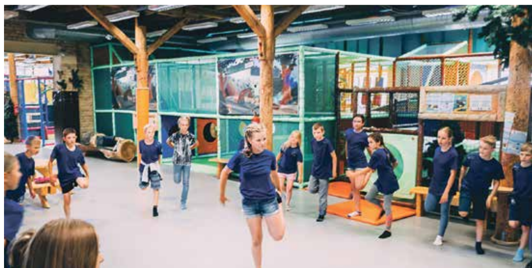
Atraktivu parkā „City kids” Rīgā. Bērni bija devušies vērot eksperimentu šovu, turklāt pašiem bija iespēja līdzdarboties dažādās sportiskās aktivitātēs.