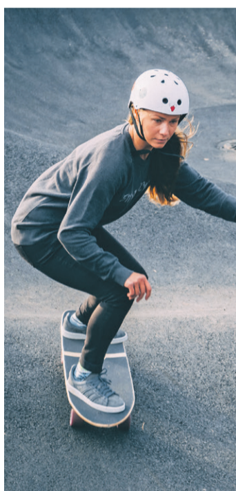
Trase pielāgota velosipēdistiem, skrituļslidotājiem, skeitbordistiem un citiem sportistiem, kuri brauc ar rotējošiem riteņiem.

Trase pielāgota velosipēdistiem, skrituļslidotājiem, skeitbordistiem un citiem sportistiem, kuri brauc ar rotējošiem riteņiem.