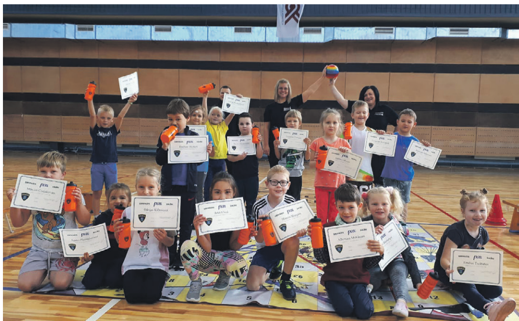
Saulkrastu vidusskolas 1.a klase un Saulkrastu pašvaldības policijas darbinieki.