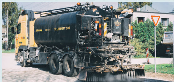
Pabeigta Baltijas ielas pārbūve