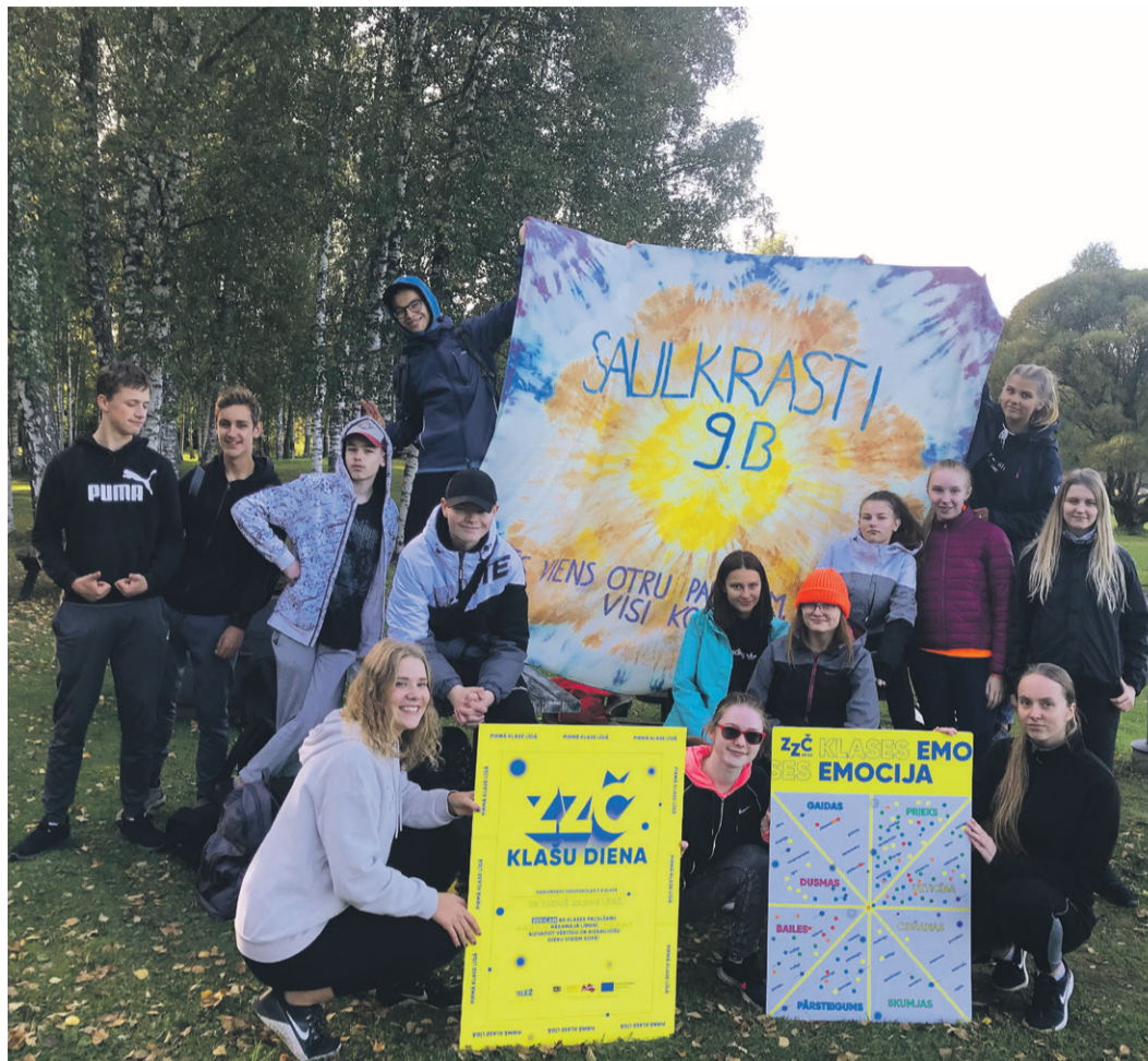
Saulkrastu vidusskolas 9.b klase ieguva iespēju piedalīties ZZ Čempionāta Klašu dienās Vidzemē, pie Vaidavas ezera, kur jauniešiem visu dienu bija iespēja personības izaugsmes trenera vadībā veikt visdažādākos uzdevumus.

Septembrī viss lielais skolas kolektīvs ne tikai atsāka mācības klātienē, bet arī koncentrējās uz nodarbībām, kurās apguva kolektīvo un āra mācīšanos, ko bija grūti īstenot attālināto mācību laikā, jo tam nepieciešama atrašanās konkrētā vidē, visu iesaistīto pušu klātbūtne, savstarpēja sadarbība un atbildība. Sākumskolas 1. klasēm tās bija iepazīšanās nodarbības ar skolu, skolas apkārtni, bibliotēku un drošību uz ceļa, lai sasniegtu konkrētās vietas. Pirmklasnieki darbojās gan skolotāju, gan pašvaldības policistu vadībā, izspērojot dažādas situācijas atraktīvās spēlēs un rotaļās. Bibliotēkas grāmatu plauktos tika meklēti un atrasti lasītpriekš. 2. un 3. klašu skolēni savas zināšanas par personīgo drošību padziļināja centrā „Dardedze”, tiekoties ar drošuli Džimbu. 4. klašu audzēkņi dabas un tehnoloģiju parkā „Urda” piedalījās nodarbībā „Es vidē – šodien un rīt”, kurā daudz uzzināja par papīra septiņām dzīvībām, atkritumiem, ko „ražojam”, un nepieciešamību tos šķirot, lai nākamās pa-