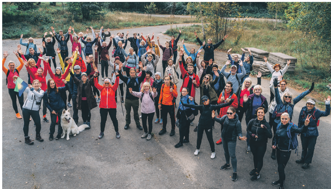
Pārgājiena dalībnieki Lilastē, bijušajā armijas slēgtajā teritorijā.

Tālāk pārgājiens turpinājās caur mazu priedišu audzi Piejūras dabas