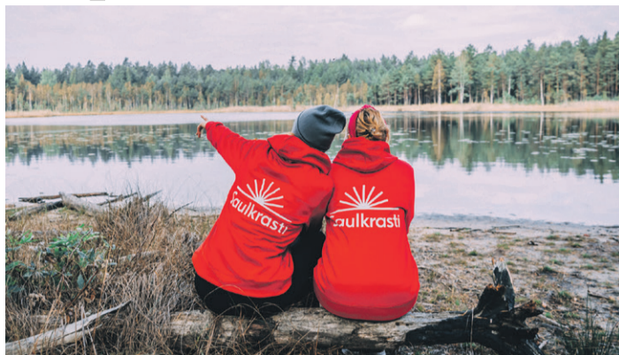
Pusdienu piknika pauze pie purva ezera — Ķīrezera.

Elza Antonova, Komunikācijas un tūrisma nodaļas vecākā tūrisma speciāliste