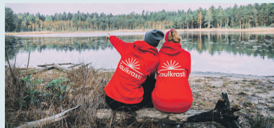
Iepazīsti citādu Saulkrastu novadu!