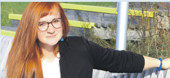
Intervija ar SIA „Saulkrastu komunālserviss” valdes locekli