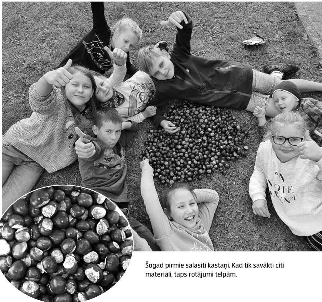
Šogad pirmie salasīti kastaņi. Kad tik savākti citi materiāli, taps rotājumi telpām.