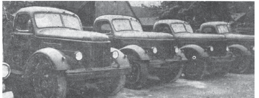
Padomju Kuldīga, 4. oktobris, 1960. g.