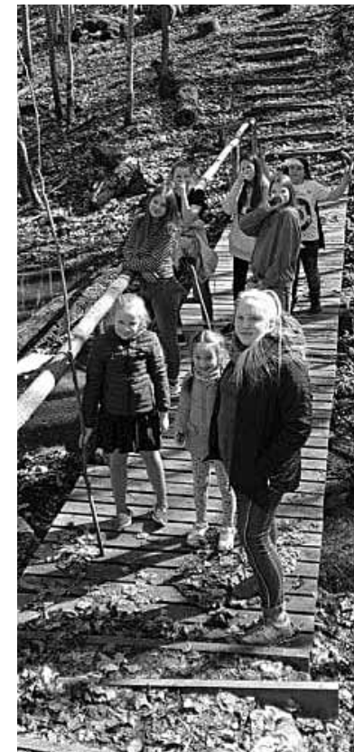
Dabas materiālu vākšana Rudbāržu jauniešu klubiņā kļuvusi par ikgadēju nodarbi. Dalībnieki pērnuden pārgājiena.