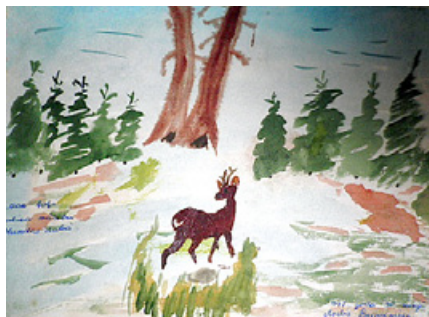
Anda Bikaunieka zīmējums.

„Uzraksti man, mīļotais, vēstuli bez vārdiem. Uzraksti no debesīm vēstuli bez vārdiem. Man lielu prieku sagādās šī vēstule bez vārdiem, Un grūtā brīdī mierinās šī vēstule bez vārdiem. Izlasīt es prātīšu šo vēstuli bez vārdiem, Gājputni to atnesīs uz saviem stipriem spārnieniem...”