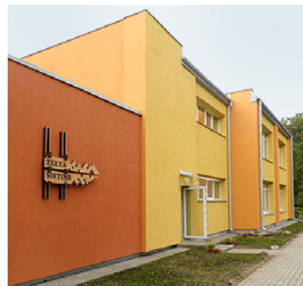
Rubeņu bērnudārza ēka nosiltināta.

Tāpat skolas telpās ir pozitīvas pārmaiņas – jaunu krāsojumu ieguvis vizuālās mākslas kabinets, nu tas ir romantiskos ceriņkrāsas toņos, kas bērnus varētu vadināt uz sapņošanu un radošām izpau-