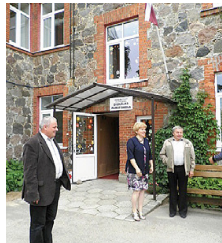
Pie Dignājas pamatskolas.