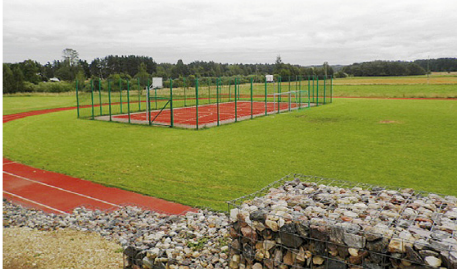
Ābeļu pamatskolas stadions.