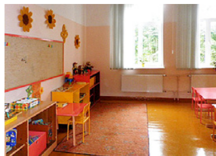
Mājīgā klasīte pirmsskolas bērniem.