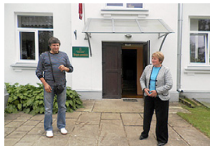
Pie Bērzgales skolas ieejas.