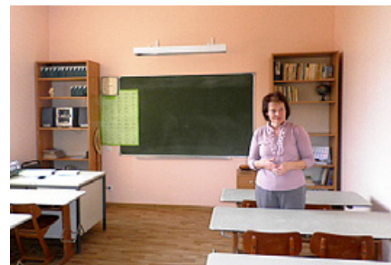
Skolotāji gaida savus skolēnus.

Pēdējā izglītības iestāde ko apmeklēt, ir Bērzgales pamatskola . Skola neliela un mājīga, saskatā apkārtnē priecē ar visiem alfabēta burtiem, kas izgatavoti no sūnām, smilgām un rudens ziediem. Brīnumjaukas dekorācijas – ar sārtiem āboliem piekrauti koka ratiņi – izvietoti uz logiem. Klasītēs veikts kosmētiskais remonts, un būtiskākā pārmaiņa – pirmssko-