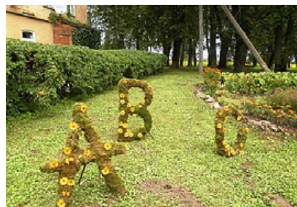
Sūnu burtiņi skolas pagalmā.