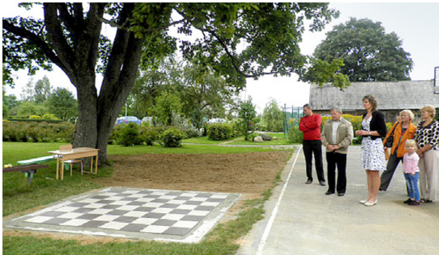
Dignājas skolēniem iekārtota atpūtas vieta.