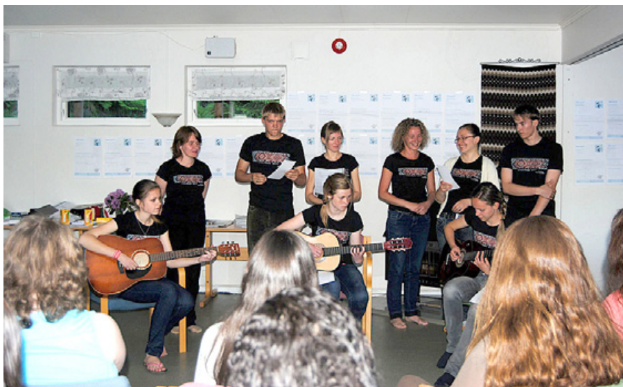
Jaunieši prezentē Latviju.

Otrā diena turpinājās ar vēl pamatīgāku viens otra iepazīšanu interaktīvu spēļu