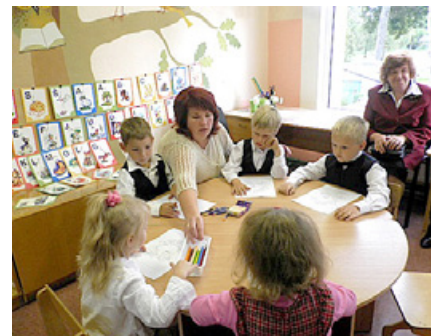
Bērniem prieks darboties skaistās telpās.