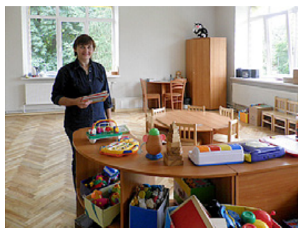
Jaunizveidotā pirmsskolas klasīte.

mis vērtējumu E vai F līmenī, visi absolventi iestājušies augstskolās, pie tam – budžeta grupās. Tā ka – izvēlies Zingas vidusskolu, tas ir drošs ceļš uz augstskolu un interesanti pavadīt vidusskolas gadu!