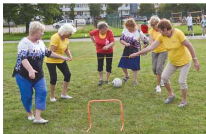
Florbola spēles laikā augustā Kuldīgā pasākumā Esi kustīgs un lustīgs.