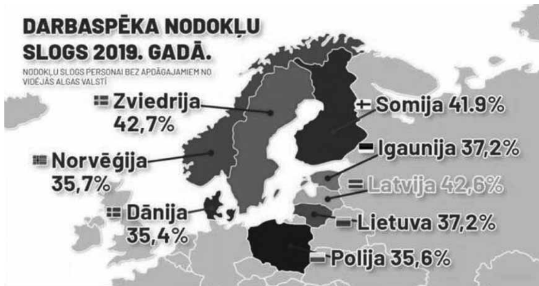
Darbaspēka nodokļu sloga salīdzinājums 2019. gadā.

Baltijā. Latvijā un Igaunijā pagājušā gada līmeni sasniegt bijis grūtāk nekā Lietuvā.