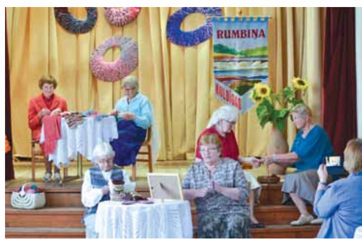
Šogad Dzejas dienās – dramatiskā pulciņa dzejas kompozīcija par latviešu sievietēm.