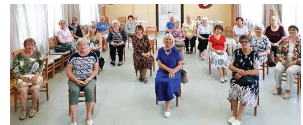
Pulciņu un interešu kopu vadītāji 27. jūlijā apspriež, kā turpināt darbu Covid-19 apstākļos.

Ar labu vārdu viņa piemin arī iepriekšējos vadītājus, atminas svētkus, balles, krāšņos karnevālus, ekskursijas, izbraukumus ciemos un nodarbības.