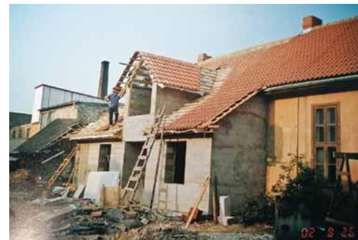
2002. gada vasarā SIA Cetne būvuzrauga Viļņa Baloža pārraudzībā Liepājas ielā 14 sāka ēkas pielāgošanu pensionāru vajadzībām.