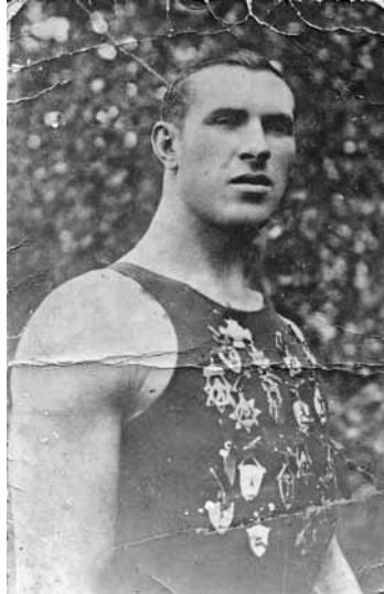
Māra vectēvs Fricis Bikse – Latvijas boksa čempions smagajā svarā 20.-30. gados.