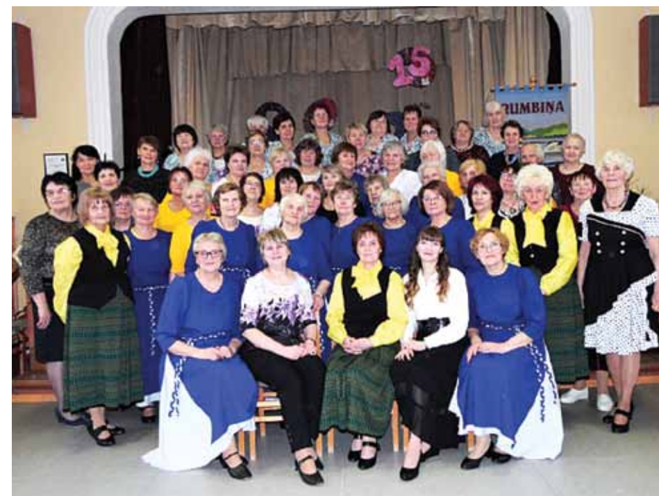
Jaunrades deju kopai Nianses – 15 gadu jubileja šogad.