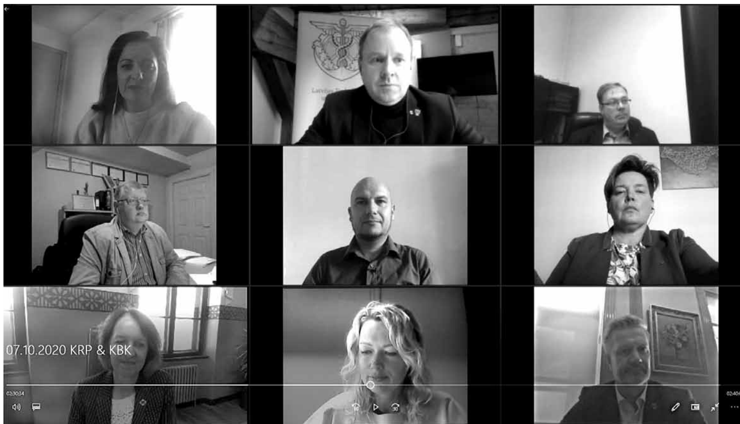
Kurzemes biznesa klubs oktobrī satikās platformā Zoom.

Patēriņš ir strauji atgūvis – karšu tēriņi atjaunojušies visā