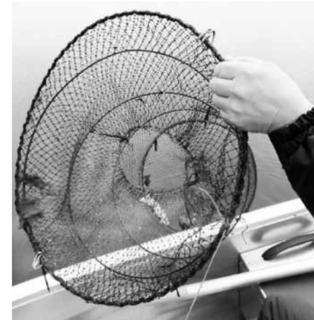
Reidā atrasts gan nelikumīgs zvejas tīkls, gan murds un, par laimi, tikai viena maza zivtiņa. Skrundas pašvaldības policija sola, ka turpmāk pārbaudes upēs būs daudz biežākas un tā izmantos visu šovasar saņemto inventāru.