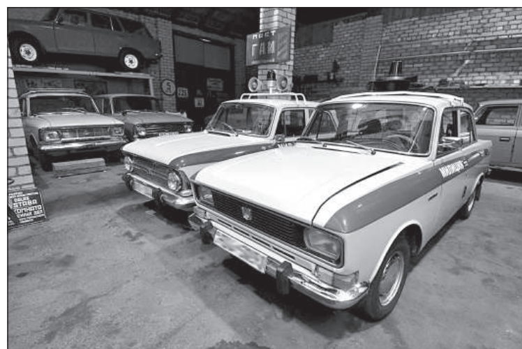
Моменты открытия выставки ретро-автомобилей и предметов советского времени «РетроГараж-Д».