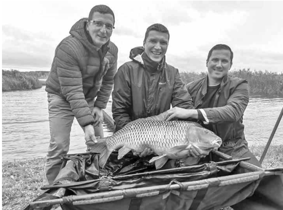
Līdz šim Baļotē lielākā noķertā karpas svērusi 12 kg. Varbūt jau pavisam drīz kāds noķers vairāk nekā pudu smago Nesiju un labos rekordus.

Katru gadu novada ūdenstilpēs tiek papildināti zivju resursi – gan lai saglabātu un uzlabotu zivju sabiedrības kvalitāti, gan par prieku makšķerniekiem. Izņēmums nebija arī šis gads.