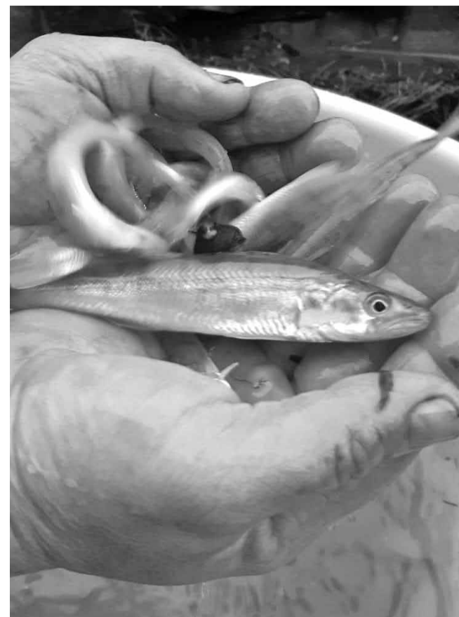
Zandartu mazuļiem jāaug vismaz pieci gadi, lai tie sasniegtu minimālo lomā paturamo garumu 45 cm.

Savukārt citos novada ezeros šonedēļ ielaisti līdaku mazuļi. Ildzenieka ezeram tikuši 2600 līdacēni, Marincejas ezeram – 7000, Laukezeram – 5000. Pašlaik līdz 30