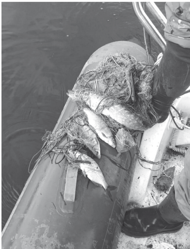
Šīm Daugavas iemūtniecēm palaimējās – pēc atbrīvošanas no maluzvejnieku tīkla tās varēja atgriezties Daugavas dzelmē.

Lielākā daļa pārkāpumu tiek atklāta, pateicoties modernajām tehnoloģijām – kamerām, droniem. Dienestā ir tikai trīs darbinieki, kam bez zvejas noteikumu kontroles jāveic arī daudz citu pienākumu, tādēļ jaunāko tehnoloģiju pielietošana ļoti atvieglo darbu. Vietās, kur uzstādītas kameras, ir pieaudzis atklāto pārkāpumu skaits. Šis modernās iekārtas maksā dārgi, un Krustpils novads bez ievērojama Zivju fonda finansiāla atbalsta to diez vai varētu iegādāties.