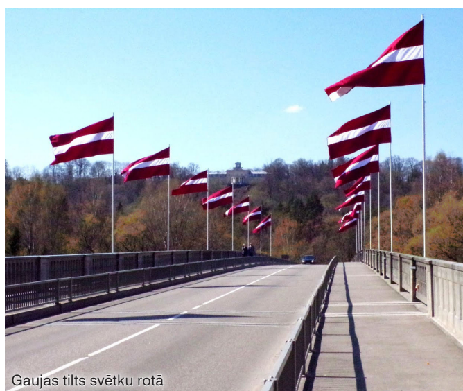
Gaujas tilts svētku rotā

Vakarpusē, atzīmējot Latvijas Republikas proklamēšanas 102. gadadienu, no plkst. 16.00 līdz 21.00 kultūras centra “Siguldas devons” fasāde atdzīvosies īpašā svētku rotā, veidojot mūzikas un gaismas saspēli. Būs iespēja nosūtīt sveicienus Siguldai, Latvijai vai līdzcilvēkiem, kas atspoguļosies uz “Siguldas devona” fasādes.