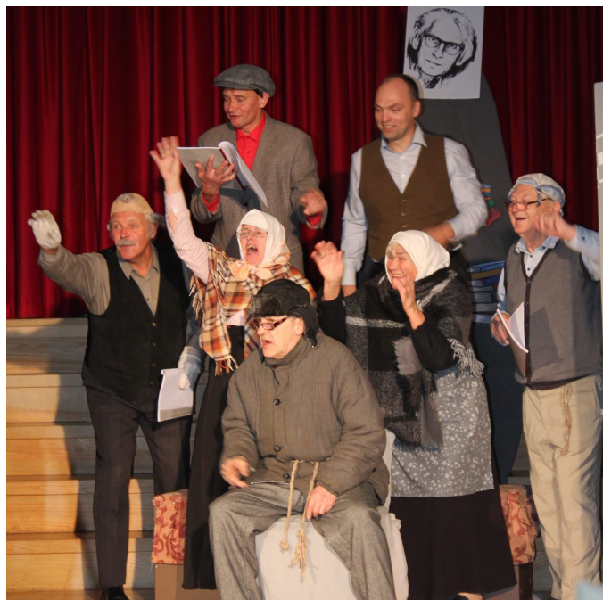
Visam aktieru ansamblim ir vajadzīgā saprašanās uz labākās nots

Veidojot izrādes scenāriju, no romāna nav paņemti notikumi pilnībā, bet izvēlējos atsevišķus fragmentus. Tas, ka grāmata jau sastāv no atsevišķām epizodēm, mazliet atviegloja darbu. Izrādi veidojām tā, kā skatītājs, lasot grāmatu, vizuāli redzētu romāna notikumus. Tāpēc arī, lai tieši uzrunātu skatītājus, izrādi rādījām zālē, ne uz skatuves. Iestudējuma ritms un temps vairāk kā divu stundu garumā ir pagrūts un aktieriem pie tā ir jāpieder. Visam aktieru ansamblim tiešām ir vajadzīga saprašanās un saspēle uz labākās nots, jo aktieriem izrādes laikā nav laika apstāties un padomāt, kur un kas. Tāpēc izrāde kļūst mazliet īsāka, lai tas temps, kādā jārikojas aktieriem, atveidojot vairākas lomas, būtu apgūstams bez lielākas piepūles.