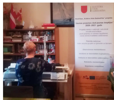
Nodarbība ar adāmmašīnu

Ir doma, ka 2021. gada februārī veidosim nākamā gada interesentu iesaukumu, lai pēc iespējas vairāk cilvēki tiek pie šīm izglītojo-