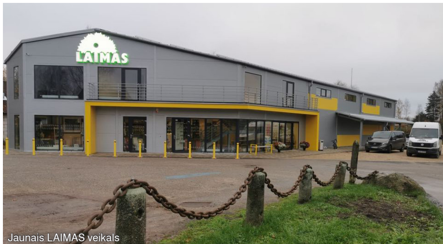
Jaunais LAIMAS veikals

Lepojamies, ka Krimuldas novadā attīstās un paplašinās pakalpojumu klāsts iedzīvotājiem!