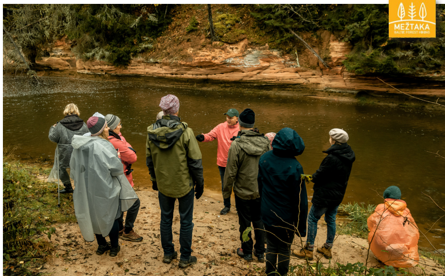
Pie Amatas upes gleznainajiem līkločiem.

"Mežtaka" ir Eiropas garās distances pārgājieni maršruta E11 daļa Baltijas valstīs. Maršruts ir veicams 50 vienas vai divu dienu pārgājieni posmos. Pārgājienam iespējams izvēlēties jebkuru posmu – tiem ir atšķirīgas grūtības pakāpes, kuras norādītas pievienotajā kartē. Mežainos apgabalos "Mežtaka"