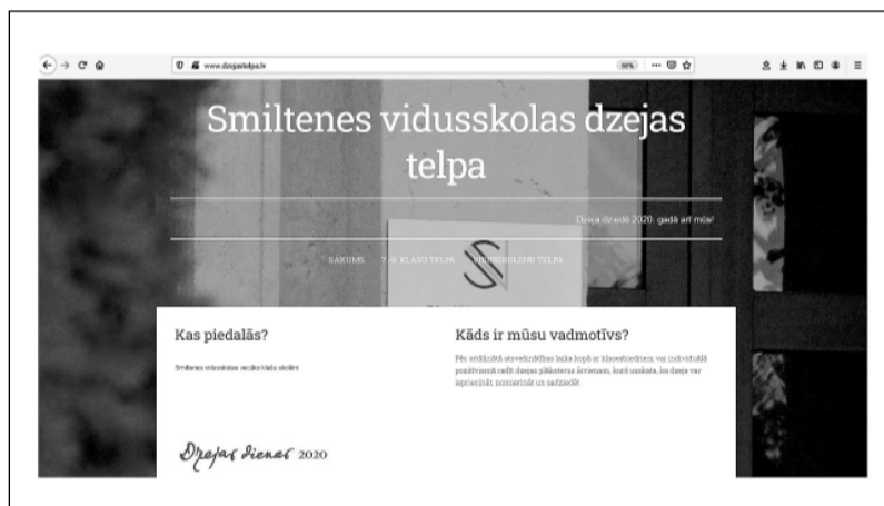
Ikviena interesents mīļi aicināts Smiltenes vidusskolas dzejas telpā - www.dzejastelpa.lv

Ojārs Vācietis, Imants Ziedonis, Smiltenes novada dzejnieki, nezināmi autori un pašu jauniešu sacerētas dzejas rindas. Radošs spēks satuvina pavisam negaidīti.