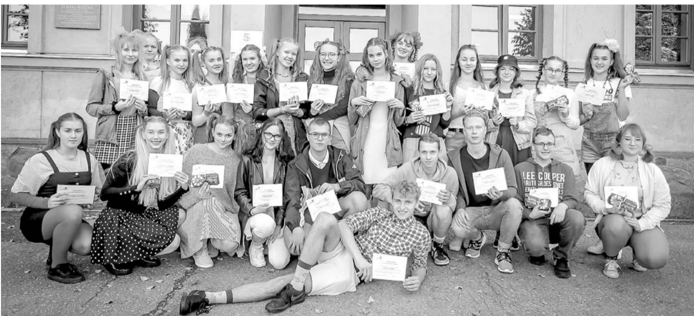
Smiltenes vidusskolas 10. klases stipendiāti.