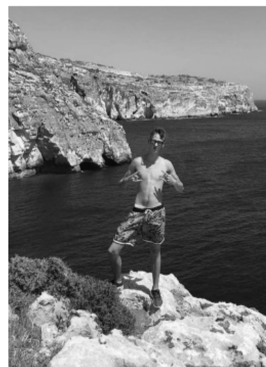
Pēc smagas darba dienas divkārs prieks par atpūtas brīžiem.

Spānijā patiesi tika ļoti stingri ievēroti visi piesardzības pasākumi, lai ierobežotu Covid – 19 izplatību. Izejot uz ielas, ieejot veikalos, iekāpjot sabiedriskajā transportā – visur obligāti jālieto sejas aizsargmaskas un cilvēki to arī tiešām darīja. Melotu, ja teiktu, ka lielajā karstumā tas bija ļoti patīkami. Tas arī, manuprāt, bija mans lielākais prakses laika izaicinājums. Jo neesam pieraduši pie tik liela karstuma. Covid – 19