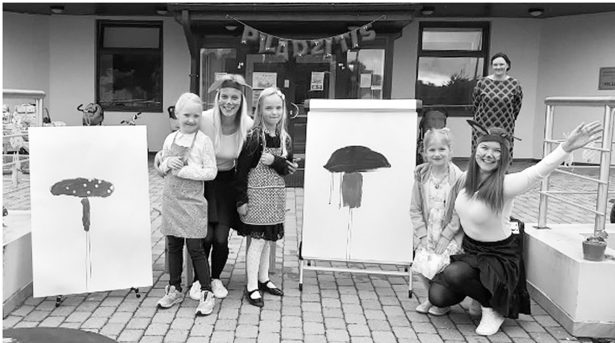
Zinību dienas pasākums „Sēņotāji un blēņotājs”.

Pēc tam kopīgi mūzikas pavadībā veica dažādus vingrojumus un jaunas deju kustības, tā izdancinot visu grupu bērnus. Tā ar aktīvu izvingrošanos arī uzsākām Jauno