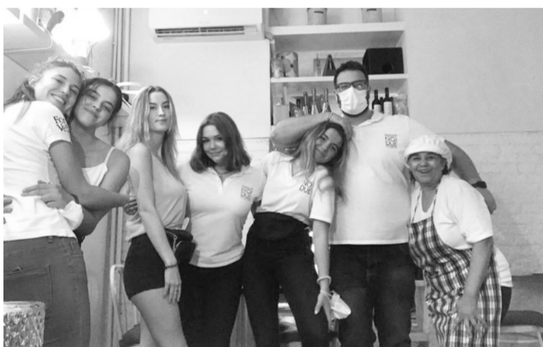
Tehnikuma jauniešiem par praksi ārzemēs ir tikai labas atmiņas.