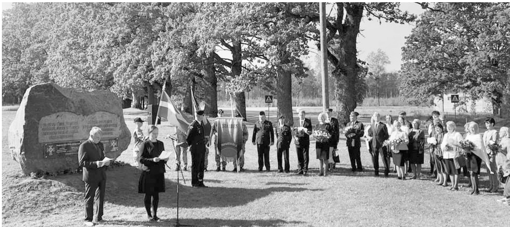
Godinot un atceroties Latvijas neatkarības un brīvības cīnītājus. Autore: Inga Deigele

1929. gadā tika izveidota Cēsu pulka bijušās brīvprātīgo Skolnieku rotas karavīru biedrība, kas aktīvi