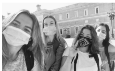
Spānijā un Maltā cilvēki mierīgi pieņem noteiktos piesardzības pasākumus, bet par Covid 19 daudz nerunā,” stāsta tehnikuma jaunieši.

Spānijā patiesi tika ļoti stingri ievēroti visi piesardzības pasākumi, lai ierobežotu Covid – 19 izplatību. Izejot uz ielas, ieejot veikalos, iekāpjot sabiedriskajā transportā – visur obligāti jālieto sejas aizsargmaskas un cilvēki to arī tiešām darīja. Melotu, ja teiktu, ka lielajā karstumā tas bija ļoti patīkami. Tas arī, manuprāt, bija mans lielākais prakses laika izaicinājums. Jo neesam pieraduši pie tik liela karstuma. Covid – 19