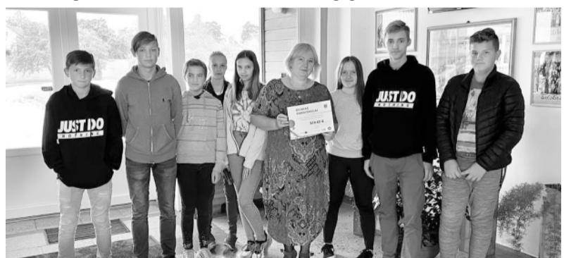
Bilskas pamatskola – ietaupījums 519,62 EUR.