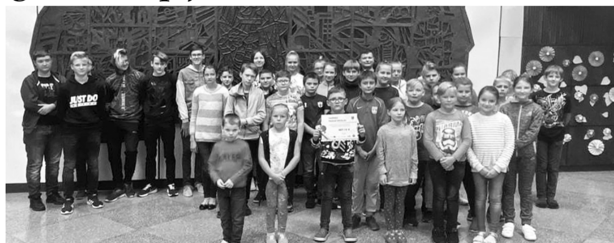
Variņu pamatskola – ietaupījums 687,16 EUR.

Programmas „Efektīvs enerģijas patēriņš izglītības iestādēs” ietvaros Vidzemes plānošanas reģions izstrādāja mācību materiālus par dažādām enerģijas taupīšanas iespējām, kas ietver tēmas: Enerģijas patēriņš ēkās; Apkure; Elektrība; Enerģijas veidi; Klimata pārmaiņas; Apgaismojums; Ventilācija; Ūdens; Energoplānošana; Atkritumi. To