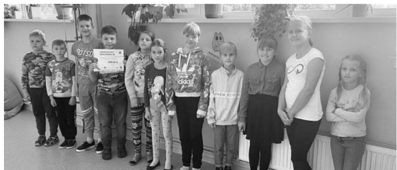
Launkalnes sākumskola – ietaupījums 976,42 EUR.

mērķis ir sniegt saturisku un metodisku atbalstu pedagogiem, skolēnu motivēšanā un sagatavošanā, kļūstot par zinošiem un atbildīgiem enerģijas izmantotājiem.