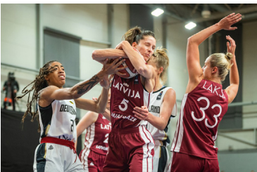
Latvija – Vācija

Spēlē ar Vācijas basketbolistēm tika piedzīvots zaudējums... Neveiksme sarežģīja Latvijas komandas izredzes kvalificēties finālturnīram, atkāpjoties apakšgrupā uz trešo pozīciju.