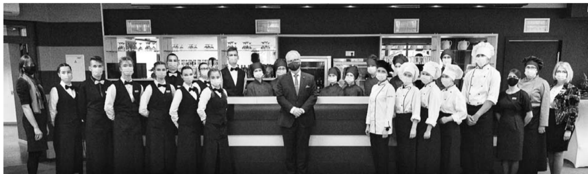
E. Levits kopā ar tūrisma nozares topošajiem speciālistiem.