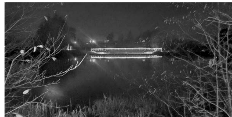
Izgaismotaits tiltiņš pār Tepera ezeru.

Pasākuma laikā tika ievēroti visi piesardzības pasākumi. Pasākums tapis projekta „Pasākumi vietējās sabiedrības