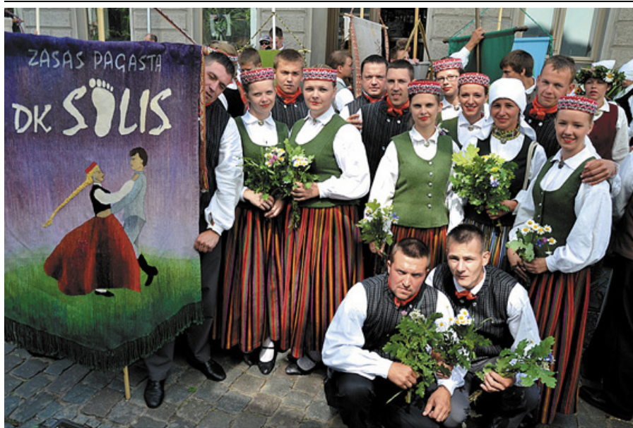
Zasas kultūras nama jauniešu deju kolektīvs „Solis” XXV Dziesmu un XV Deju svētku gājienā.

Šajā vasarā norisinājās lielākais dziedātāju un deju kolektīvu pasākums – XXV Dziesmu un XV Deju svētki. Četrus gadus laikā gan deju kolektīvi, gan dziedātāji nopietni mācījās repertuāru, kā arī cīnījās skatēs, lai piedalītos šajos svētkos.