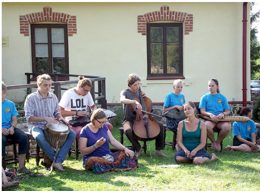
Muzicē folkloras kopa „Dārdi”.