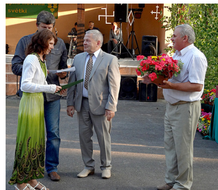
Skates noslēguma pasākums.