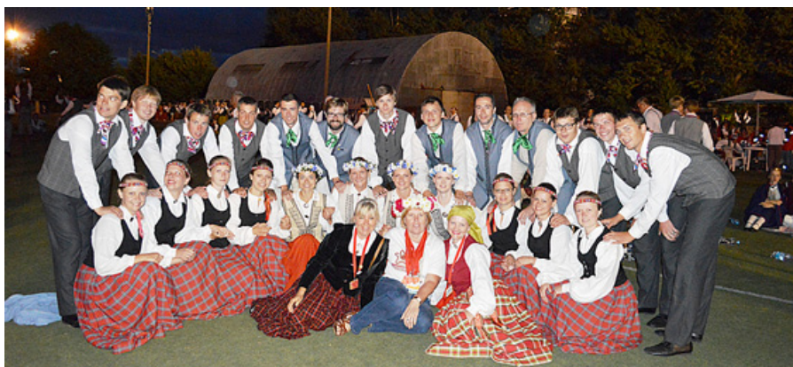
DK „Laude” ar „Pērkonīti” no Losandželasas.

Neticami, ka aizritējis jau mēnesis kopš Dziesmu svētkiem, bet emocijas par Rīgā pavadīto laiku nav kļuvušas ne par toni bālākas. Noberztie papēži sadziedēti, sejas atguvušas normālu krāsu, un miega bads beidzot likvidēts. Visu negatīvo aiz-