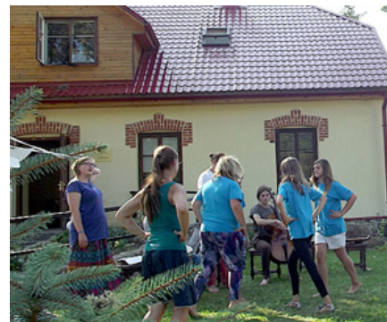
Izdejo latviskās dejas.