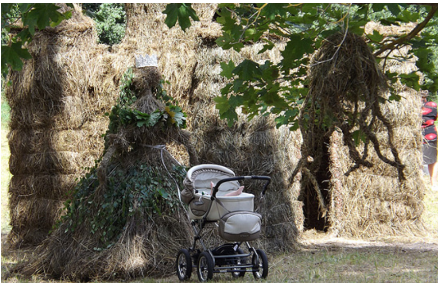
Siena princesei uzticēts īsts mazulis.