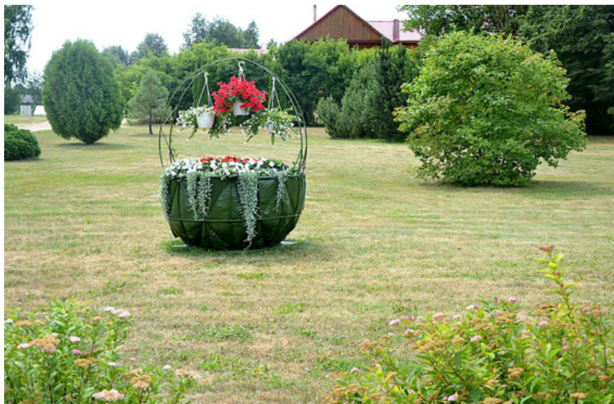
Dunavas pagasta sakoptais centrs.