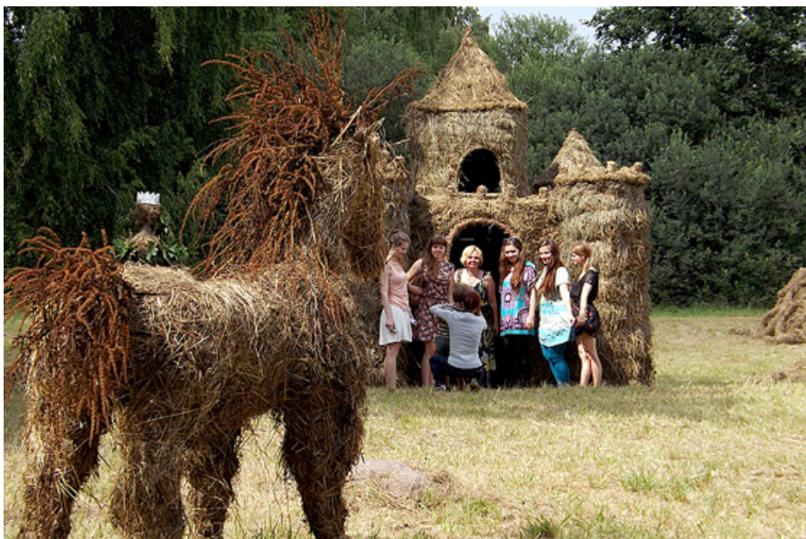
„Sus Dungo” meitenes pie siena pils.