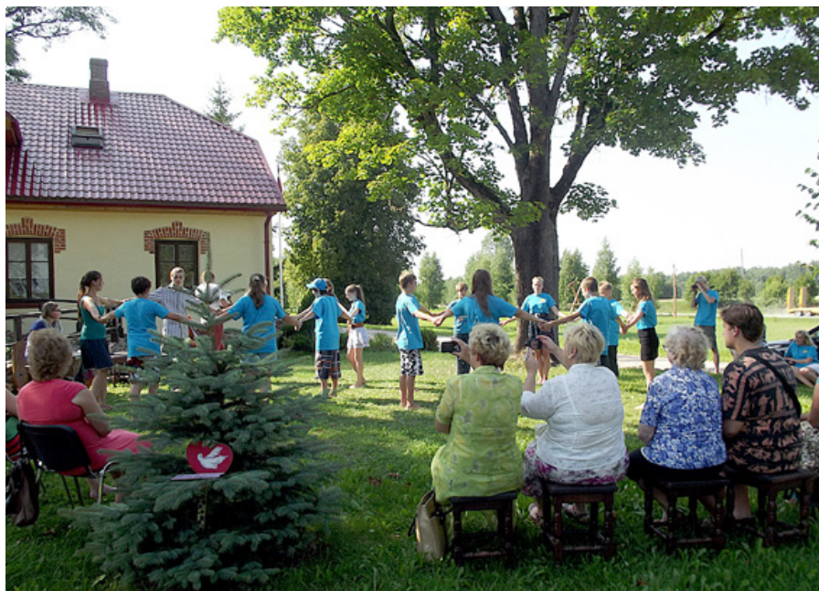
Jaunieši nometnes laikā iemācījušies tautas dejas.