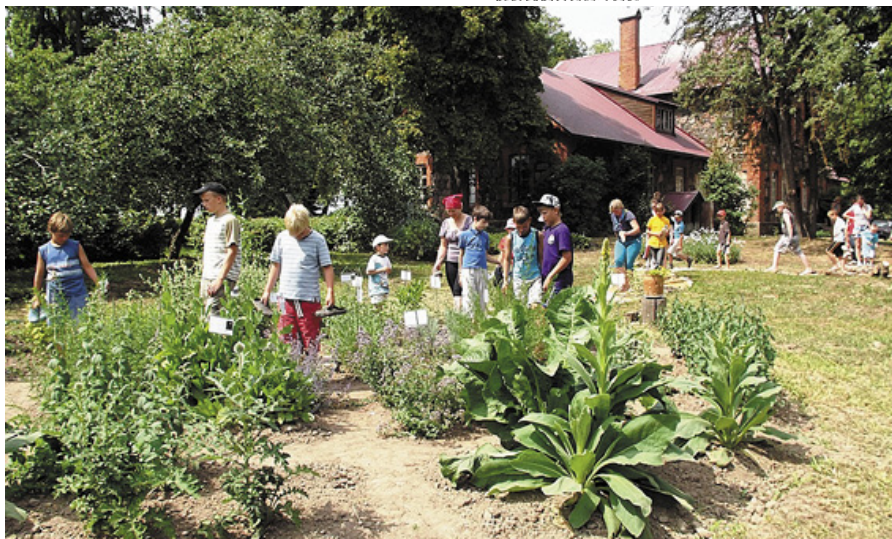
Bērni iepazīstas ar augiem.