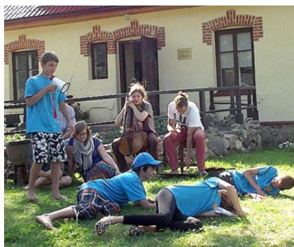
Uzvedums par nometnes gaitu.