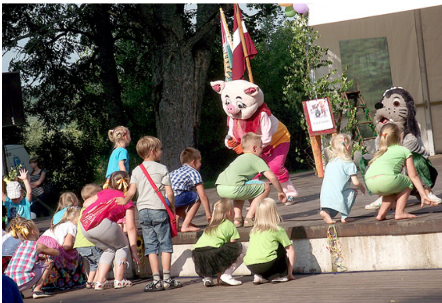
Bērni līksmo Saldumu svētkos.

Pasākuma laikā tika aizsākta novada garā šalle. Tās adīšanā varēja piedalīties ikviens interesents. Dzīparu rakstos