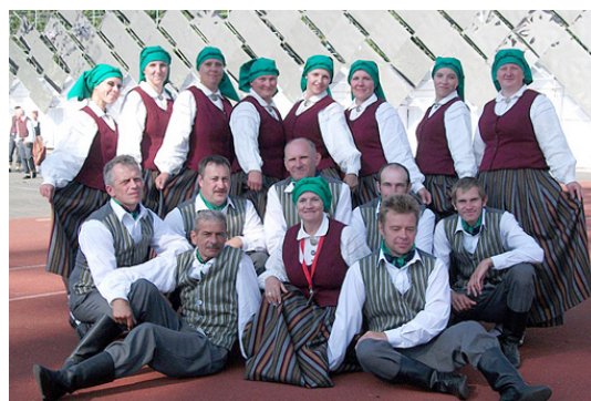
Deju kolektīvs „Luste”.

Deju svētki deva tikai un vienīgi pozitīvas emocijas. Protams, visa pamatā ir grūts darbs, kas tika ieguldīts, lai sniegtu gandarījumu ne tikai skatītājiem, bet arī pašiem dalībniekiem. Tā apziņa, ka es tur biju un es tur piedalījos, liek aizmirst visus grūtus brīžus. Gandarījums par padarīto