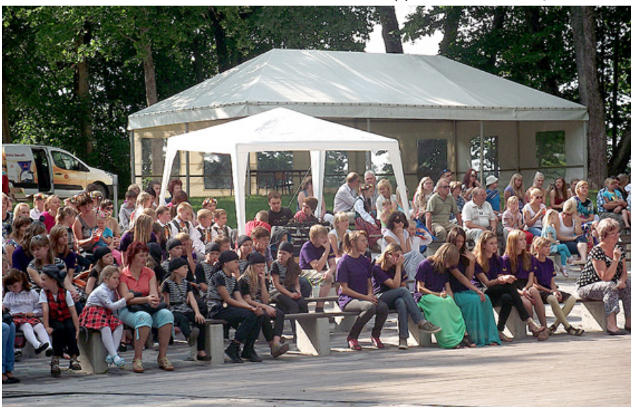
Pasākuma dalībnieki Ābeļu pagastā.

un saskaņu novadā. Ābeļiem – vasaras košās krāsas, Dunavai – Daugavas zilie ūdeņi un mazliet saulītes, Dignājai – vairāk zemes un dabas krāsas.