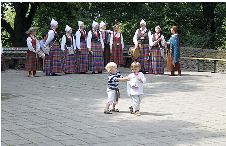
Folkloras kopa „Kāre” koncerta laikā.