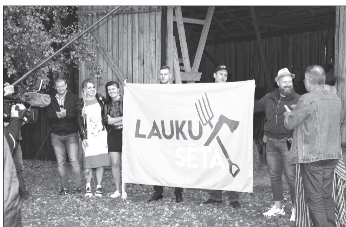
Dāvanā mājas saimnieki saimnieki saņēma „Lauku sētas” karogu, kas viennēr atgādinās par pagājušās vasaras notikumiem.