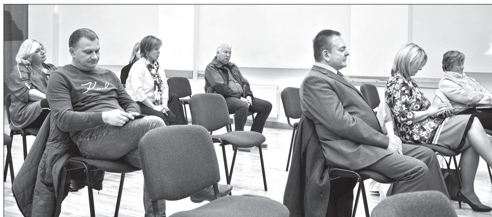
Uz tikšanos bija ieradušies arī Rojas novada uzņēmēji.

kur atrodas uzņēmēji, kādas komunikācijas un ielas pieiet viņu ražotnēm, kur ir brīvās uzņēmēju zonas utt. Gadījumos, ja nāks investors vai uzņēmums gribēs attīstīties, viņiem būs pieejama šī sistēma un iespēja uzzināt, piemēram, vai tā ir privāta teritorija vai pieder pašvaldībai. Šī sistēma ļaus ātrāk un efektīvāk pašvaldībām apgūt Eiropas Savienības līdzekļus, jo viņi zinās gan atrašanās vietu, gan tuvākās prog-