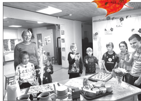
Svētku dalībnieki ar pašu gatavotajām kūkām.

Pasākuma dalībnieki baudīja pašu gatavoto cepumu kūku, kas dekorēta ar šokolādes glazūrā uzrakstītiem zēnu un meiteņu vārdiem. Centrs tika uzposts ar dažādiem bērnu gata-