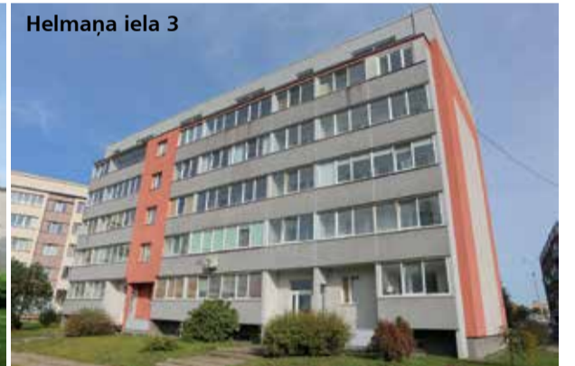
Helmaņa iela 3

Turpinoties māju siltināšanas procesam, kas ļauj ne tikai uzlabot mājokļa energoefektivitāti, bet arī vienoti un vizuāli pievilcīgi sakārtot balkonus un iestiklot lodžijas, balkonu jautājums pamazām pilsētā tiek risināts.