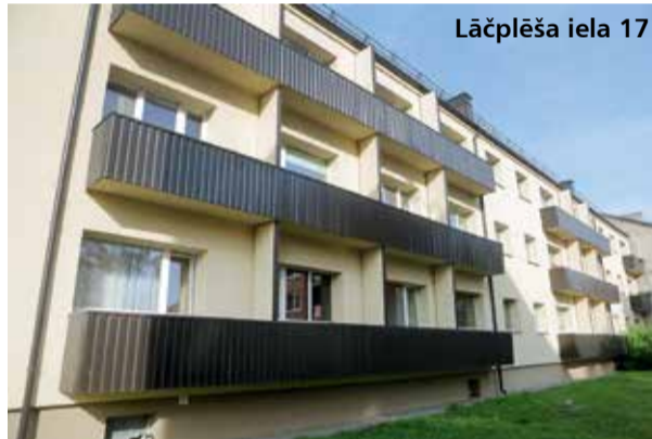
Lāčplēša iela 17