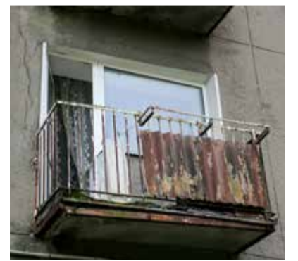
Pastiprināta uzmanība ir jāpievērš balkonam norobežojošo konstrukciju tehniskajam stāvoklim, īpaši to stiprinājumam pie ēkas, jo tas var nebūt drošs.