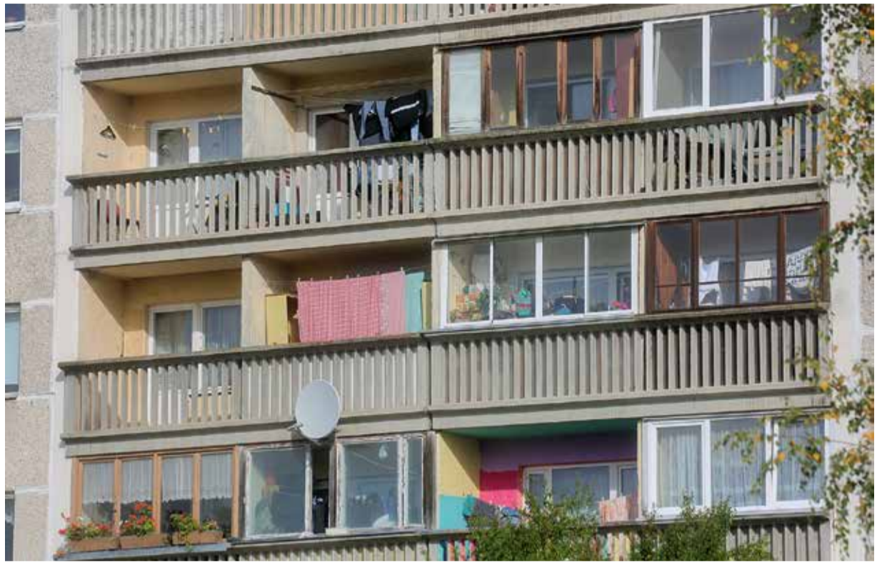
Iedzīvotāji joprojām pilsētā nesaskaņoti iestiklo lodžijas, kas varbūt nerada tiešu bīstamību ēkas tehniskajam stāvoklim, taču vizuāli bojā daudzdzīvokļu mājas fasādes izskatu.

Taču ne vienmēr vienīgais risinājums ir balkonu kapitālais remonts. Viens no variantiem ir nedrošo balkonu demontāža. Protams, arī šajā gadījumā nepieciešams dzīvokļu īpašnieku lēmums un finanšu resursi. Pēc