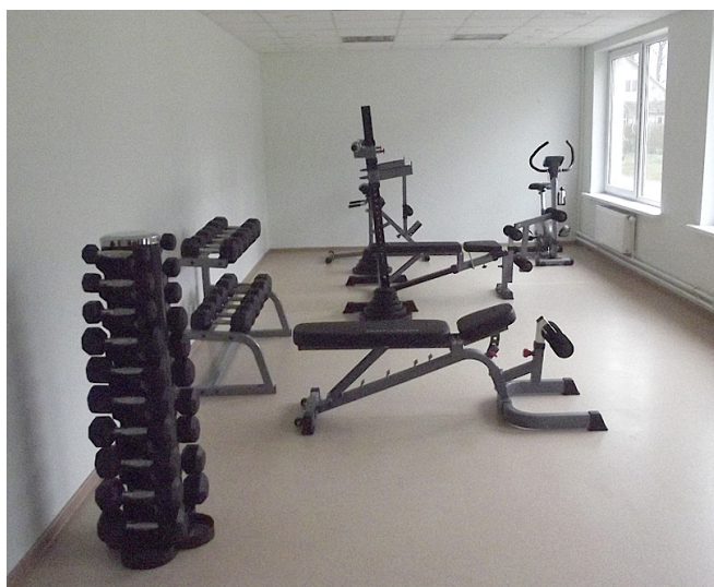
Ābeļu sporta centrs.

tiek īstenots, lai nodrošinātu ar tautas tēpu elementiem divus deju kolektīvus Jēkabpils novada Rubeņu ciemā. Kopējais 2013. gada 12. decembris