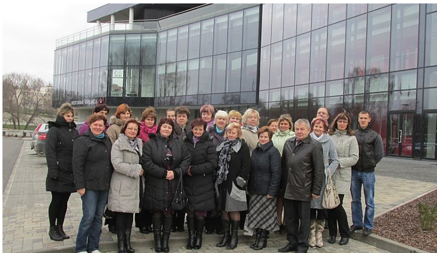
Pie Rēzeknes koncertzāles.

Koncertzāle Latgales vēstniecība „Gors”. Te satek kultūras mantojums un senas vērtības, tradīcijas un jaunrade, valoda un notikumi, nozīmīgākās pasaules tendences, māksla, kultūra, dejas un dziesmas. Te satiekas jaunie un vecie, saimes un dzimtas, savējie un aicinātie. Te dzimst un dzīvo nebijušas, aizraujošas idejas – īsts, radošs, skaists gars. Kultūras centrs, koncertzāles, kino, dzīves vieta māksliniekiem, izstāžu vieta mākslai, restorāns dzīves baudīšanai, vieta eksperimentiem ar visam maņām. Tā raksturo jauno koncertzāli Latgalē. Emocijas un atzinumi par jauno kultūras un gaismas pili katram citādāki. Koncertzālei priekšā liels, skaists parks ar vasaras estrādi, kanāls un gājēju promenāde, tiltiņš nu jau tapis par tiltu, apgaismojums. Tajā dienā lielā zāle tika gatavota rokoperas „Lāčplēsis” izrādēm. Bija paredzēti 2 koncerti un jau tirgoja biļetes uz vēl diviem papildus kon-